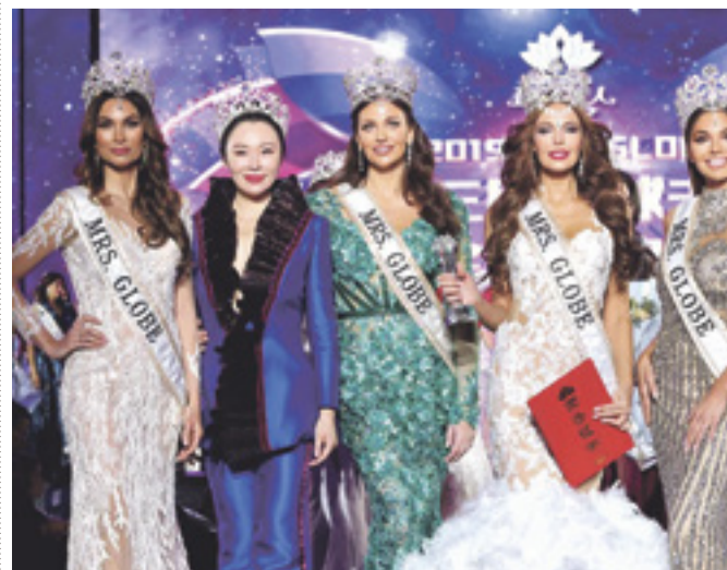
■ В сложносочиненном платье с летящим пухом и нежными белыми лепестками непросто было ходить по сцене