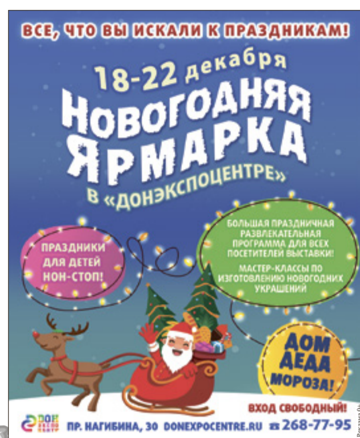
ВСЕ, ЧТО ВЫ ИСКАЛИ К ПРАЗДНИКАМ! 18-22 декабря НОВОГОДНЯЯ ЯРМАРКА В «ДОНЭКСПОЦЕНТРЕ» ПРАЗДНИКИ ДЛЯ ДЕТЕЙ НОН-СТОП! БОЛЬШАЯ ПРАЗДНИЧНАЯ РАЗВЛЕКАТЕЛЬНАЯ ПРОГРАММА ДЛЯ ВСЕХ ПОСЕТИТЕЛЕЙ ВЫСТАВКИ! МАСТЕР-КЛАССЫ ПО ИЗГОТОВЛЕНИЮ НОВОГОДНИХ УКРАШЕНИЙ АОМ АЕДА МОРОЗА! ВХОД СВОБОДНЫЙ! ПР. НАГИБИНА, 30 DONEXPOCENTRE.RU ☎ 268-77-95

14. Сальский район По завершению осенних полевых работ в районном доме культуры состоялось торжественное мероприятие, на котором Благодарственные письма и денежные премии получили лучшие коллективы и работники агропромышленного комплекса района.