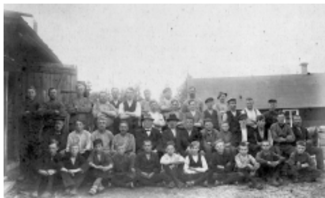
Arbetsstyrkan med alla barnen i förgrunden.

I varje verkstad i glashyttan fanns förr i tiden också hyttpojkar (på småländska hyttluar ) som skötte enkla sysslor som att hålla formen, bära fram ved och dricksvatten till glasarbetarna och allmänt finnas till hands. Under 1800-talet hade reglerna för att anställa barn inom industrin skärpts. Glasindustrin gjorde sig känd som en bransch som kategoriskt bröt mot lagen från 1882 som begränsade barnarbetet. Fortfarande i början av 1900-talet var det vanligt att barn fick anställning i hyttan. När inspektörer kom till hyttorna skickades barnen hem tillfälligt. För en fattig torparfamilj med flera barn var det lockande att låta barnen ta anställning i hyttan för att bidra till familjens försörjning. Varje öre var värdefullt. I hyttan i Bergdala arbetade barn under 10 år fortfarande i början av 1900-talet och här hände det att även flickor fick anställning, vilket inte var vanligt.