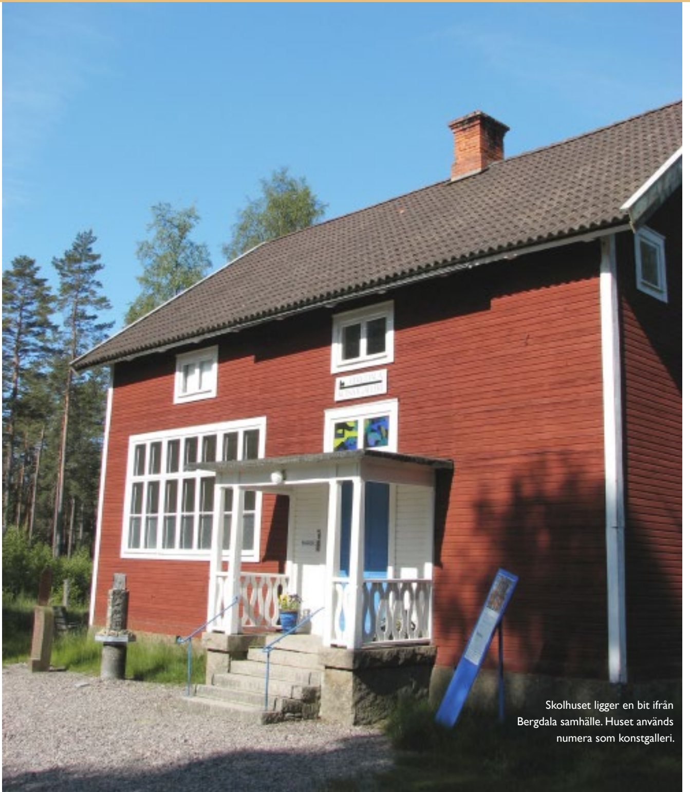
Skolhuset ligger en bit ifrån Bergdala samhälle. Huset används numera som konstgalleri.