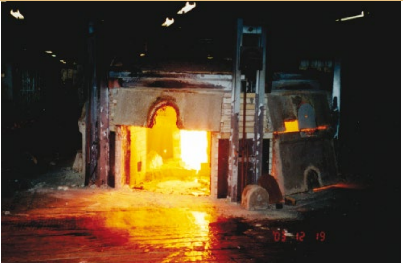
Ugnen öppnad för degelbyte.

11 september 1981 då hyttan återigen totalförstördes i en brand. Efter branden byggdes den nya hyttan upp som finns här idag. Dessutom byggdes då nytt sliperi och ny mängkammare.