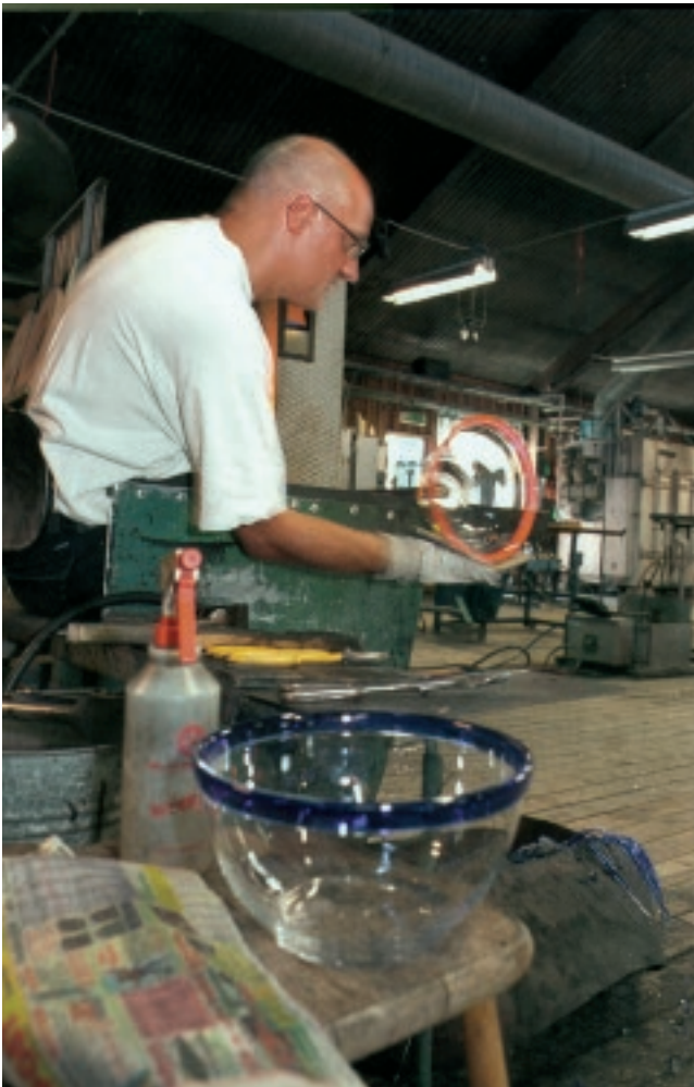
Den blå randen är ett kännetecken för glas från Bergdala.