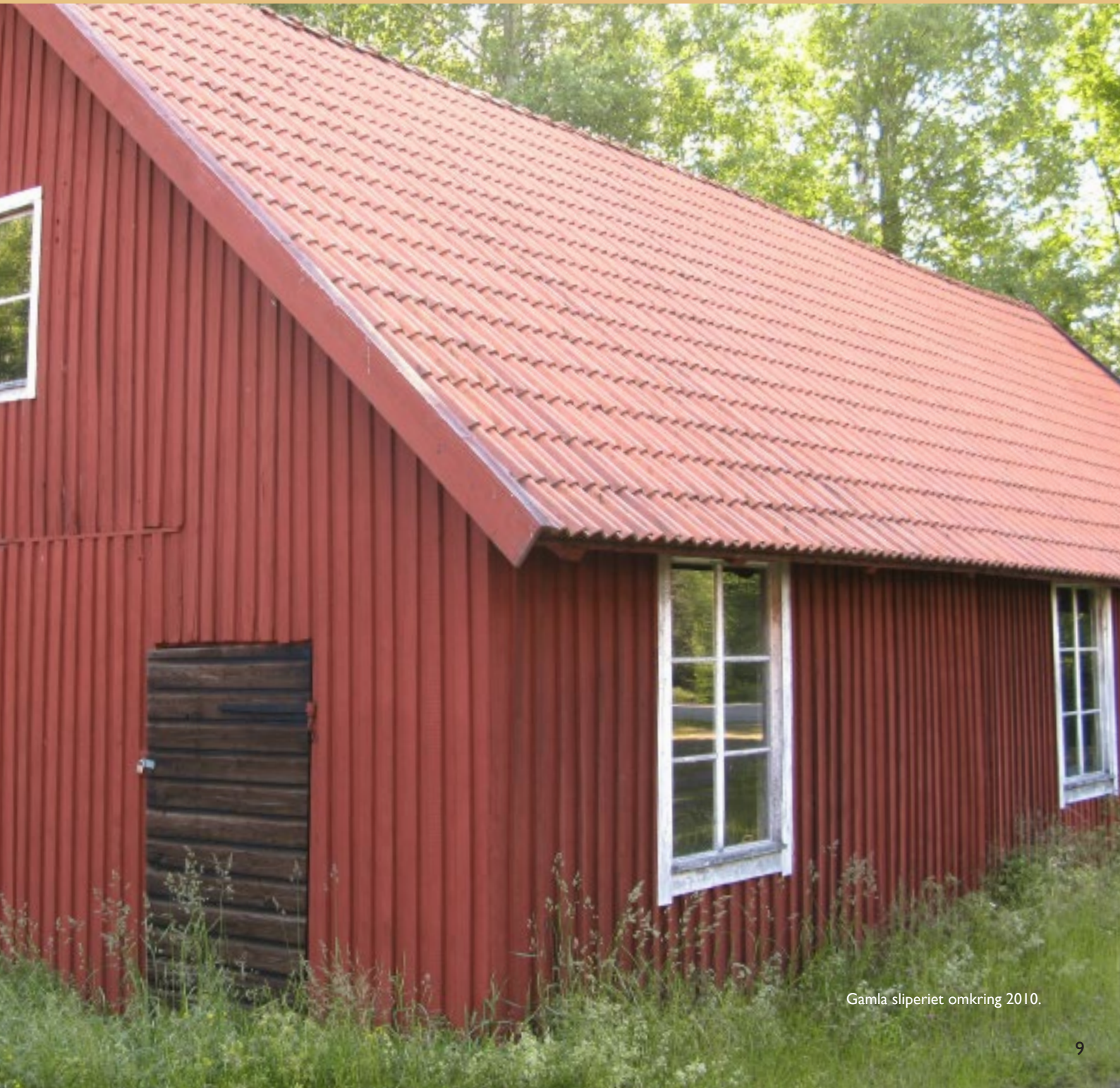
Gamla sliperiet omkring 2010.