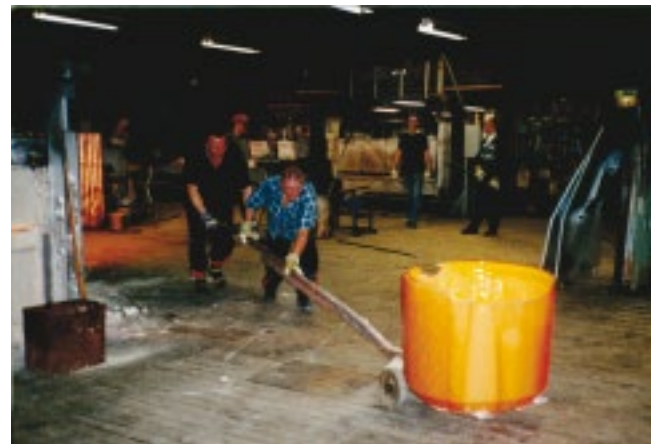
Den heta degeln har tjänat ut och ersätts med en ny.

Produktionen i hyttan i Bergdala har under senare år bestått av de kassiska skålarna, faten, glasen och kannorna med blå kant samt konstglas.