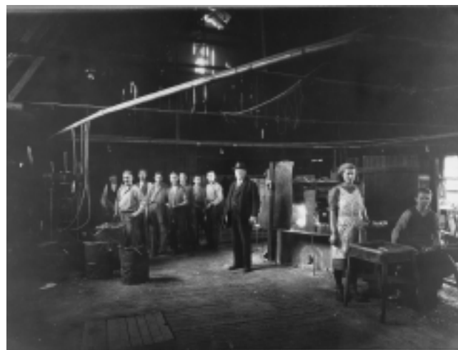
Arbetsstyrkan i hyttan, bestående av män och en kvinna.