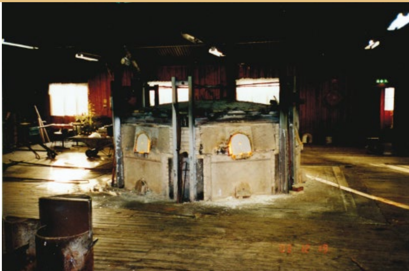
I Bergdala smälte man länge glas i en så kallad rundugn.