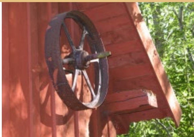
Del av gamla sliperiets bevarade transmissionsanordning.