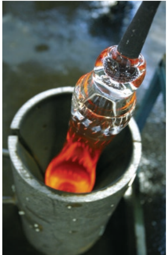
Blåsning av glas i form.