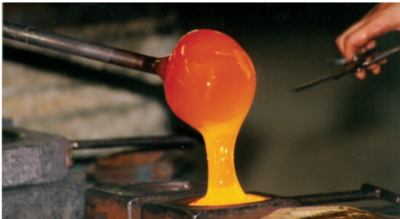
Gjutning av glas i form. Formar och glaspipor var verktyg som förr tillverkades i brukets smedja.