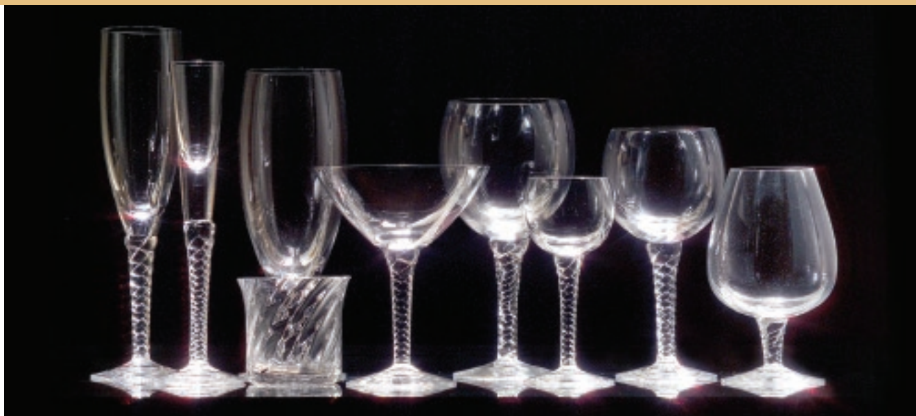
Glasservisen Twist med tvinnad fot.