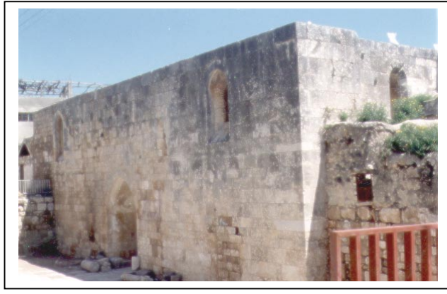
الصورة 3: آثار في قرية سبسطية الأثرية