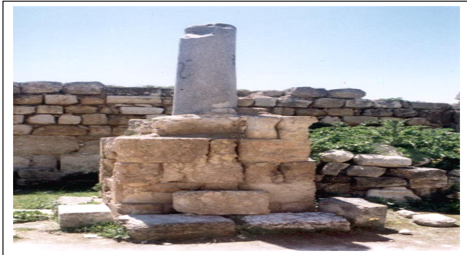
الصورة 2: آثار في قرية سبسطية الأثرية

يعاني التجمع من عدة مشاكل تعيق الإنتاج الزراعي فيه، وهي نقص المال والعمالة اللازمة، بالإضافة إلى وجود مشاكل في تسويق المنتجات الزراعية. ويعاني التجمع من عدة مشاكل في مجال الصناعة التحويلية والتعدين والمحاجر، تتمثل في نقص رأس المال والعمالة. كما يعاني التجمع من عدة مشاكل في مجال الكهرباء ومياه الشرب تتمثل في قدم شبكتي الكهرباء والمياه، وضعف التيار الكهربائي وتلوث المياه.