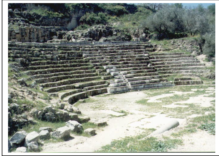
الصورة 1: قرية سبسطية الأثرية

يعتبر هذا التجمع ريفاً وذلك حسب تصنيف نوع التجمع المعتمد في الجهاز المركزي للإحصاء الفلسطيني. يقع تجمع سَبَسْطِيَّة شمال غرب مدينة نابلس، على خط إحداثي محلي شمالي 186.93 م، وخط إحداثي محلي شرقي 168.65 م، ويرتفع عن سطح البحر 420 م، ويبعد عن مدينة نابلس 12 كم، وتبلغ مساحته الكلية 5066 دونماً، ومساحة المنطقة المبنية فيه 136 دونماً، وتحيط به أراضي بُرْقَة وبيت إمرين وإجْسِنِيَا والناقُورَة ونِصْف جُبَيْل ودير شَرَف. ويبلغ عدد سكان التجمع حسب تعداد السكان والمساكن والمنشآت - 1997، 2171 فرداً منهم 1093 ذكراً و1078 أنثى، ويبلغ عدد الأسر 410 أسر. كما يبلغ عدد المباني 406 مبانٍ وعدد الوحدات السكنية 468 وحدة. ويدير تجمع سَبَسْطِيَّة مجلس بلدي تم تكليفه عن طريق التعيين من قبل وزارة الحكم المحلي ويتكون من 12 عضواً، جميعهم ذكور. ويتوفر مقر للمجلس البلدي تبلغ مساحته 150 م 2 . ويعمل في المجلس البلدي 7 موظفين ذكور وموظفة واحد. أما أهم الحاجات التطويرية للسلطة المحلية فيه فهي توفير أجهزة حاسوب للمجلس. ويوجد في تجمع سَبَسْطِيَّة خمسة مواقع أثرية جميعها مؤهلة للسياحة ويرتادها السياح، وهي البيادر، والقلاع، وشارع الأعمدة، والجامع، والحفريات الحارة الشرقية.