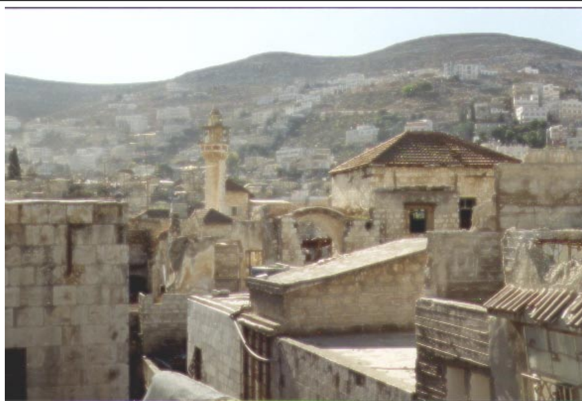
الصورة 5: القديمة في