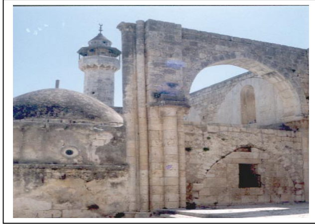
الصورة 4: آثار في قرية سبسطية الأثرية