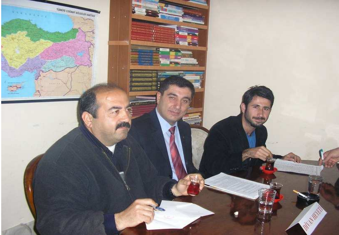
Yönetim kurulu seçiminden bir görüntü.