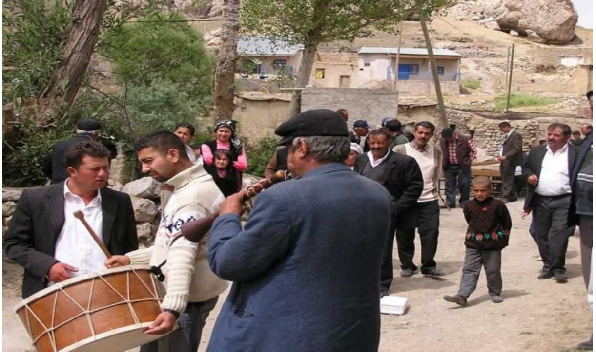
Davul ve zurna ile yapılan köy düğünü.