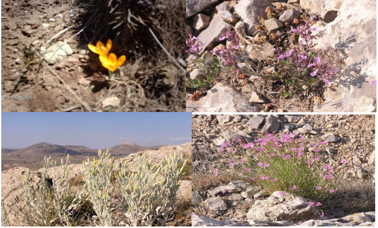
Çeşitli bitkiler ve çiçekler.