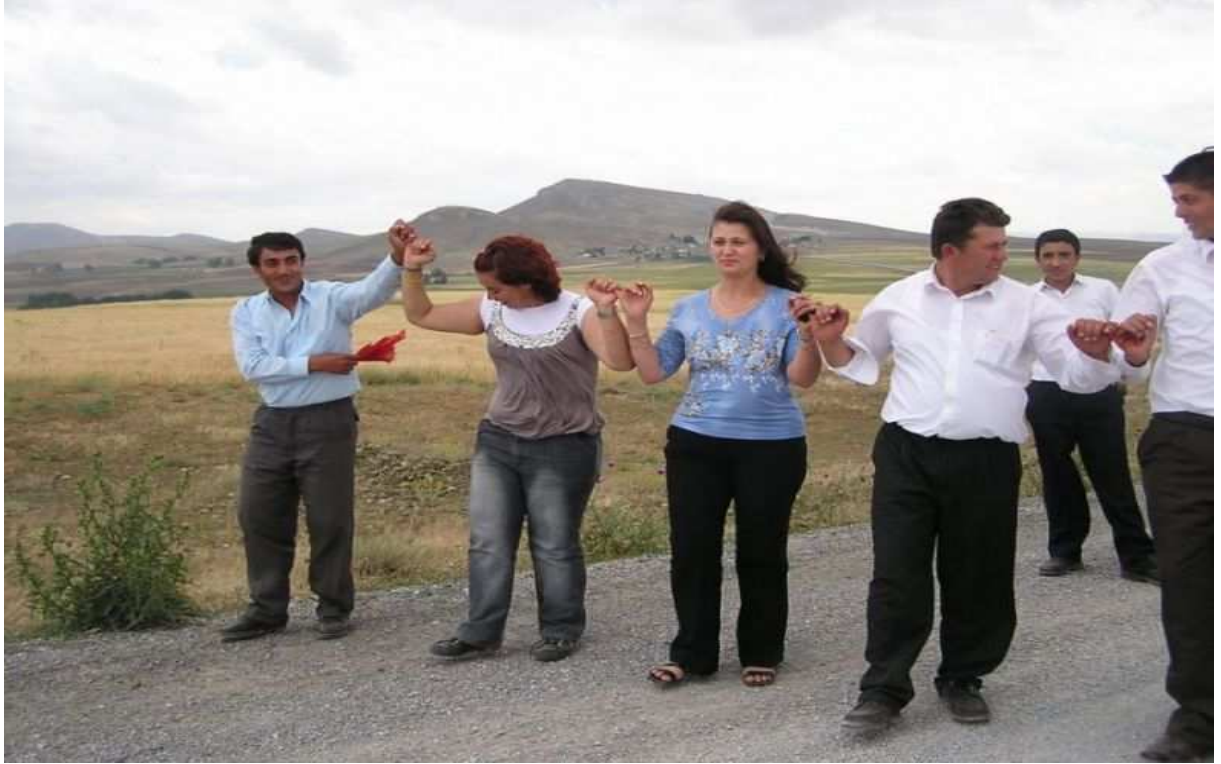
Gelin gezdirme adeti(yenge binme)