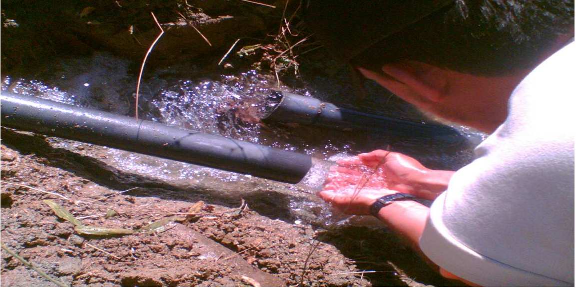
Patlayan su şebekesinden bir kesit.

Muhtar Hüseyin YANIK'IN ilk muhtarlık döneminde köy içinde uygun bir yerde sondaj çalışması yapılmış, buradan su deposuna boru hattı da döşenmiştir. Fakat bu proje bazı sebeplerden dolayı uygulamaya konulamadı. Bunların yanı sıra birde şebeke suyu ile bostan ve bahçe sulayan köylülerimizin de bulunması su sıkıntısını hat safhaya ulaştırmıştır.