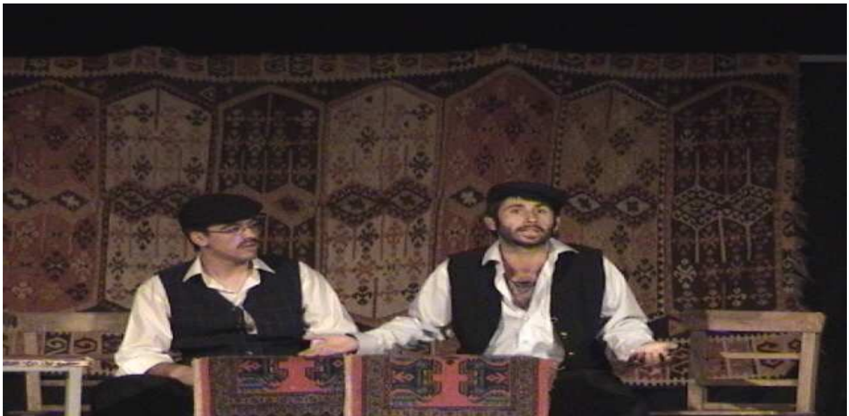
Dernek tiyatro gösterisi.