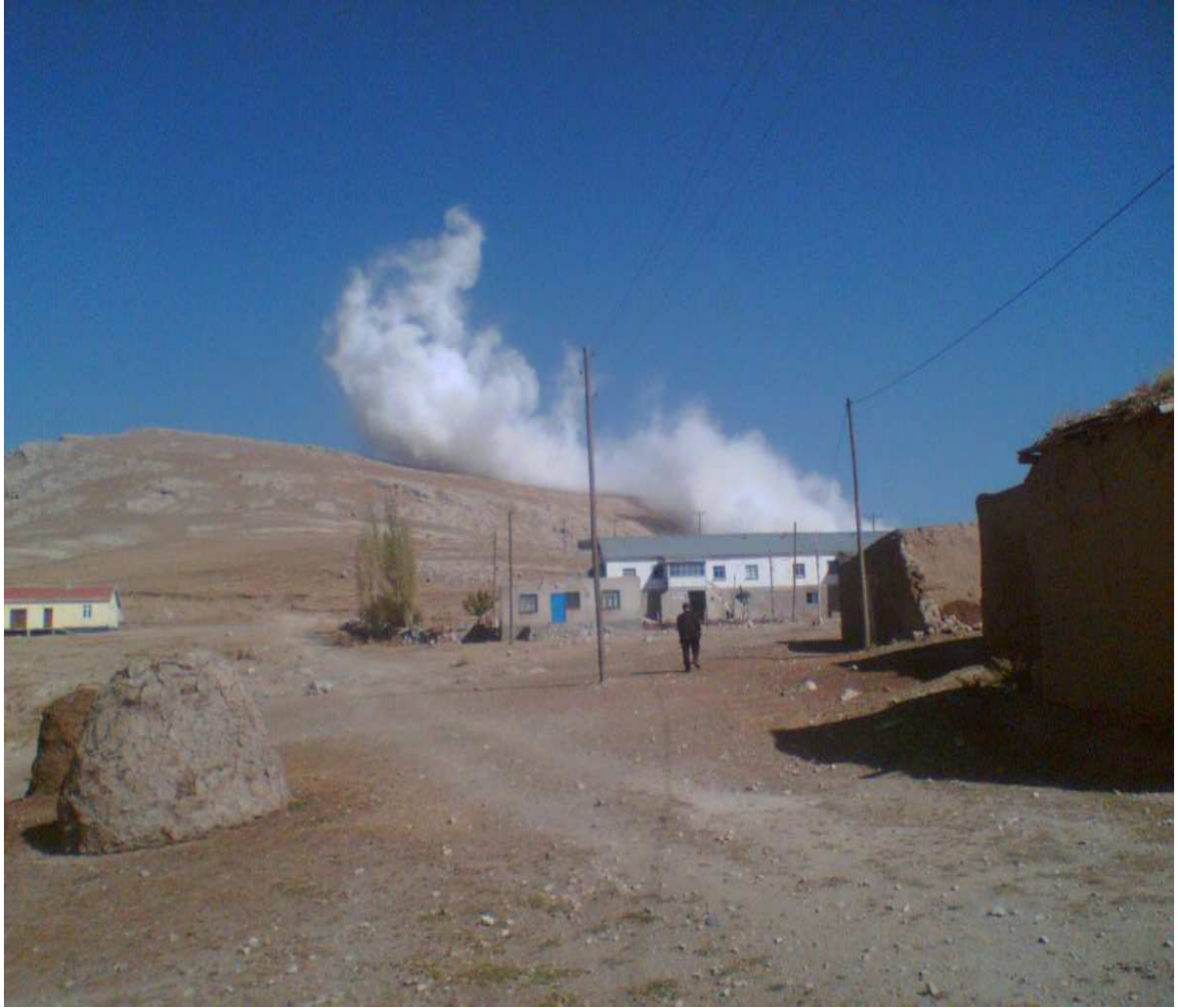
Taşocağından çıkan toz.

Bunların dışında taş ocağı köyün hemen yanı başındadır ve çalışmaya devam etmektedir.