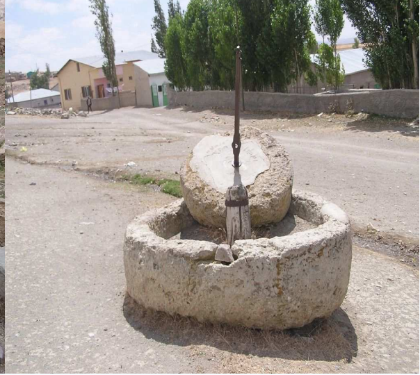
Aşağı mahallede ki Seten.