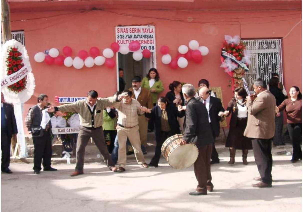
Derneğimizin açılış töreni.

Seyder Adana'da faaliyet göstermektedir. Bunun yanı sıra Ankara ve Serinyayla temsilcilikleri de bulunmaktadır. Umarız ki bundan sonrada seyder her zaman var olmaya devam eder.