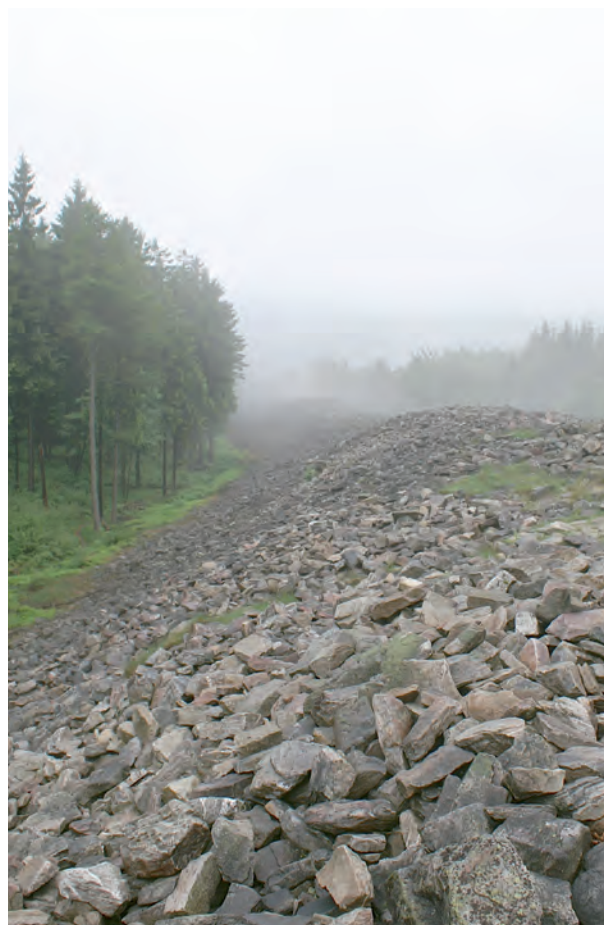
Der keltische Ringwall von Otzenhausen / Le rempart celte d'Otzenhausen.

La construction actuelle du parc celte avec l'hameau celte en tant que lieu d'apprentissage extrascolaire constitue la prochaine étape en vue de la valorisation du monument, car elle crée un nouveau lien entre celui-ci et le visiteur. La culture celte doit devenir 'palpable' pour les visiteurs grâce aux concerts et autres événements culturels organisés régulièrement à cet endroit. Ce concept permet également aux visiteurs de découvrir et apprendre les aspects de l'univers de l'Antiquité, par exemple lors d'ateliers axés sur les anciennes techniques artisanales. Les expositions temporaires viseront à thématiser les divers domaines de l'histoire des Celtes et de la région du parc national. Le parc celte deviendra la porte