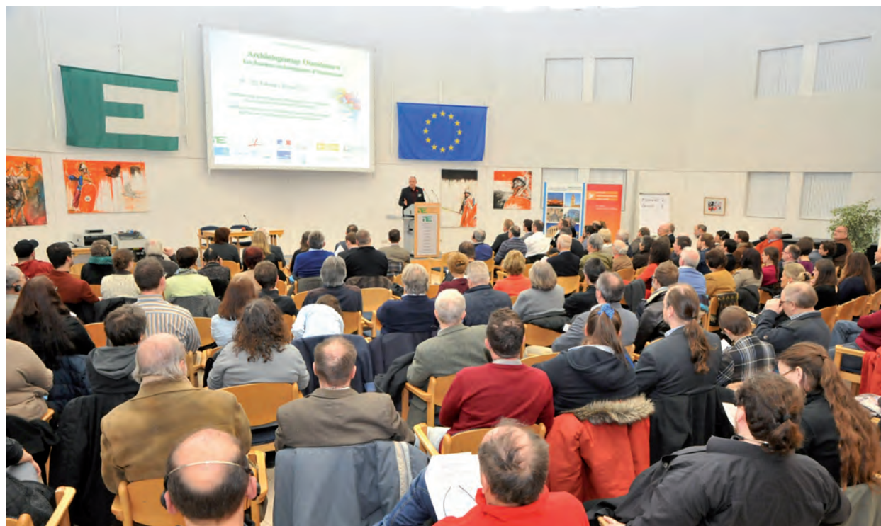
Das Symposium richtet sich an Fachleute, Heimatforscher und interessierte Laien aus der Großregion / Le symposium s'adresse aux experts, chercheurs en histoire régionale et personnes privées passionnées par le thème venant de la Grande Région.

Und weiterhin gilt: Auf der anderen Seite der Grenze gibt es weiter hin viel zu entdecken und auszugraben. Seien Sie auch in Zukunft dabei, wenn es um die Vergangenheit geht.