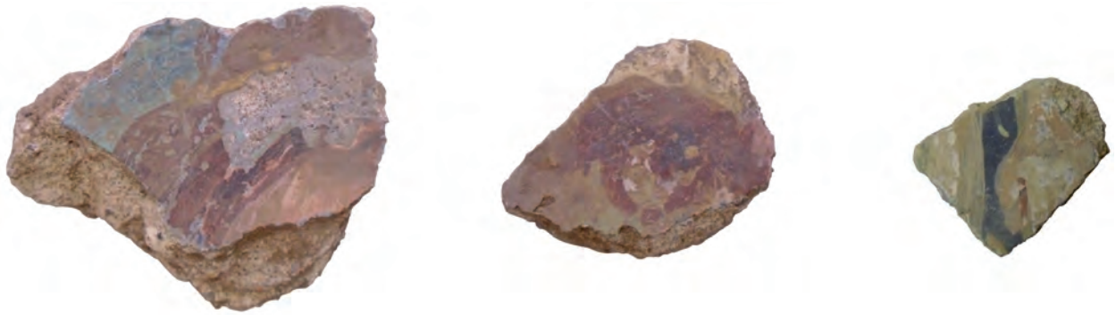
Abb. 3: Details figürlicher Darstellungen (Fotos: D. Busse).

mit der Erweiterung des Hauptgebäudes nach Westen Anfang des 2. Jahrhunderts n. Chr. entstanden sein.