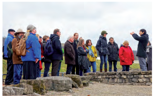
Der „Markt der Möglichkeiten“ mit unterschiedlichen Präsentationen (Abb. 1-3) und die Abschlussexkursion zum Europäischen Kulturpark Bliesbruck-Reinheim (Abb. 4). / Le " Marché des possibilités " avec les différentes présentations (Fig. 1-3) et l'excursion finale au Parc culturel européen de Bliesbruck-Reinheim (Fig. 4).