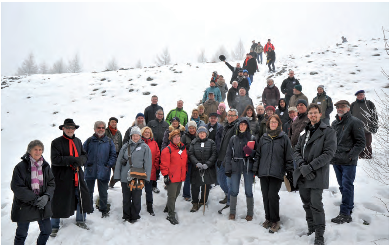
Geführte Wanderung zum keltischen Ringwall, Nordwall. / Visite du monument "Hunnenring", mur nord.

dungsprojektes. Für die Finanzierung und Gewährung von Mitteln sowohl zur Durchführung der Tagung als auch für die Drucklegung dieses Bandes bin ich zahlreichen Institutionen zu Dank verpflichtet – unter anderem der KulturLandschaftsInitiative St. Wendeler Land e.V. (KuLanI), der Gemeinde Nonnweiler, der Europäischen Akademie Otzenhausen gGmbH und der Stiftung europäische Kultur und Bildung. Den Kooperationspartnern sei für ihre mannigfaltige Hilfestellung und gute Zusammenarbeit ebenfalls Dank ausgesprochen: dem Institut national de recherches archéologiques préventives (Inrap – Metz), den D'Georges Kayser Altertumsforscher a.s.b.l. (Luxemburg) sowie dem örtlichen Archäologieverein Freundeskreis keltischer Ringwall Otzenhausen e.V.