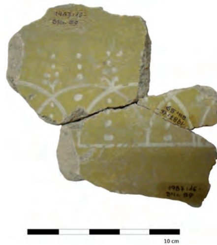
Abb. 2: Bordürenfragment auf ockergelbem Grund.

derts n. Chr., sodass auch für das Fragment aus Reinheim eine Datierung in diesen Zeitraum anzunehmen ist.