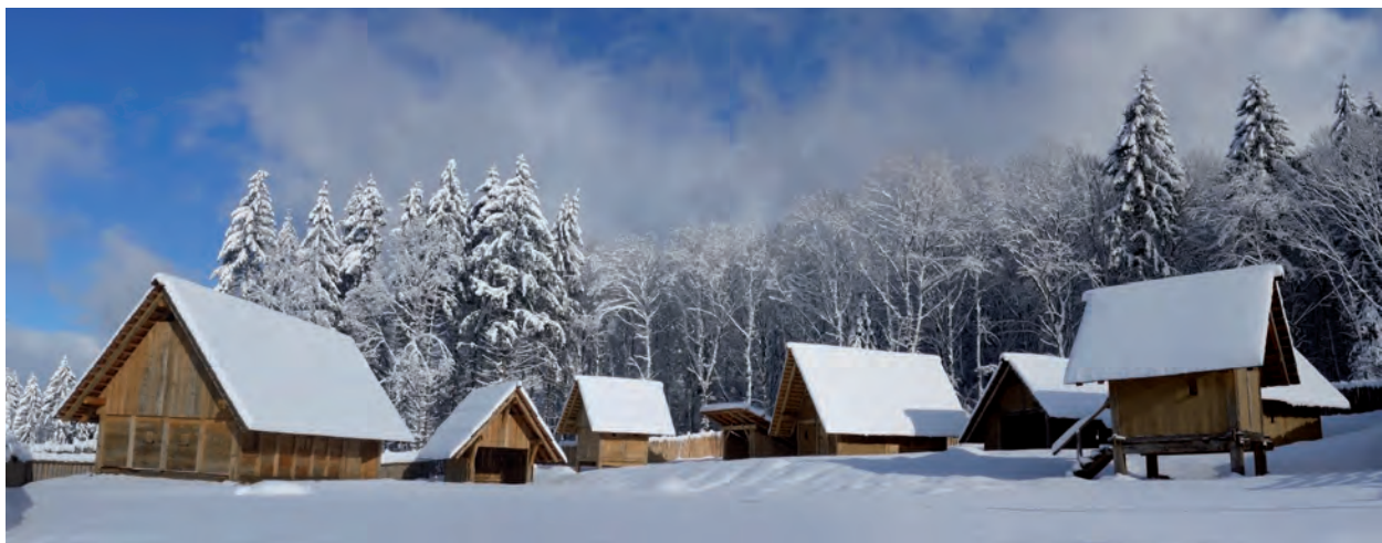
Das Keltendorf im dritten Bauabschnitt, Februar 2015. / L'hameau celtique en février 2015. Troisième phase de construction.

Bildungsseminare wie die Archäologentage in Otzenhausen gehören ebenfalls in diese Entwicklung und flankieren sie. Diese Tagung vermittelt zahlreiche Impulse und trägt zur internationalen Vernetzung von Wissenschaftlern, aber auch interessierten Laien bei. Sie verbindet den Begriff Archäologie mit Otzenhausen, der durch sie zu einem Ort der wissenschaftlichen Begegnung geworden ist. Dafür danke ich den Teilnehmern des Symposiums sowie auch denjenigen, die zu diesem Tagungsband beigetragen haben.