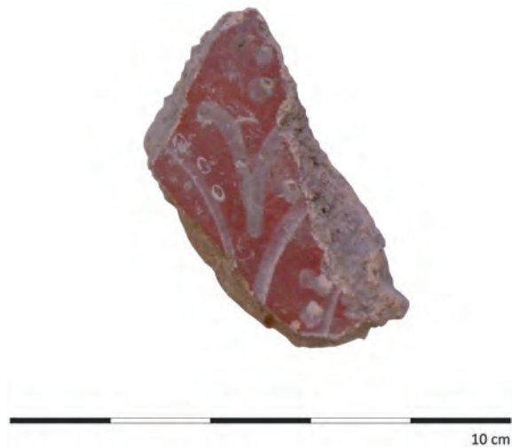
Abb. 1: Bordürenfragment auf dunkelrotem Grund.