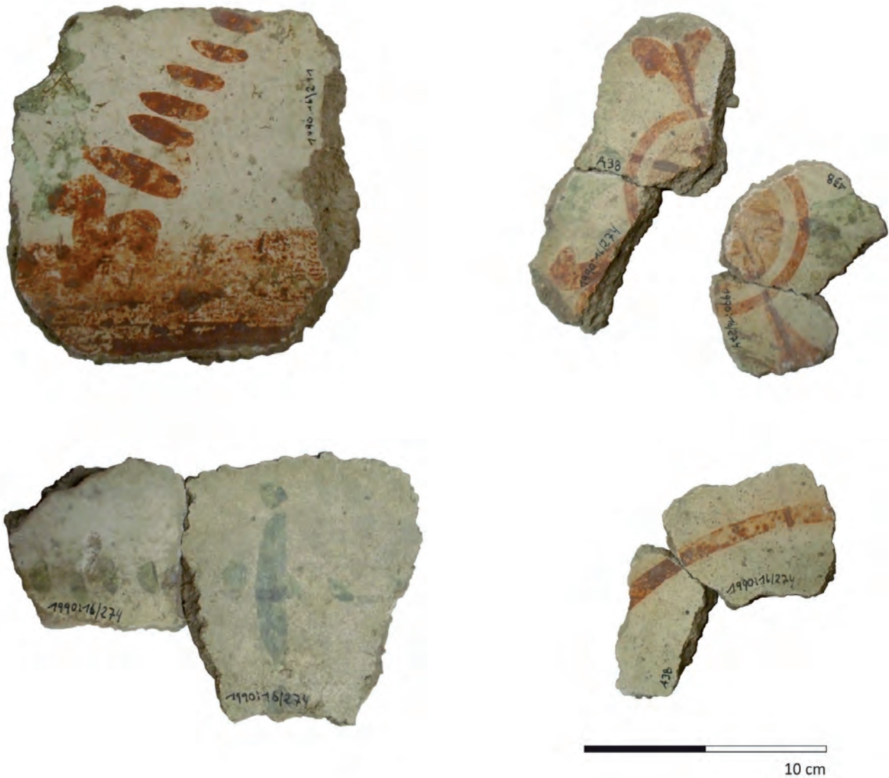
Abb. 5: Ensemble bemalter Putzfragmente, die zu einem Musterrapport gehörten.

Münzdatierte Brandschuttschichten 16 im praefurnium geben sogar einen Zerstörungshorizont für die 1. Hälfte des 4. Jahrhunderts n. Chr. an, der somit zugleich einen terminus ante quem für die Malereifragmente bildet.