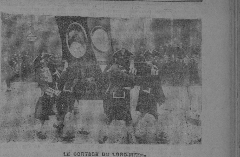
LE CORTEGE DU LORD-MAYOR. Une invitée est transportée à Mansion-House en chaise à porteurs