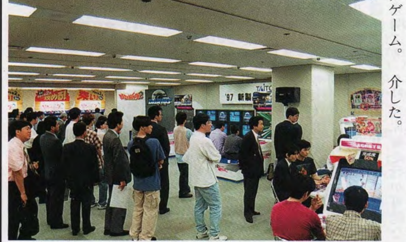
写真はいずれもタイトー新作展の大阪会場にて、上は左からTG事業本部長の加川部長、松高本部長、GM事業本部長の林本部長、下高部長