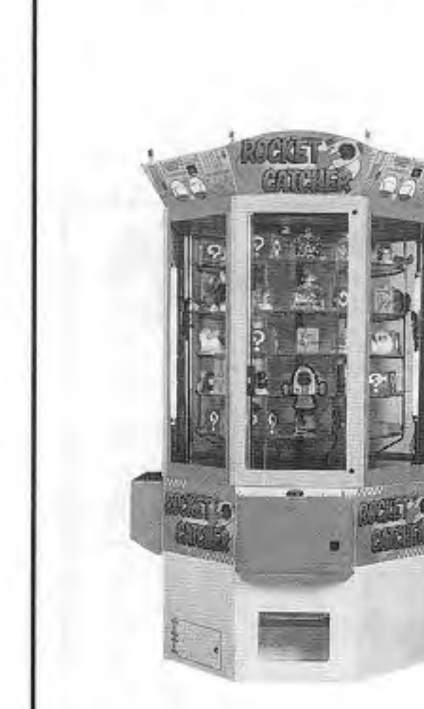
ロケットキャッチャー

このほか前作での、ギョブチャーステムが強化され、大ボスと地上物以外の敵はほとんど捕獲できるようになった。捕獲した敵は味方となり、攻撃防衛に使えるほか、対ボス戦では最強のアルファビームに変えたり、周囲を巻き込んで破壊するボムとして利用することも可能となる。なおボスは海洋生物型の戦艦で巨大。ゲームは持ち機数制。基板販売のみでOPP価格二十万八千円。