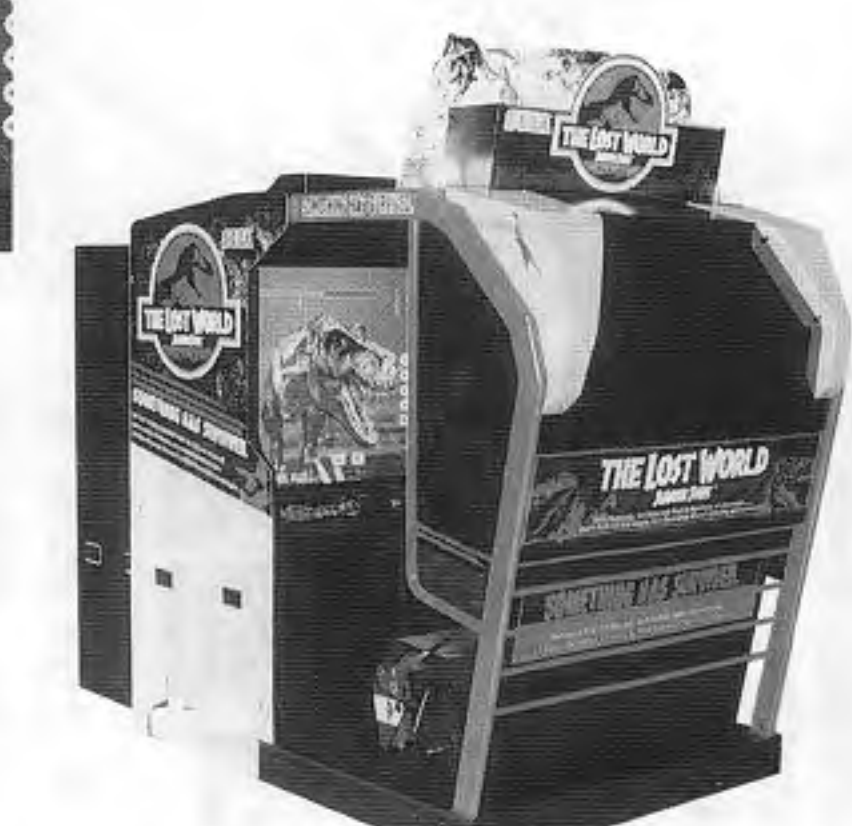
ロストワールド・ジュラシックパーク

CGガンゲーム機「ロストワールド」が七月下旬発売となる。またプライズゲーム機「スイートラップ」が、四月下旬からリリースされている。「ロストワールド」は