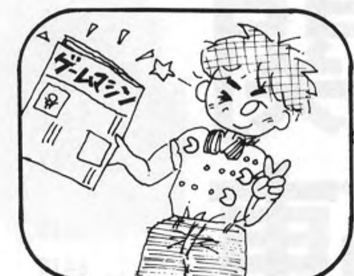
④お手元に新聞が番号郵送されます