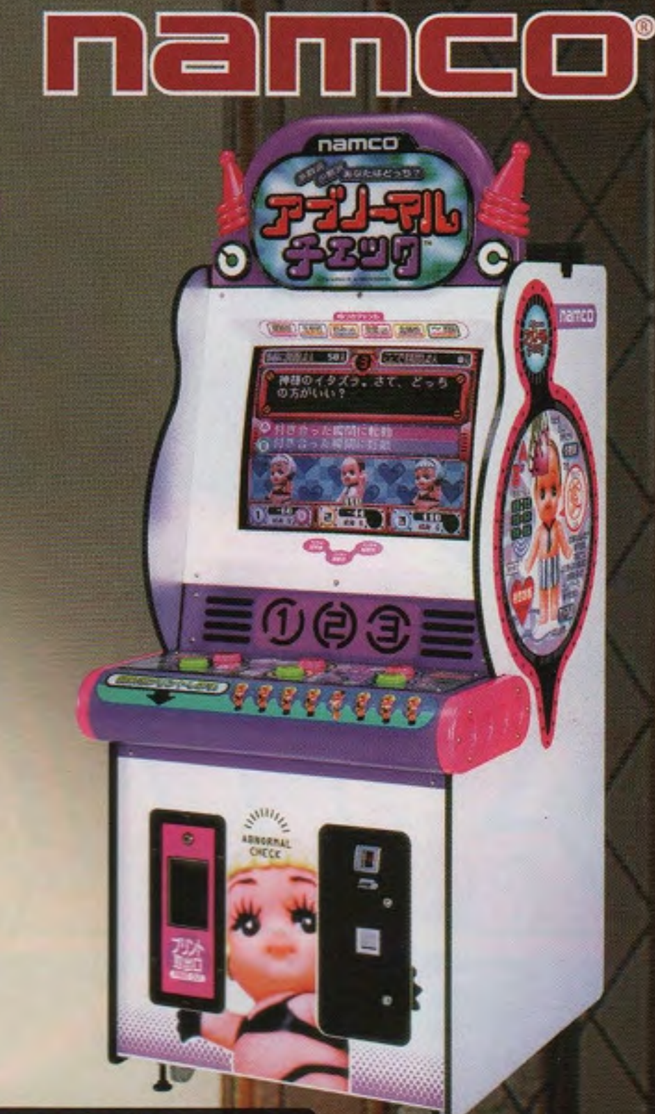
アブノーマルチェック