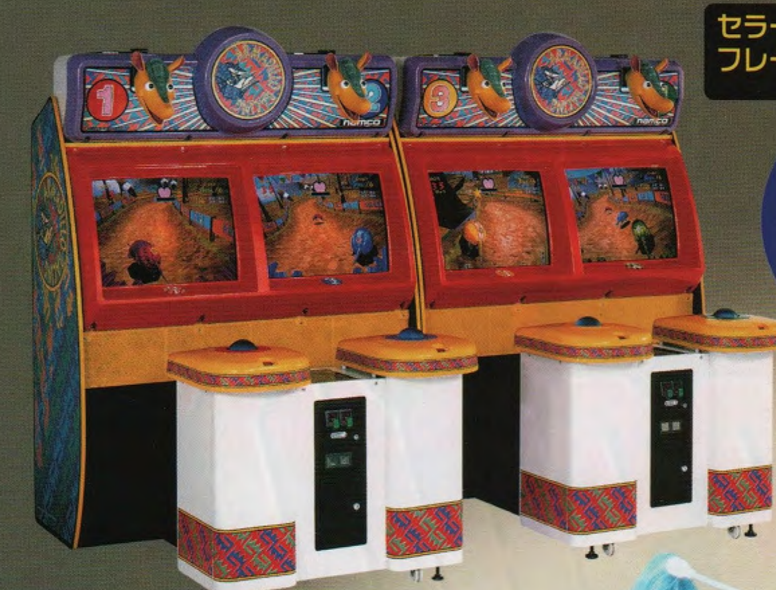
アルマジロレーシング

セラージュ “イプーバージョン” フレーム改造キット