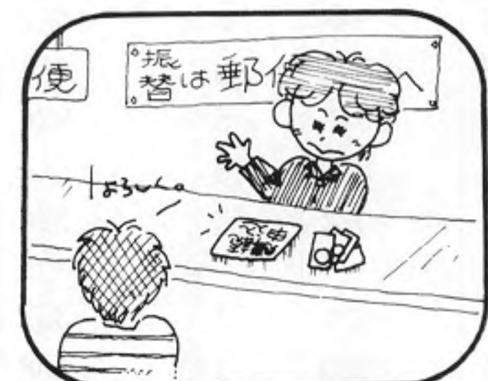
②購読料とともに郵便局で手続きを