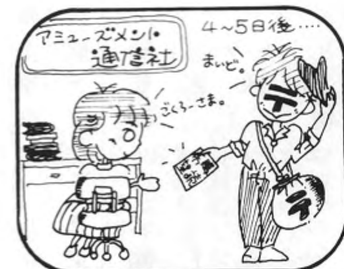
③約1週間、小社に通知が来ます