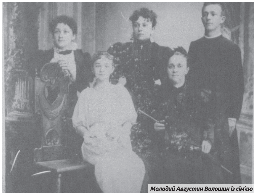
Молодий Августин Волошин із сім'єю

Після останнього допиту, який вів слідчий Вайндорф, здоров'я Августина Волошина різко погіршилося, і його перевели в Бутирську тюрму. Про перебування Волошина в Лефортові маємо свідчення В. Марчука з Житомирщини: «Сидів 8 місяців у Лефортівській тюрмі. Зразу після Дня Перемоги до мене в камеру-одиначку помістили Августина Волошина – Президента Карпатської України. Це був невисокий, повний чоловік років за 70. Він мав хворий шлунок і не міг їсти. Свою їжу віддавав мені. Потім до нас підсадили ще якогось Барковського, це був стукач, але ми цього не знали. Він заводив провокаційні розмови і потім доносив слідчому. Пам'ятаю такий випадок. Я не знав жодної молитви і Волошин учив мене «Отче наш». Коли наступного разу мене викликали на допит, слідчий сказав: «Ну, как, «Отче наш» выучил уже?» Тоді я не здогадався, звідки слідчий знає про молитву. Хто такий Барковський, дізнався в Бутирській тюрмі від одного викладача військової академії, до якого теж підсаджували Барковського.