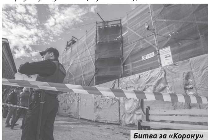
Битва за «Корону»