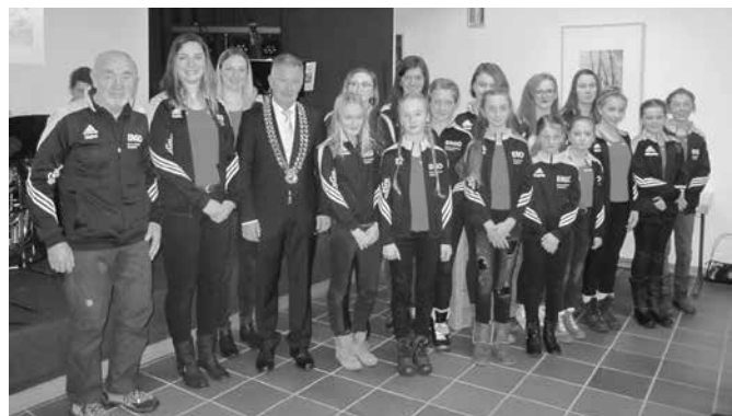
Gratulation an die Hoch- und Einradgruppe für ihre sportlichen Leistungen.

Nach dem Auftritt der Singflut Kids wurden Sportlerinnen und Sportler für Ihre besonderen Leistungen gewürdigt. „Sportler seien mit ihren Leistungen Vorbilder für andere Menschen. Dazu gehört, dass ihr eigene Grenzen überwindet, euch nicht durch Rückschläge entmutigen lasst und konsequent eure Ziele verfolgt. Das verdient Anerkennung und Respekt.“, so Bgm. Vogl. Gleiches gelte für die Art, wie ihr Sportler Werte vertretet. Bgm. Vogl dachte hier an Fairness, Respekt, Integration und Toleranz, sowie ein wohlwollendes Für- und Miteinander – also Werte, die wir letztlich auch mit dem Frieden verbinden. Er bedankte sich bei den Eltern, Trainern und Betreuern für ihr Engagement.