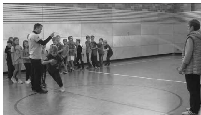
Bericht und Foto: Heinz-Theuerjahr Schule

Da es allen Beteiligten sehr viel Spaß bereitete, Seil zu springen, möchten wir uns für das nächste Schuljahr wieder für einen solchen Tag bewerben!