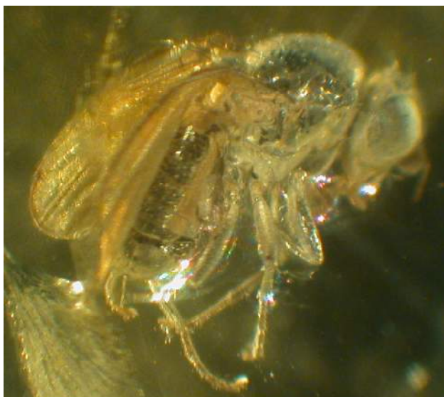
Ryc. Przedstawiciel błotniskowatych z plemienia Heleomyzini w burszynie bałtyckim.

Przed rokiem, na poprzednim Sympozjum Dipterologicznym, trafił do mnie bursztynek z muszką. Ze względu na małe rozmiary i odbiegające nieco cechy od typowych błotniszek, początkowo oznaczona została jako przedstawiciel jednego ze współczesnych rodzajów, często wyłączanych poza Heleomyzidae. Okaz (Ryc.), jak się później okazało, zakupiony został w 1999 roku na targach bursztynowych Amberif i od tamtej pory pozostawał nieoznaczony i „tułał się po świecie”. Przez 3 lata „przebywał” za granicą (w Izraelu), ale pozostał zagadką i ostatecznie został odesłany do właścicieli, do Niemiec, bez jakiegokolwiek adnotacji. Należy jednak wspomnieć, że okaz o niewielkich rozmiarach na szczęście jest dobrze zachowany, a błotniskowate (Heleomyzidae) są nielicznie reprezentowane w burszynie.