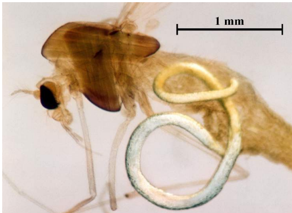
Ryc. Tanytarsus cf. mendax KIEFFER – interseks z opuszczającym jego odwłok nicieniem.

Opisane tu anomalie charakteryzuje tendencja do feminizacji, a także upraszczania budowy niektórych struktur. Do takich można zaliczyć pojawianie się prostych szczecin na tergicie analnym hypopygium w miejscu, gdzie u zdrowych samców występują charakterystyczne brodawki ( sensilla basiconica ) złożone z pęczków mikroskopijnych igiełek. Ich kształt i konfiguracja stanowią jedną z ważniejszych cech diagnostycznych u dorosłych samców Tanytarsini. Do ciekawszych objawów należy również pojawianie się w nietypowych miejscach sensilla chaetica , spełniających prawdopodobnie funkcje receptorów wrażliwych na dźwięki emitowane w czasie lotu godowego. Tym bardziej oczywiste stają się