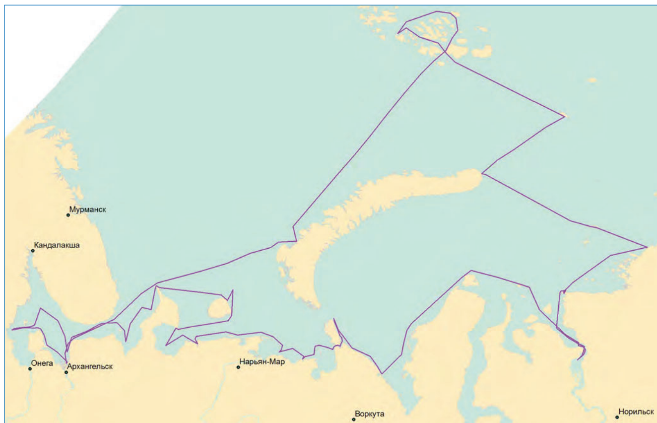
Схема первого рейса НЭС «Михаил Сомов», проходившего с 23 июня по 23 августа 2018 года

управления Северного морского пути. Выгружено два контейнера, на самоходной барже доставлено 90 т топлива. Проведено техническое обслуживание средств связи и АМК. Выполнена нивелировка и увязка реперов.