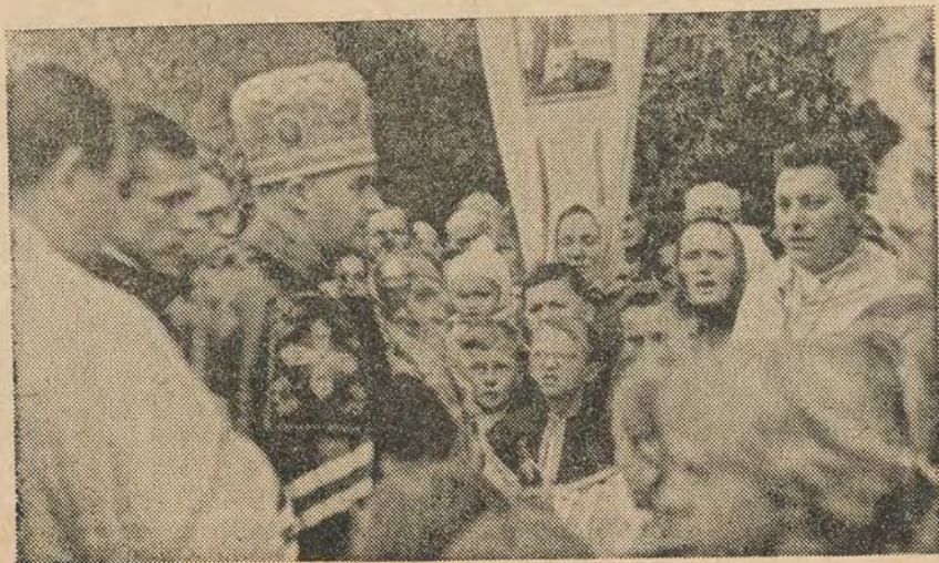
Preosv. vладыka Cyril na cirkevnej slávnosti v KAŠOVE.