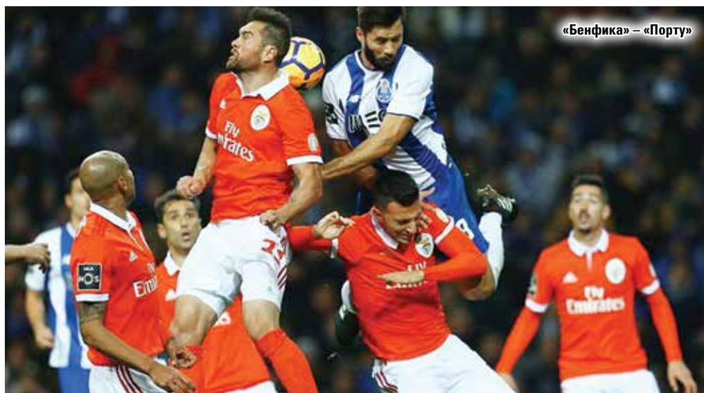
«Бенфика» – «Порту»

Так случилось в Португалии. 1 апреля, и это не шутка (!), «Порту» уступил лидерство, проиграв в Лиссабоне «Белененсеншу». Тот матч стал тысячным в профессиональной карьере Икера Касильяса, включая, разумеется, не только 725 матчей за мадридский «Реал», но и 167 поедин-