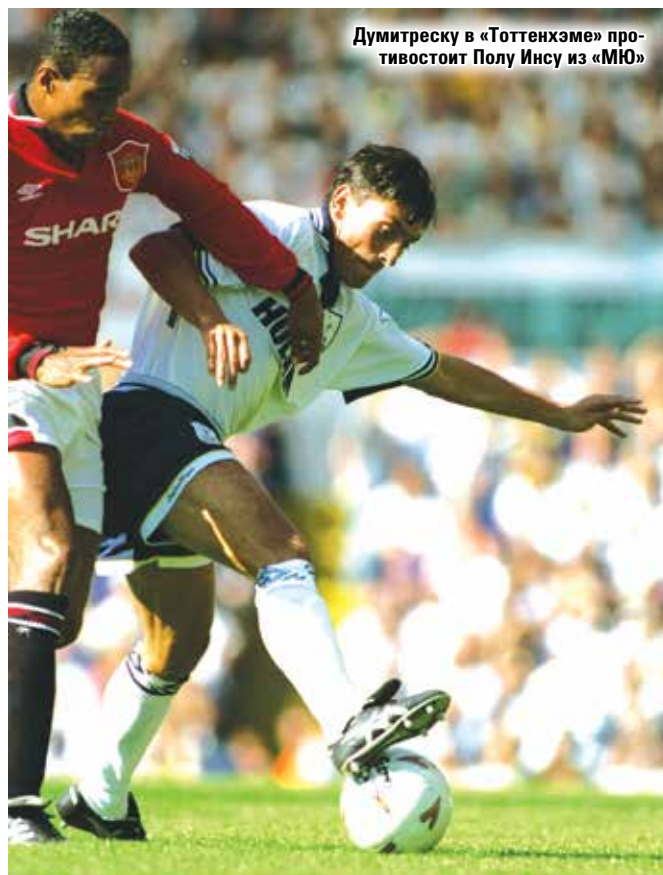
Думитреску в «Тоттенхэме» противостоит Полу Инсу из «МЮ»