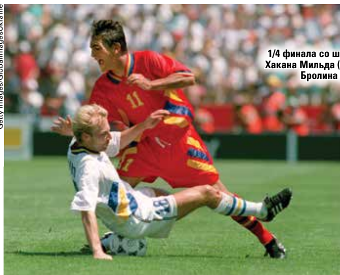
1/4 финала со шведами. Против Хакана Мильда (слева) и Томаса Бролина (справа)