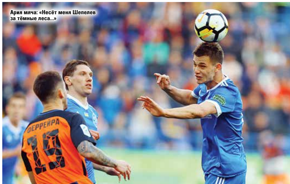
Ария мяча: «Несёт меня Шепелев за тёмные леса...»