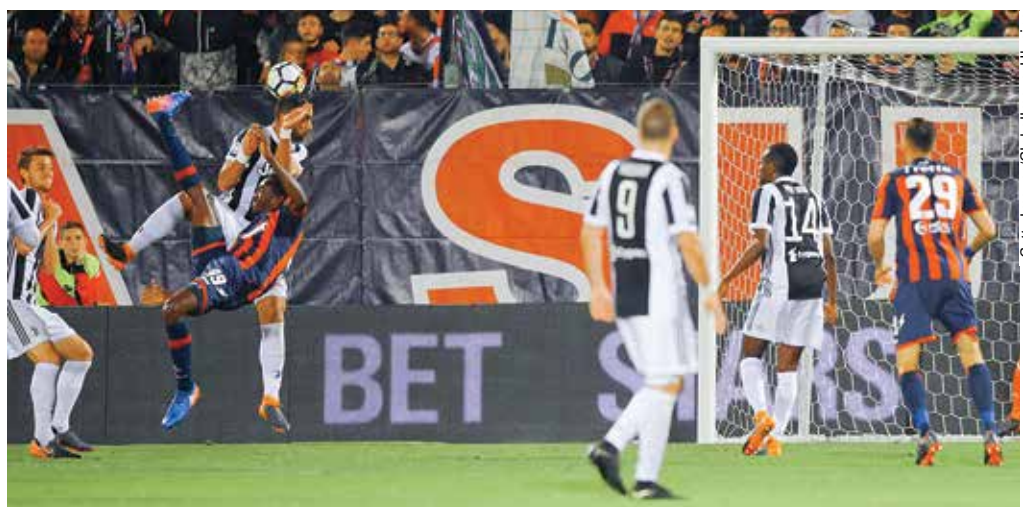
Нванкво Сими-Кротонский вваливает «Ювентусу» ответочку ударом через себя! Чудо!!! Мяч находился на высоте более 4-х метров! :-)