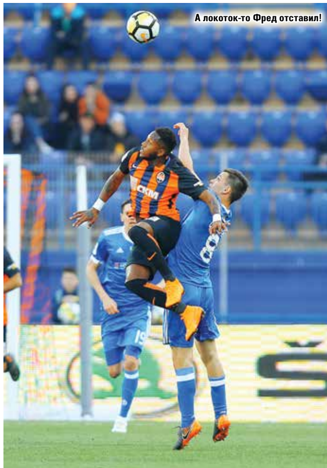
А локоток-то Фред отставил!

А обыграть «Верес» – задача посложнее будет, чем даже заслуженный успех в «Классычном»! Не считайте за троллинг, хотя автор к этому почти всегда склонен, новедь именно ровенско-львовский (или уже львов-