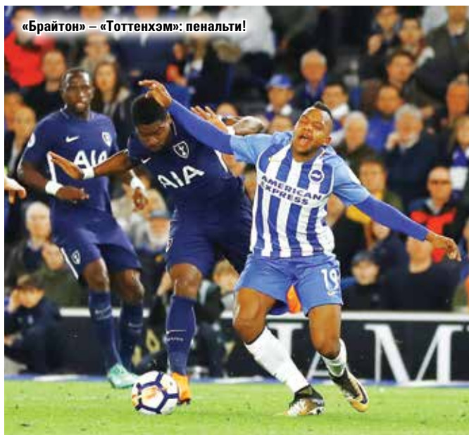
«Брайтон» – «Тоттенхэм»: пенальти!

По схожему сценарию развивался и матч «Брайтона» с «Тоттенхэмом». Первый тайм без голов и обмен забитыми мячами за короткий отрезок времени после перерыва, но тут – в начале второго тайма, а не в конце. «Брайтону» нужно набирать очки хоть понемногу, чтобы курочкой по зернышку собирать тот необходимый запас, который позволит избежать невотрепки в концовке сезона. Мысли «Тоттенхэма» сейчас в Кубке Англии, но и подпускать к себе «Челси» «шпорам» не хотелось, а у Харри Кейна своя задача на финишный отрезок сезона – попытаться догнать в гонке бомбардиров Мохамеда Салаха.