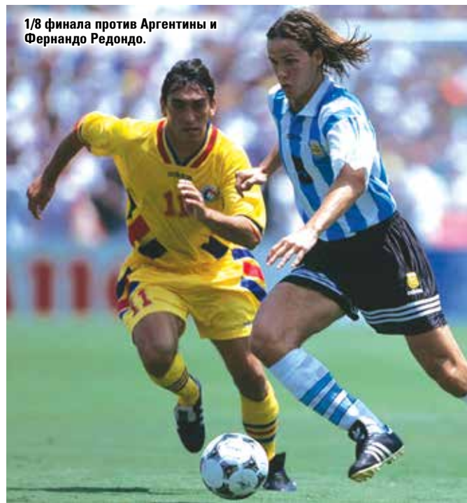
1/8 финала против Аргентины и Фернандо Редондо.

Помимо этого, у нас была очень дисциплинированная и организованная оборона во главе с Миодрагом Белодедичи, двукратным победителем Кубка чемпионов. В каждой линии были фантастические исполнители – Георге Попеску, Йоан Лупеску. Они отлично соединяли защиту и атаку.