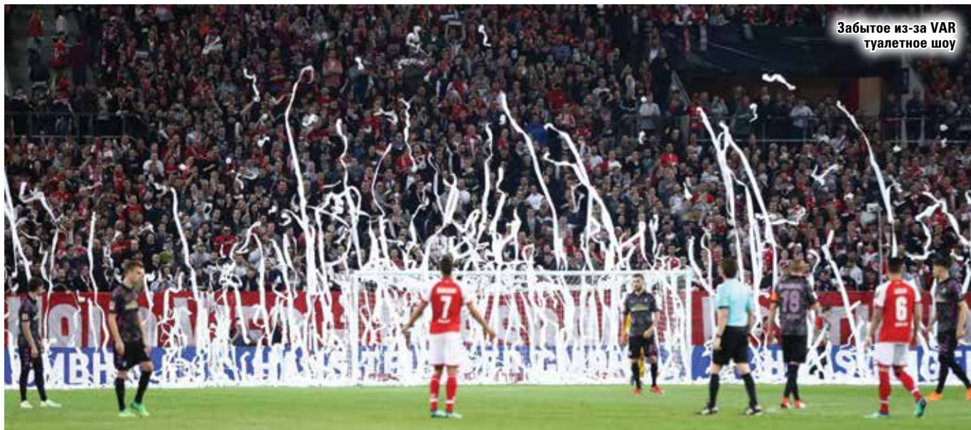
Забывтое из-за VAR туалетное шоу