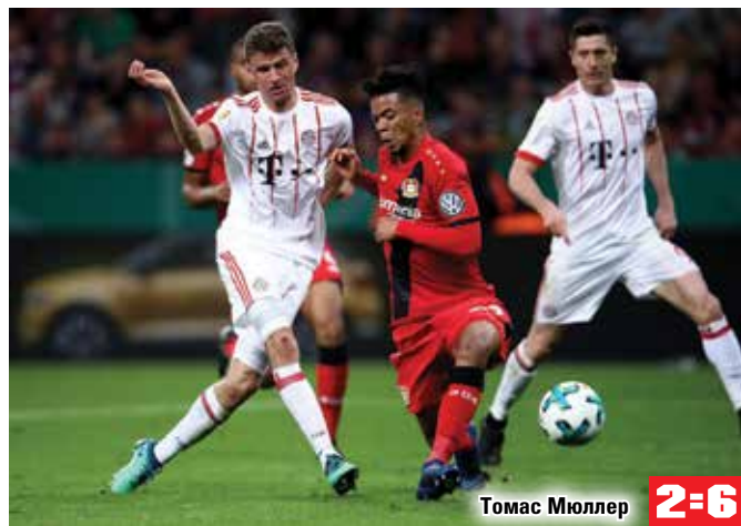
Томас Мюллер 2=6

На пути в Берлин мы выбили «Лейпциг», дортмунд-