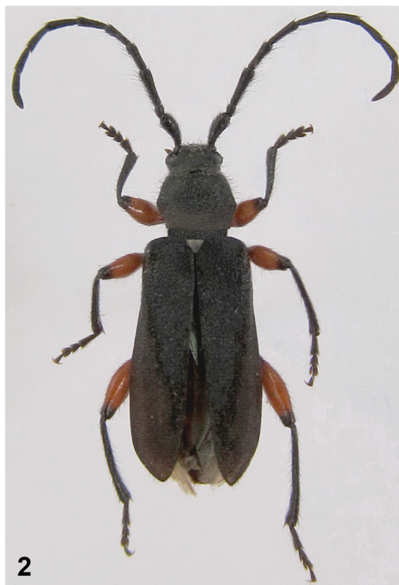
Рис. 1–2. Ropalopus femoratus (Linnaeus, 1758). 1 – местонахождение; 2 – общий вид. Figs 1–2. Ropalopus femoratus (Linnaeus, 1758). 1 – habitat; 2 – general view.

[Бартенев, 2009]. Не исключены также находки этого вида на территории Литвы и центральных областей европейской части России [Danilevsky, 2018b].