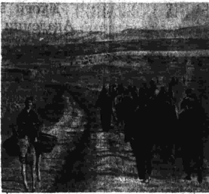
Бойцы испанской республиканской армии направляются на поля для помощи крестьянам в сельскохозяйственных работах. (Косоварто).

знанием дела, частую гражданскую одежду, расчитанную на длительный период. Наряду со складами оружия сохранились полные казенные, госпитали и даже... торжия. «Пари суар» сообщает подробности раскрытия фашистского заговора на улице Рибера, дом № 37. «Там находится, — пишет газета, — особняк, построенный в готическом стиле. В нем помещался семейный пансион, проживало около 25 старых дам, большинство из них офицерских вдов. В первый же вечер полицейские власти наткнулись в этом особняке на очень интересное находки. Почти повсюду там были спрятаны патроны и патроны в таком количестве, что понадобилось три грузовика, чтобы вывезти эти запасы. Одна неожиданность следовала за другой. Полицейские инспекторы стали заглядывать в потайные углы особняка и всюду находили оружие. Утверждают, что там было по меньшей мере 100 тысяч патронов, порядочное количество автоматических пистолетов, 500 пистолетов, пулеметы-зениты. Все это оружие, новое и хорошо смазанное, было тщательно упаковано и перемуровано. В шести ящиках находилось по 30 гранат. Но это еще не все. На полу под лампами не было конца, когда они вошли в подвальное помещение. Они поняли тогда, что весь этот особый простор на улицах, как это влечет в Швейцарию, где ставятся авантюристические фабрики».