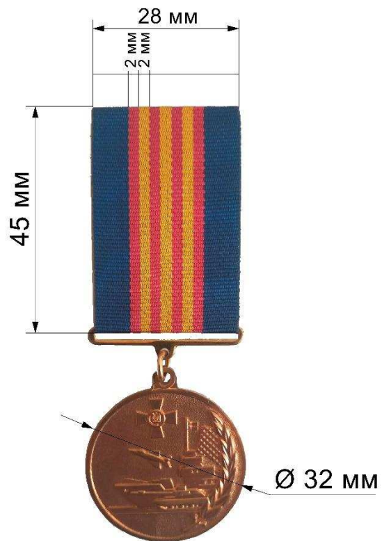
в – III ступінь (вид 3)