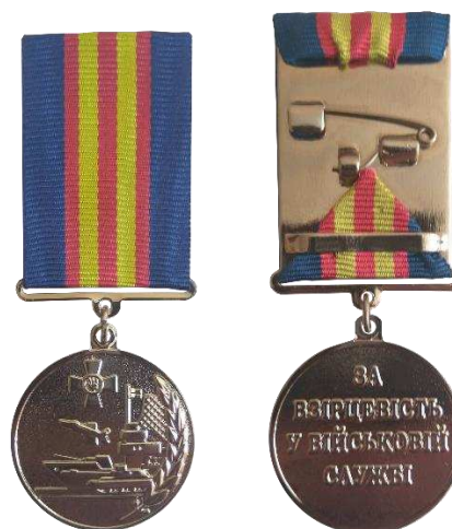
б – II ступінь