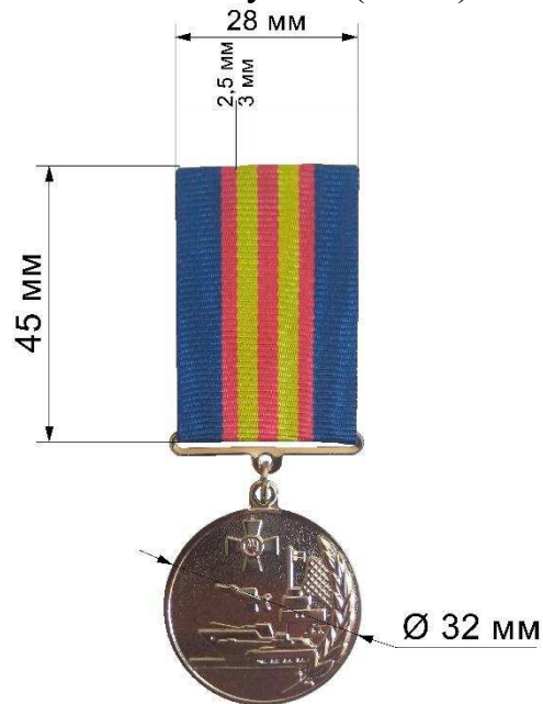
б – II ступінь (вид 2)