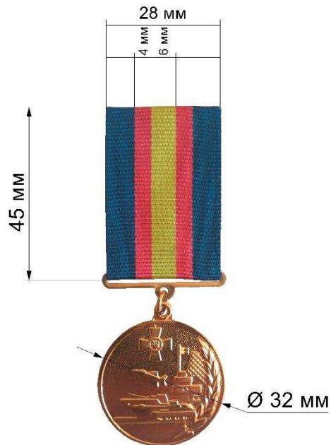
а – I ступінь (вид 1)

Основні виміри нагрудних знаків зображено на Рисунку 2. Допустима похибка – \pm 0,5 мм.