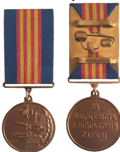
в – III ступінь