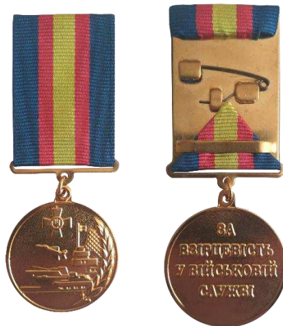
а – I ступінь