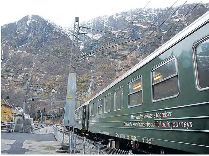
One of the world's most beautiful train journeys - lukee junan kyljessä. Flåmin rautatie on tunnettu upeista maisemistaan. Matka Myrdalista Flåmin kestää noin 50 minuuttia, ja matkan varrella juna pysähtyy kuvien ottoa varten.