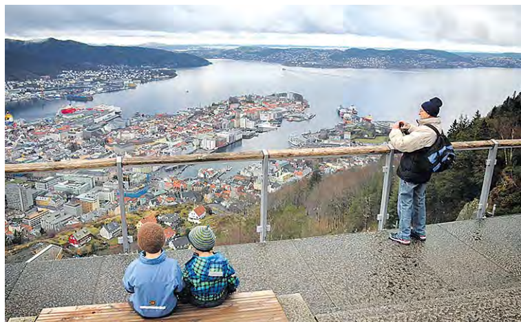
Fløyen-vuoren näköalatasanne takaa upeat näköalat Bergenin keskusta. Tasanteelle pääsee köysiratajunalla. Lähistöllä on myös useita vaellusreittejä.