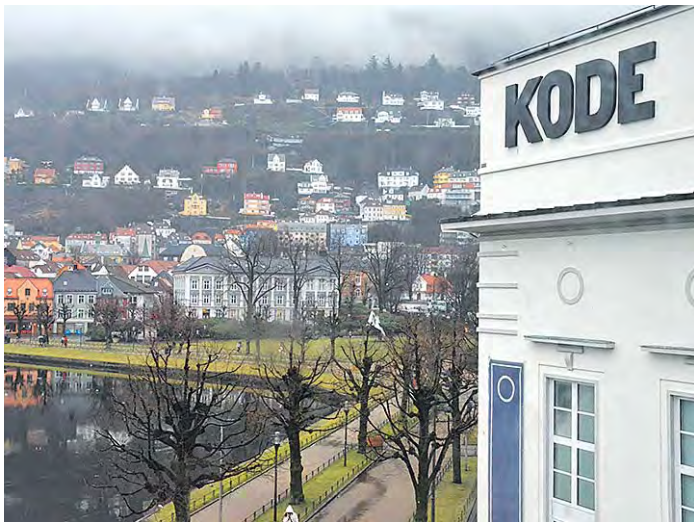
Kulttuurinnälkäisille taide-elämyksiä tarjoaa yksi Skandinavian suurimmista taidemuseoista, KODE. Siihen kuuluu Bergenin keskustassa sijaitsevat neljä eri rakennusta sekä kolmen säveltäjän kotimuseot. KODE 1-4 taidemuseot sijaitsevat lammen, Lille Lungegårdsvannetin vieressä. Museoissa on vaihtuvia näyttelyitä Edvart Munchista Picassoon. Yhdellä lipulla pääsee katsomaan kaikki näyttelyt.