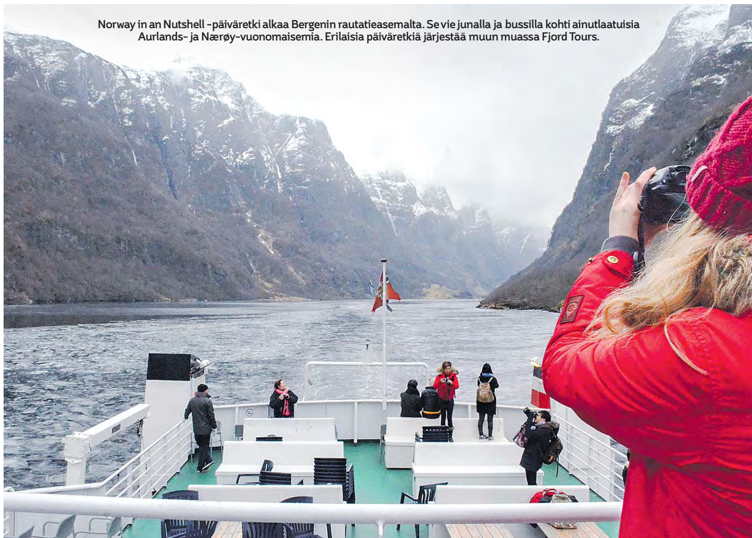
Norway in an Nutshell -päiväretki alkaa Bergenin rautatieasemalta. Se vie junalla ja bussilla kohti ainutlaatuisia Aurlands- ja Nærøy-vuonomaismia. Erilaisia päiväretkiä järjestää muun muassa Fjord Tours.