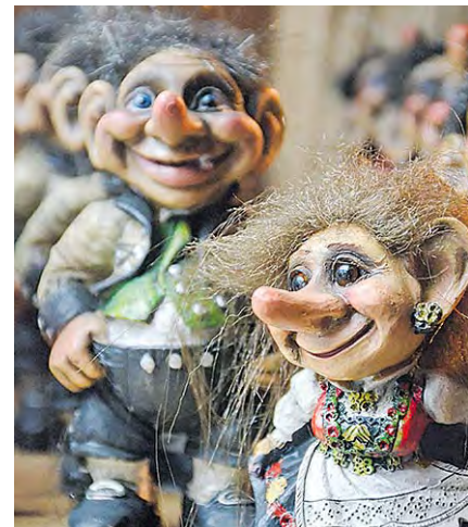
Pieniä peikkoja, trolleja, taapertaa matkamuistomyymälöiden hyllyillä.