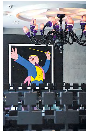
Oleanassa soivat viulut, ainakin kuvissa. Niitä löytyy käytäviltä ja hotellihuoneista.