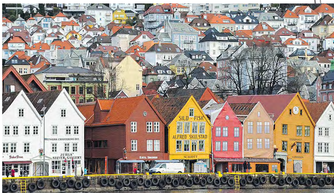
Värikkäät puutalot ovat Bergenin tavaramerkki. Vanha satama-alue Bryggen kuuluu myös Unescon maailmanperintökohteisiin.