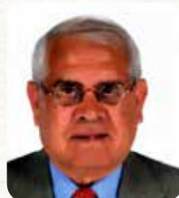
עמיר מס יו"ר הנהלת רשת המתנ"סים

בשמי ובשם צוות המתנ"ס אנו מאחלים לכם שנה עשירה בלמידה, בתרבות ובהתפתחות אישית. מודה לכם על הבעת האמון בלקיחת חלק בפעילויות השונות במהלך השנה החולפת, ומצפה לראותכם השנה.