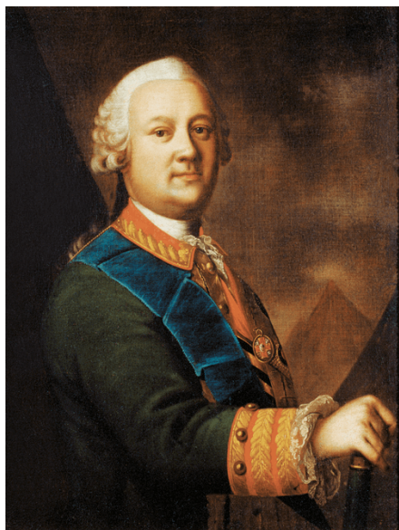
Генерал-аншеф П. И. Панин

между двумя придворными партиями, во главе одной из которых стояли фавориты Екатерины: сначала братья Орловы, а теперь князь Григорий Потемкин. Из участников подавления Пугачевщины здесь был начальник секретных комиссий генерал-майор П. С. Потемкин, троюродный брат Г. Потемкина, и большинство немцев: Рейнсдорп, Фрейман, фон-Брандт, Корф, Михельсон и другие, т. е. лица, не имевшие корней в родовитом дворянстве. Этой партии фаворитов и иностранцев противостояла партия, условно говоря, русских аристократов, которую возглавлял канцлер Никита Панин, вокруг которого сгруппировалась старая русская знать и просто неродовитые службисты. Их поддерживал цесаревич Павел Петрович, известный оппозиционностью к своей матери Екатерине II. Из генералов, участвовавших в подавлении Пугачевщины, здесь были брат канцлера генерал-аншеф Петр Панин, генерал-майор Петр Голицин, а также генерал-поручик Александр Суворов.