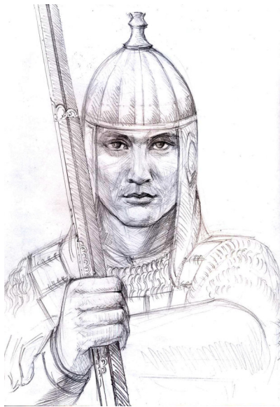
Салават-батыр.