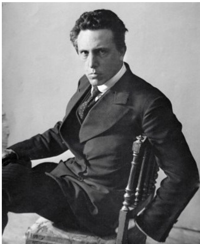
Режиссер Я. А. Протазанов

подвижника, которая и стала причиной появления данной житийной традиции. Каким же предстает Салават в народном воображении?