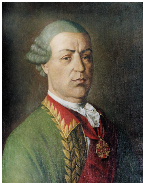
Генерал-губернатор И. А. Рейнсдорп

Однако Салават по причине, о которой будет сказано ниже, отверг предложение императрицы и продолжил сопротивление. Оренбургский губернатор И. А. Рейнсдорп 16 апреля 1775 г., т. е. уже после поимки Салавата, сообщал генерал-прокурору Сената А. А. Вяземскому: «И что касается до Салавата, то по имеющимся здесь делам довольно известно, что он не только во время бывшего народного мятежа, но и по получении из пределов Оренбургской губернии государственного злодея Пугачева, имея послушных себе башкирцов большую толпу, даже до поимки его (т. е. Салавата. – авт. ) воинскою командою злость свою с неудержанным злодейским стремлением продолжал, и притом многие убивства, грабежи имения, пожечи некоторых заводов и селений поделал...» 1