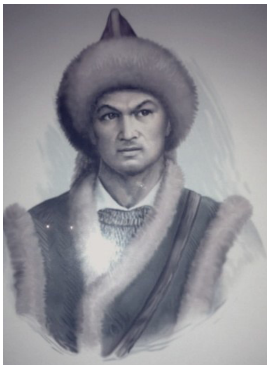
Салават Юлаев. Рис. Ф. Ф. Ислахова

22 марта 1774 г. недалеко от Оренбурга генерал-майор П. М. Голицын разбил «Главную армию» Пугачева. Самозванного царя от пленения спасло только то, что атаман Кинзя Арсланов 2 увел его вглубь Башкирии, и потухшее было восстание вспыхнуло с новой силой. Пушкин писал: «Башкирцы не унялись. Старый их мятежник Юлай, скрывшийся во время казней 1741 г., явился между ими с сыном своим Салаватом. Вся Башкирия восстала, и бедствие разгорелось с вящей силой...» 3