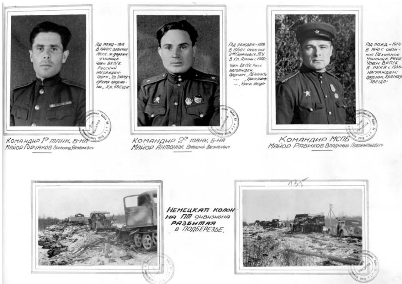
Из иллюстрированного альбома по истории 16-й танковой бригады ( www.gorchakov-story.ru ).

Произведя дозаправку и разведку маршрутов для продвижения танков, командир бригады принял решение: действуя в составе подвижного отряда корпуса совершить марш в преддверии встречного боя по маршруту: станция Подберезье – отметка 32,8 – отметка 38,8 – платформа Болотная – д. Вяжищи.