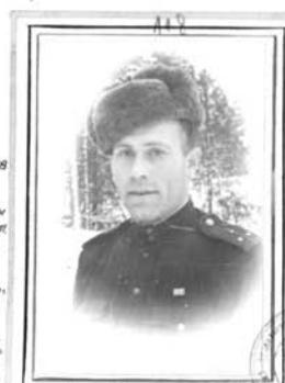
Зам. К-ра МСПБ Ст. л-т ШУР

Год рожде. - 1918 Член ВЛКСМ. В 1940 году окончил курсы мл. лейтенантов В Кр. Армии с 1938 г. Награжден: орденом „Красной Звезды“, орденом „Отечественной Войны“ I степени.