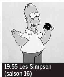
19.55 Les Simpson (saison 16)

► En clair jusqu'à 8.35 7.05 Le Daily Show. 7.30 Matin info. 8.35 Robin des Bois. Série (S1, 5 et 6/13) ☼. La Flèche d'argent. Un percepteur particulier. 10.00 Le Tigre et le Moine. Documentaire. 10.55 La Reine soleil ■ film Philippe Leclerc (Fr., 2006, DD) ♦.