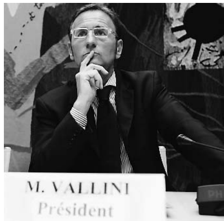
Le député André Vallini lors de la commission d'enquête sur l'affaire d'Outreau.

Le documentaire a, d'abord, une vertu pédagogique : motion de censu-