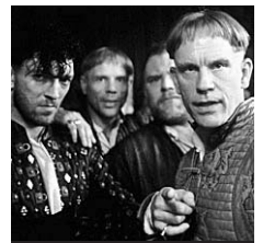
22.15 Jeanne d'Arc

6.00 M 6 Music ♦. 7.05 et 8.05 Drôle de réveil ! Divertissement. 9.05 M 6 boutique. Magazine. 10.05 Kidété. Magazine. Chadéblock ; Kid Paddle ; Les Schtroumpfs ♦. 11.55 La Petite Maison dans la prairie. Série (S2, 14/22). L'Orgueil du village ♦.