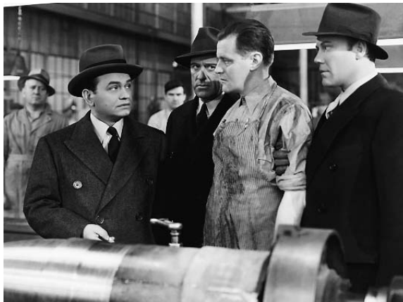
Edward G. Robinson (à gauche), en agent du FBI, dans une fiction qui confine au documentaire.

En 1937, par l'intermédiaire d'une vieille demoiselle écossaise, le docteur Kassel (Paul Lukas), chirurgien à New York, reçoit des instructions de l'Allemagne nazie pour haranguer les foules germano-américaines. Un raté, Kurt Schneider (Francis Lederer), se met au service du réseau d'agents de la Gestapo, y reste un piètre comparse. Il est sacrifié par les nazis lorsque l'agent du FBI Edward Renard (Edward G. Robinson) aura obtenu des aveux et des preuves pour impliquer les espions. Dix-