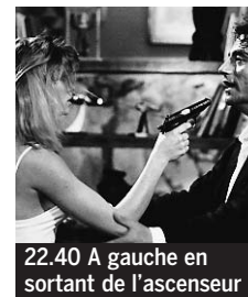
22.40 A gauche en sortant de l'ascenseur

6.00 M 6 Music. Magazine musical ♦. 7.00 Météo. 7.05 et 8.05 Drôle de réveil ! Divertissement. 9.05 M 6 boutique. Magazine. 10.05 Star6 music. 10.40 Kidété. Magazine. Chadéblock ; Kid Paddle ; Les Schtroumpfs ♦. 11.45 Météo/Météo des plages.