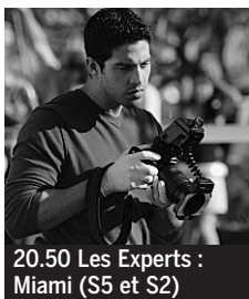
20.50 Les Experts : Miami (S5 et S2)

5.00 Très chasse, très pêche ♦. 5.25 Reportages. Le Bonheur des dames ♦. 6.00 Barbe-Rouge. Série ♦. 6.50 Shopping avenue matin. 7.35 Télévitrine. 8.05 Téléshopping samedi ♦. 8.55 TFou. Alien bazar ; Totally Spies ; Moby Dick... ♦.