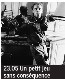
23.05 Un petit jeu sans conséquence

5.00 Dallas. Une grande classe Série (S5, 8/28) ♦. 5.50 Les Matinales. 6.00 EuroNews. 6.50 Toowam. La Terre vue d'Alban ; Inspecteur Gadget ♦. 8.40 Toowam vacances ♦. 10.25 et 20.25, 2.20 Plus belle la vie. Feuilletton ♦. 10.50 Village départ. En direct.