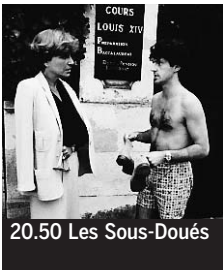
20.50 Les Sous-Doués

5.00 Très chasse, très pêche. La Bécasse ♦. 5.25 Reportages. La Longue Marche du docteur Laroche ♦. 5.55 Ciné-Trouille. Série ♦. 6.20 Wounchpouch. Série. Féminin-magicien ♦. 6.45 TFou. Tweenies ; etc. ♦. 8.30 Téléshopping. Magazine ♦.