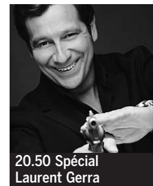
20.50 Spécial Laurent Gerra

6.00 M 6 Music. ♦. 6.40 M 6 Kid. Les Nouvelles Aventures de l'homme invisible ; Mirmo ; Atomic Betty ; etc. ♦. 8.50 M 6 boutique. 9.50 Déstockage de marques. 10.20 et 20.05 La Vraie Vie d'Eve Angeli... à Hollywood. [2 et 3/8]. Documentaire.