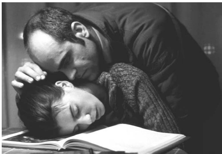
Luis Tosar (Antonio) et Laia Marull (Pilar). HAUT ET COURT

Confondant amour et jalousie, passion et comportement névrotique, il