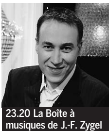
23.20 La Boîte à musiques de J.-F. Zygel

5.20 24 heures d'info, Météo. 5.45 et 9.40 KD2A ♦. 6.30 Télématin. 8.52 et 1.30 Dans quelle éta-gère. La Nuit dernière au XV e siècle, de Didier Van Cauwelaert. 8.55 Des jours et des vies ♦. 9.20 Amour, gloire et beauté ♦. 11.20 Météo.