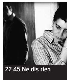
22.45 Ne dis rien

5.40 C dans l'air. Magazine. 6.45 Rivages. La Baie de Somme, rendre la terre à la mer. 7.15 Debout les zouzous. Bali ; Ozie Boo ; Bob le bricoleur ; Caillou ; etc. ♦. 11.10 Nature extrême. Le pouvoir des sens ♦. 12.05 Silence, ça pousse !