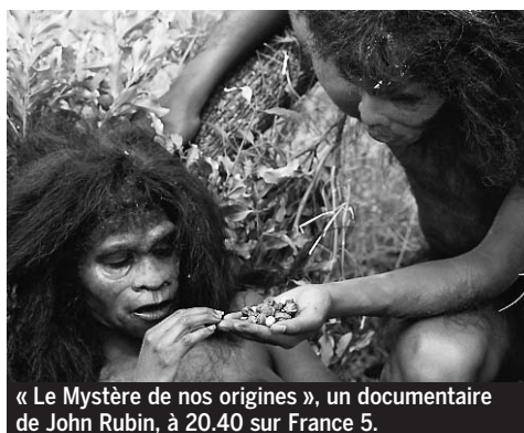
« Le Mystère de nos origines », un documentaire de John Rubin, à 20.40 sur France 5.