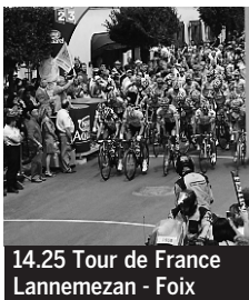
14.25 Tour de France Lannemezan - Foix

5.15 24 heures d'info, Météo. 5.45 et 9.45 KD2A ♦. 6.30 Télématin. 8.49 et 0.20, 5.40 Dans quelle éta-gère. Un homme accidentel, de Philippe Besson. 8.50 Des jours et des vies ♦. 9.20 Amour, gloire et beauté. Feuilleton ♦. 11.20 Météo.