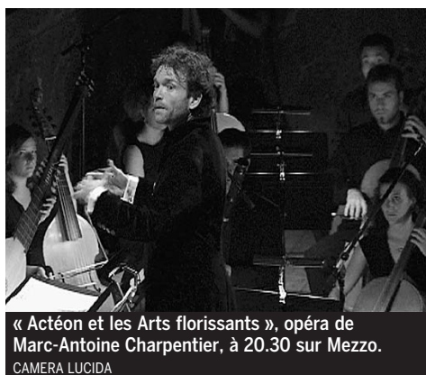
« Actéon et les Arts florissants », opéra de Marc-Antoine Charpentier, à 20.30 sur Mezzo.