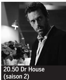
20.50 Dr House (saison 2)

5.00 Musique. Magazine ♦. 5.25 Reportages. La vie est belle ♦. 5.55 Ciné-Trouille. Série ♦. 6.20 Wouch-pouch. Série ♦. 6.45 TFou. Tweenies ; Les Petits Einstein ; Gazoon ; Zoé Kézako ; Les Petites Crapules ♦. 8.25 et 3.30 Météo. 8.30 Téléshopping.