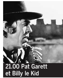
21.00 Pat Garrett et Billy le Kid

5.40 C dans l'air. 6.45 Rivages. [4/10]. Le Mont-Saint-Michel, une baie nourricière. 7.15 Debout les zouzous. Bali ; Ozie Boo ; Bob le bricoleur ; etc. ♦. 11.00 Avis de sorties. 11.10 Le singe qui a traversé la mer ♦. 12.00 Silence, ça pousse !