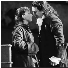
0.15 L'Heure de l'opéra : Manon, de Massenet

5.10 30 millions d'amis ♦. 5.45 Les Matinales. 6.00 EuroNews. 6.50 Toowam. La Terre vue d'Alban ; Inspecteur Gadget... ♦. 8.40 Toowam vacances ♦. 10.25 et 20.25. 2.05 Plus belle la vie ♦. 10.50 Village départ. 11.40 Le 12-13 de l'info.