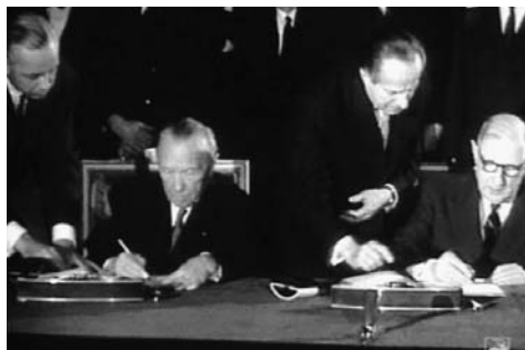
« L'Europe, de Rome à Maastricht », un documentaire de Patrick Rotman, à 22.38 sur Histoire. (Photo : Konrad Adenauer et le général de Gaulle.)