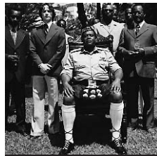
23.25 Le Dernier Roi d'Ecosse

► En clair jusqu'à 8.35 7.30 Matin info. 8.30 Les Films faits à la maison. 8.35 Le diable s'habille en Prada [film] David Frankel. Avec Meryl Streep (EU, 2006, DD). 10.20 Une grande année [film] Ridley Scott. Avec Russell Crowe (Etats-Unis, 2006).