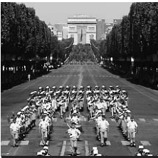
20.50 14 juillet : Champ libre

5.15 24 heures d'info, Météo. 5.45 KD2A. Magazine. Radio Free Roscoe ♦. 6.30 Télématin. Magazine. 8.45 Défilé du 14-Juillet 2008. En direct. Au programme : Finul, entre guerre et paix ; Aguerri pour combattre ; Manœuvres à l'arsenal ; etc. ♦.