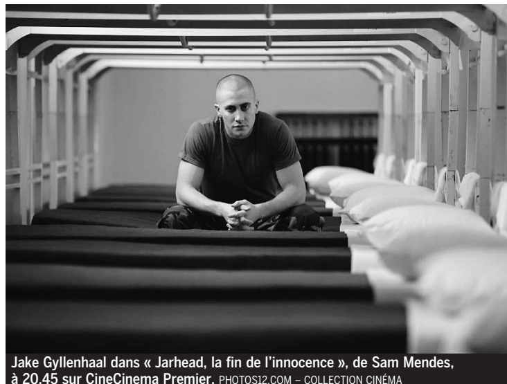
Jake Gyllenhaal dans « Jarhead, la fin de l'innocence », de Sam Mendes, à 20.45 sur CineCinema Premier.