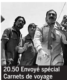
20.50 Envoyé spécial Carnets de voyage

5.15 24 heures d'info, Météo. 5.45 KD2A ♦. 6.30 Télématin. 8.49 et 0.45, 5.40 Dans quelle éta-gère. Sur ma mère, de Tahar Ben Jelloun. 8.55 Des jours et des vies ♦. 9.20 Amour, gloire et beauté ♦. 9.40 KD2A. Minuscule ; Kméra kchéé... ♦.