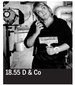
18.55 D & Co

6.00 M 6 Music ♦. 7.05 et 8.05 Drôle de réveil ! Divertissement. 9.05 M 6 boutique. 10.05 Star6 music. 10.40 Kidété. Magazine. Chadéblock ; Kid Paddle ; Les Schtroumpfs ♦. 11.55 La Petite Maison dans la prairie. Série (S2, 16/22). Le Wagon fou ♦.