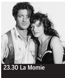
23.30 La Momie

5.20 Reportages. J'ai construit ma maison tout seul ♦. 5.55 Ciné-Trouille ♦. 6.20 Barbe-Rouge. Série ♦. 6.45 TFou. Tweenies ; Les Petits Einstein ; Gazoon ; Zoé Kézako ; Les Petites Crapules ♦. 8.25 et 3.40 Météo. 8.30 Téléshopping ♦.