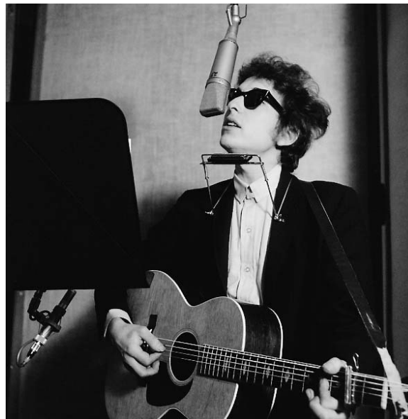
En moins de quatre ans, Bob Dylan aura réussi à incarner l'effervescence de la contre-culture américaine.

No Direction Home , le titre du film programmé en clôture de « Dylanmania », deuxième des huit soirées de la série « Summer of the 70s », appartient au baladin. Extrait de Like a Rolling Stone , succès planétaire, immarcescible. Scorsese a centré son investigation sur les années charismatiques du chanteur. De ce moment où Robert Allen Zimmerman (né à Duluth, dans le Minnesota, le 24 mai 1941) a nourri sa