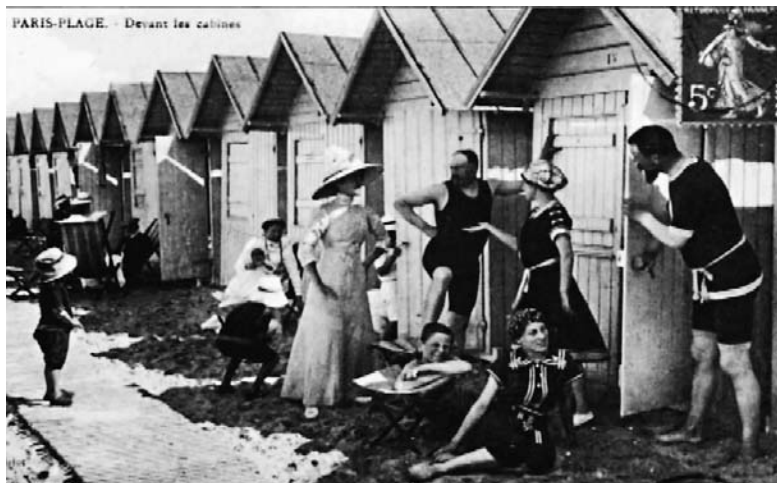
Carte postale de Paris-Plage dans le Pas-de-Calais, qui deviendra Le Touquet-Paris-Plage en 1912.

Le plaisant documentaire de Dominik Rimbault nous invite ainsi à faire une tournée de plages chronologique : après Dieppe, Trouville, Cabourg, Dinard, Biarritz, Nice et enfin Saint-Tropez. De la Restauration aux congés payés. Sans prétendre suivre une méthode historique rigoureuse, la réalisatrice ne nous montre pas moins la révolution industrielle vue de la mer. A partir du Second Empire, le développement des chemins de fer démocrati-