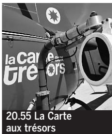
20.55 La Carte aux trésors

5.45 Les Matinales. 6.00 EuroNews. 6.50 Toowam. La Terre vue d'Alban ; Inspecteur Gadget ; Titeuf ; George de la jungle ♦. 10.15 Mercredi C sorties. Magazine ♦. 10.25 et 20.20, 1.35 Plus belle la vie. Feuilleton ♦. 10.50 Village départ. En direct.