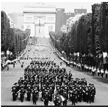
8.50 Défilé du 14-Juillet

5.25 Reportages. Magazine. Les Innocents du couloir de la mort ♦. 5.55 Ciné-Trouille. L'Homme au filet. Une mémoire d'éléphant ♦. 6.20 Wounch-pouch. Série. Tricher n'est pas sorcier ♦. 6.45 TFou. Tweenies ; Les Petits Einstein ; Zoé Kézako ; Moby Dick... ♦.