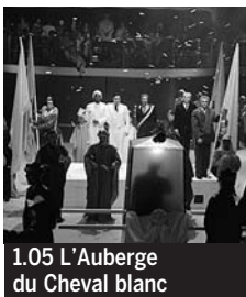
1.05 L'Auberge du Cheval blanc

5.35 Les Z'amours ♦. 6.10 KD2A. Radio Free Roscoe ♦. 7.00 KD2A. Galactik Football ; Blaise le Blasé ; Lizzie Mc Guire ; H 2 O ; Hannah Montana ; Derek ; Parents à tout prix ; Ce que j'aime chez toi ; Kaméra Kachée ; Change ta chambre ; Documentaire : Aller plus haut ♦.