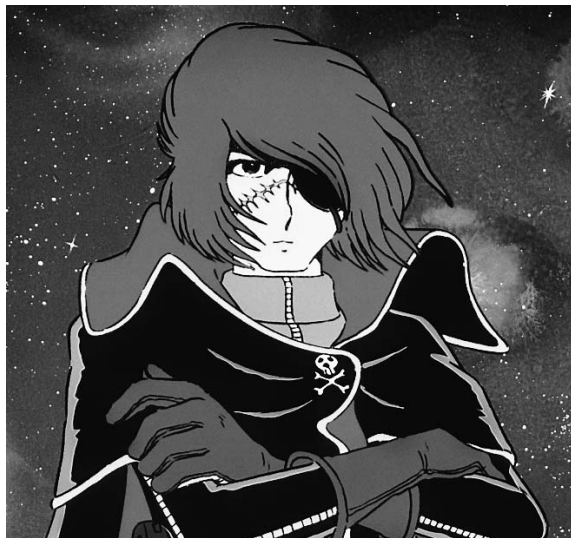
« Albator, Albator/Capitaine au cœur d'or/Tu règnes sur la galaxie... »

A l'origine de ce succès planétaire figurent les bandes dessinées en noir et blanc signées par Leiji Matsumoto, lequel a commencé sa carrière d'auteur dans les mangas à l'eau de rose pour jeunes filles. Outre le culte de l'amitié et sa passion pour