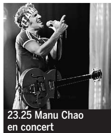
23.25 Manu Chao en concert

► En clair jusqu'à 8.35 7.05 Le Daily Show. 7.30 Matin info. 8.30 Les Films faits à la maison. 8.35 U.V. Gilles Paquet-Brenner. Avec Jacques Dutronc, Marthe Keller (Fr., 2007) ♦. 10.10 Anna M. Michel Spinosa. Avec Isabelle Carré (Fr., 2007) ♦.