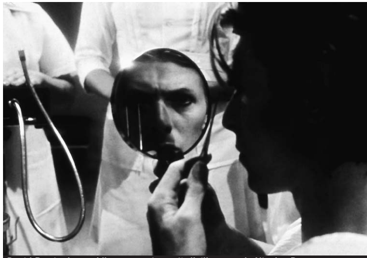
David Bowie dans « L'homme qui venait d'ailleurs », de Nicolas Roeg, à 22.30 sur CineCinema Star.