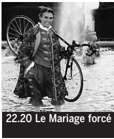
22.20 Le Mariage forcé

5.15 24 heures d'info, Météo. 5.45 et 9.45 KD2A ♦. 6.30 Télématin. 8.49 et 0.20, 5.40 Dans quelle éta-gère. Traces, de Philippe Delerm. 8.55 Des jours et des vies ♦. 9.20 Amour, gloire et beauté ♦. 11.20 Météo. 11.25 Les Z'amours.