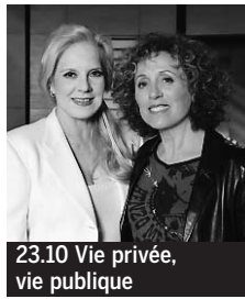
23.10 Vie privée, vie publique

5.40 Les Matinales. 6.00 EuroNews. 6.50 Toowam. La Terre vue d'Alban ; Inspecteur Gadget ♦. 8.40 Toowam vacances. Titeuf ; George de la jungle ♦. 10.25 et 20.20. 1.05 Plus belle la vie. Feuilleton ♦. 10.50 Village départ. Magazine, en direct.