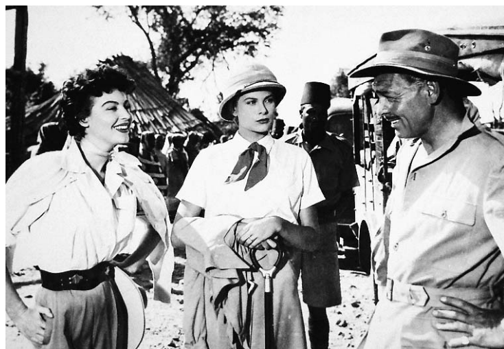
Ava Gardner, Grace Kelly et Clark Gable dans « Mogambo », de John Ford, à 20.45 sur TCM.