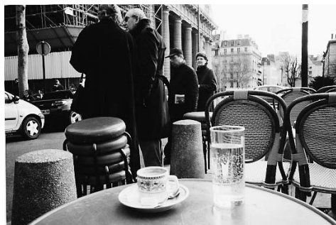
« Tentative d'épuisement d'un lieu parisien », un film documentaire de Jean-Christian Riff inspiré d'un roman de Georges Pérec, à 22.40 sur Planète.