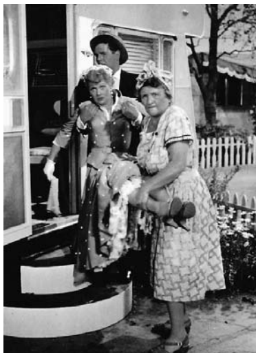
Tacy, son mari et sa voisine (Lucille Ball, Desi Arnaz et Marjorie Main).

Au premier arrêt dans un parc, une voisine (Marjorie Main) se méprend sur un geste tendre des jeunes mariés, croit Tacy malade et lui fait prendre un somnifère. Résultat : pas de nuit de nocces ! Par