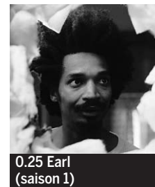
0.25 Earl (saison 1)

6.00 M 6 Music ♦. 7.05 et 7.05 Drôle de réveil ! Divertissement. 9.05 M 6 boutique. 10.05 Star6 music. 10.40 Kidété. Magazine. Chadéblock ; Kid Paddle ; Les Schtroumpfs ♦. 11.55 La Petite Maison dans la prairie. Série (S2, 20/22). Le Centenaire ♦.