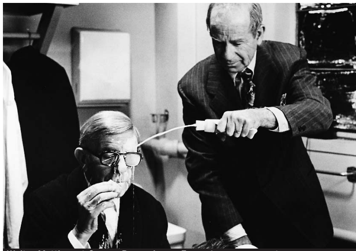
Walter Matthau et George Burns dans « Ennemis comme avant », de Herbert Ross, à 20.45 sur TCM.