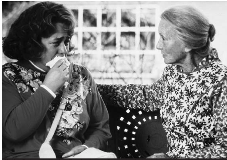
Kathy Bates et Jessica Tandy dans « Beignets de tomates vertes », de Jon Avnet, à 22.30 sur CineCinema Culte.