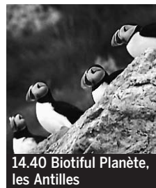
14.40 Biotiful Planète, les Antilles

5.40 C dans l'air. Magazine. 6.45 Rivages. [8/10]. Estuaire de la Seine. 7.15 Debout les zouzous. Magazine. Bali ; Ozie Boo ; Bob le bricoleur, mission nature ; Caillou ; etc. ♦. 11.05 Expression directe. CFTC. 11.10 La Danse des hippos. Documentaire ♦.