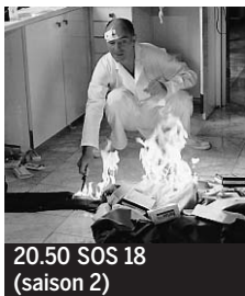
20.50 SOS 18 (saison 2)

5.45 Les Matinales. 6.00 EuroNews. 6.30 Toowam. Les Enfants du feu ; Inspecteur Gadget ♦. 8.35 Chouette Toowam. La Chouette ; La Panthère rose ; Le Marsupilami ; Le Club des 5 : mission secrète et sportive ♦. 11.05 Village départ. En direct.