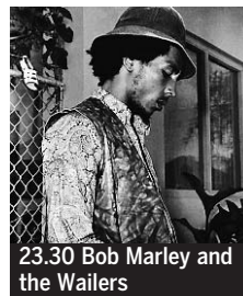
23.30 Bob Marley and the Wailers

5.40 C dans l'air. 6.45 Rivages. [7/10]. Guyane, une côte sous influence. 7.15 Debout les zouzous. Bali ; Ozie Boo ; Bob le bricoleur ; etc. ♦. 11.15 Genesis II, et l'homme créa la nature. [1/7] Au premier jour ♦. 12.10 Silence, ça pousse !