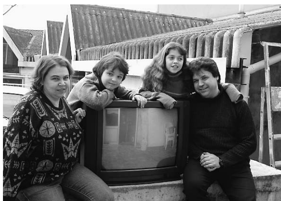
Après un mois sans télé, combien sont prêts à prolonger l'expérience ? JOËL F. VOLSON

Vingt ans après une première expérience à Créteil (Val-de-Marne),