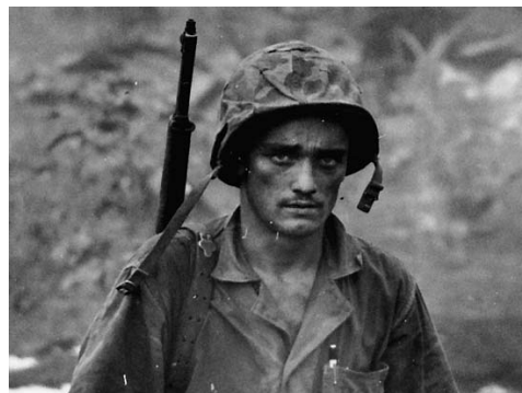
« The War », une série documentaire en quatorze épisodes de Ken Burns et Lynn Novick, à 22.00 sur Public Sénat.