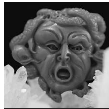
14.40 A la poursuite des pierres précieuses

5.55 Jules Verne, le mystérieux ♦. 6.45 Rivages. [2/10]. La Camargue, un avenir menacé ? 7.15 Debout les zouzous. Todd ; Sergent Moustache ; Les Belles Histoires du père Castor ♦. 11.10 Les Bisons de Yellowstone ♦. 12.05 Silence, ça pousse !