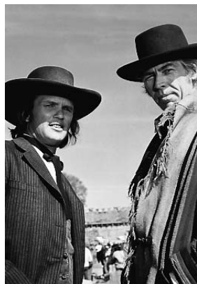
Billy le kid et Pat Garrett (Kris Kristofferson et James Coburn).

Un monstre sympathique fait pénétrer une petite fille dans son univers. Un film d'animation qui se distingue par son invention et son humour.