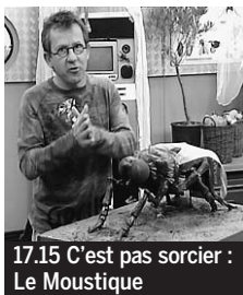
17.15 C'est pas sorcier : Le Moustique

5.25 Les Matinales. 6.00 EuroNews. 6.50 Toowam. La Terre vue d'Alban ; Inspecteur Gadget ♦. 8.40 Toowam vacances. Titeuf ; George de la jungle ♦. 10.25 et 20.20. 1.50 Plus belle la vie ♦. 10.50 Village départ. 11.40 Le 12-13 de l'info.