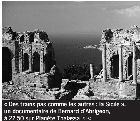
« Des trains pas comme les autres : la Sicile », un documentaire de Bernard d'Abrigeon, à 22.50 sur Planète Thalassa.