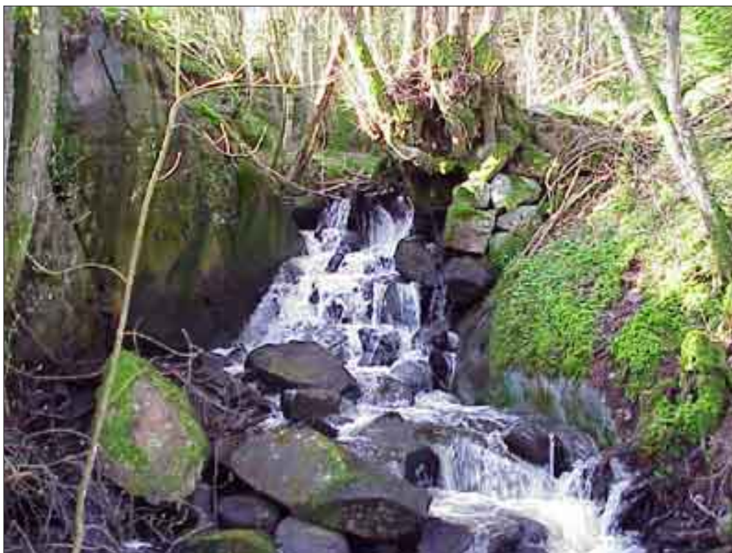
Kvarnlämning vid Romsbäcken i Munkedals kommun. Uppströms påträffades ytterligare kvarnlämningar och dämmen från slutet av 1880-talet.

Uppdraget från Länsstyrelsen gick ut på att besöka ett visst utvalt hinder i ett vattendrag. Om fler lämningar påträffades i fält besiktigades även dessa, som t. ex. vid ett biflöde till Färlev älv i Romsbäcken i Svarteborg socken, Munkedals kommun. Vid sökandet efter vandringshindret påträffades tre fördämningar och tre platser med kvarnruiner. Området ligger inom Stallhagens samfällighet och kvarnarna nyttjades under 1800-talets slut (Munkedals kommun: Kulturhistorisk undersökning 1986).