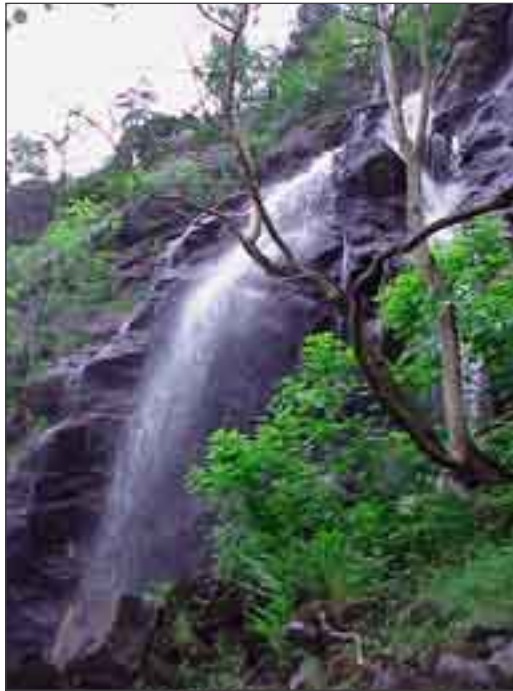
Definitivt naturligt vandringshinder i Vallerån, Kungälv kommun.

Vandringshinder som utgör definitivt stopp för laxens och havsöringens vandring uppströms i vattendraget. Dessa hinder består i regel av berghällar och vattenfall. Exempel: Fallet i Vallerån, Kungälv kommun.