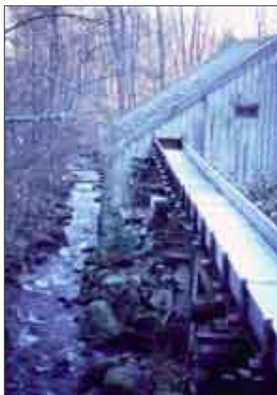
Aröds kvarn i Ljungskile, Uddevalla kommun. Vatten leds in i kvarn- och såghuset från fördämningen genom en vattenränna av trä. Anläggningen, som ägs av Ljungskile hembygdsförening, har anor från 1600-talet.

Kvarnar och fördämningsvallar var den vanligaste formen av vandringshinder. Flera kvarnar var fortfarande välbevarade, bl.a. Aröds kvarn i Ljungskile, Uddevalla kommun. Den sköts av Ljungskile hembygdsförening och fungerar som museikvarn. Tidigaste belägget för denna kvarn är 1659, men kvarnning innan dess är trolig. Kvarnverksamheten har förmodligen varit kontinuerlig ända fram till dess nedläggande (Dejke 1982).