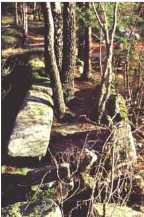
Fördämningsvall av kallmurad sten med jordfyllning. Fördämningen dämmer upp Kroksjön i Lindome, Möln-dals kommun. Nedströms hindret ligger flera kvarnruiner.

Resultatet visar, att det finns omfattande lämningar efter vattenkraftsanvändning i länet. Här finns allt från husbehovskvarnar med anor från 1800-talet eller äldre, till fördämningar från länets äldre industriverksamheter. Flera kvarn- och sågbyggnader står kvar idag och underhålls kontinuerligt. På andra platser är byggnaderna i så dåligt skick, att de rasat eller riskerar att rasa samman. Detta har på vissa håll resulterat i att bäckfåran dämms upp av byggmaterial, järnskrot och annat skräp, något som borde åtgärdas av miljöskäl. Undersökningen fastställer, att det finns ett gott underlag för vidare kulturhistoriska undersökningar och forskning kring äldre tiders användande av vattendrag och vattenkraft. Många platser med kvarn- och såglämningar bär spår av att ha använts under lång tid, rester av flera användningsfaser har kunnat konstateras. Ofta har dämnet moderniserats, medan vattendelare och kvarnhusgrunder lämnats orörda. I dessa fall är varsamma ingrepp i vandringshindren möjliga, dock under antikvarisk kontroll. Ett exempel är Tegneby kvarn i Tanums kommun.