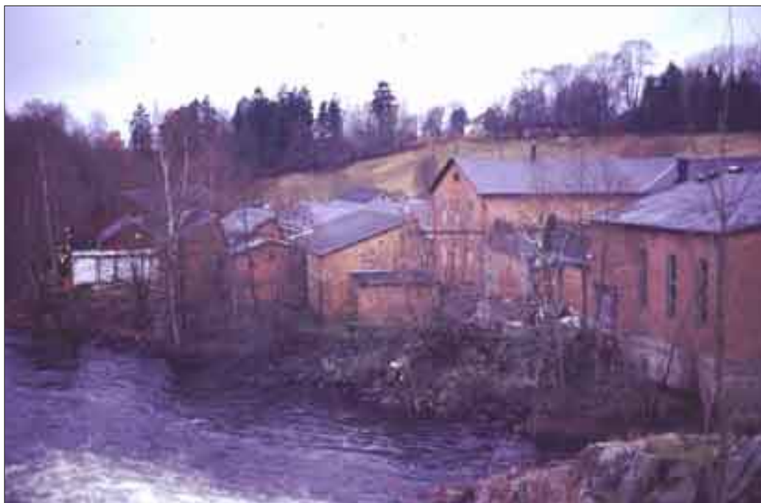
Gamla industribyggnader nedanför fallet vid Hedefors industri i Lerums kommun.

Vid fältundersökningen påträffades en rad sentida anläggningar av olika slag. Fördämningsvallar har haft olika användningsområden, att skapa en damm och ett vattentryck för att driva en industri, som i Sköldsån, Ale, som dämades upp vid byggandet av Alafors industrier 1854-55 ( Starrkärr-Kilanda socknar 1975). Dämnet är idag moderniserat och fungerar som vägbro. Hedefors industrier i Lerum är en annan industri med fördämning. Området fungerar idag som bostads- och kontorsområde, och är ett av Lerums kommuns kulturmiljöområden ( Lerums kulturmiljöprogram 1999 , nr 13.) Hedefors var för övrigt från början en kvarn, anlagd 1669-1670 ( Säveån - från Hedefors till Floda 1996:5-6).