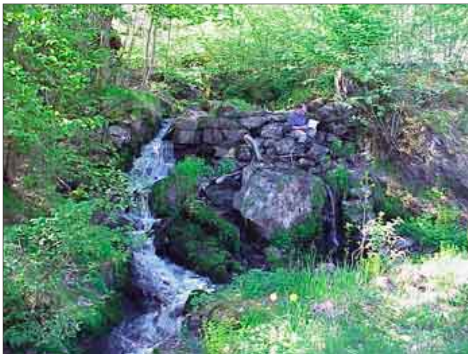
Vissa vandringshinder är svåra att avgöra om det är ett artificiellt eller naturligt hinder, som Välabäcken i Kungälv kommun.

Kartläggningen av partiella vandringshinder är inte heltäckande. En av anledningarna till detta är att inventeringsunderlaget vad gäller partiella vandringshinder är bristfälligt. En del vandringshinder av denna typ kan uppstå snabbt t.ex. genom bäverdämnar, och lika snabbt försvinna igen t.ex. i samband med högvatten.