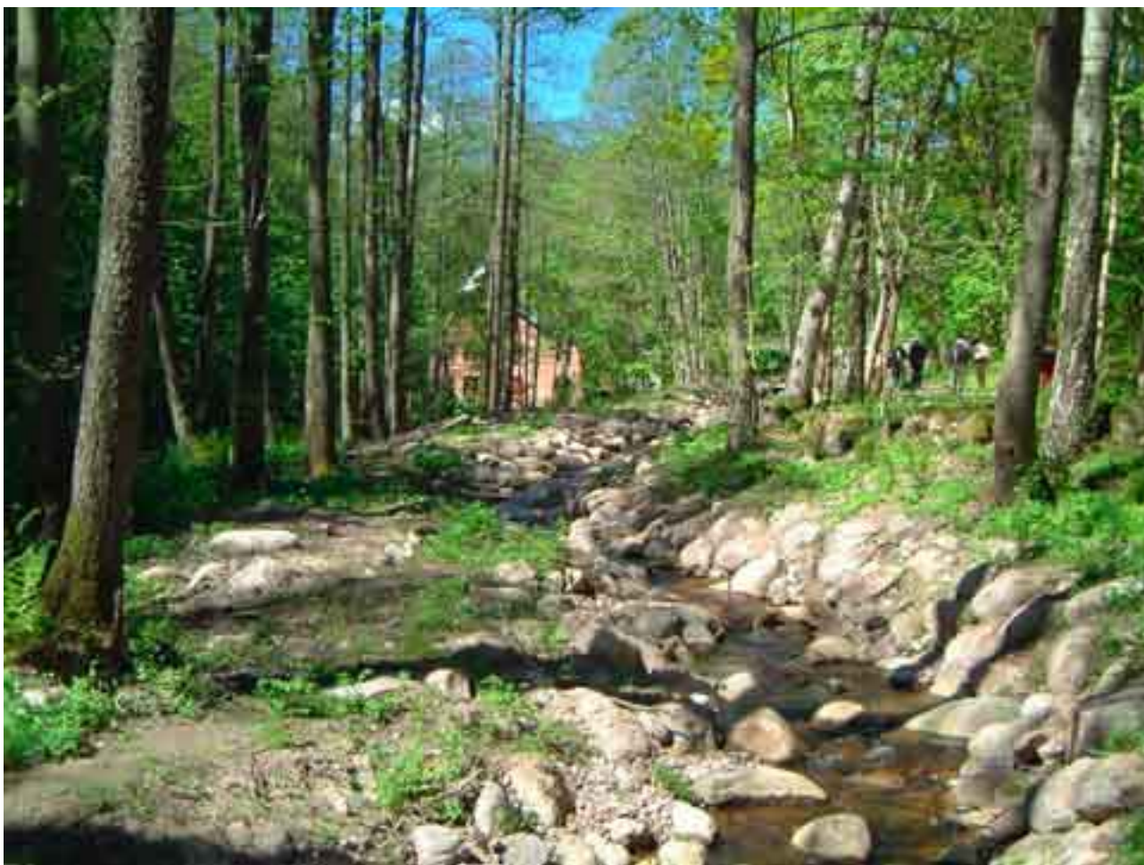
Vandringsväg genom ett s.k. omlöp vid Grebbans kvarn, Hjoån i Hjo kommun.

Det finns exempel från andra delar av länet där vandringshindret passeras genom ett s.k. omlöp och där åtgärden utförts i samarbete mellan företrädare för natur-, fiske- och kulturmiljövården. I Hjo kommun har man t.ex. anlagt omlöp vid vandringshinder i Hjoån och i Hjällöbacken. Vid Grebbans kvarn i Hjoån stötte anläggandet på särskilda problem då hänsyn fick tas till en kvarnbyggnad som renoverats med hjälp av statliga bidrag