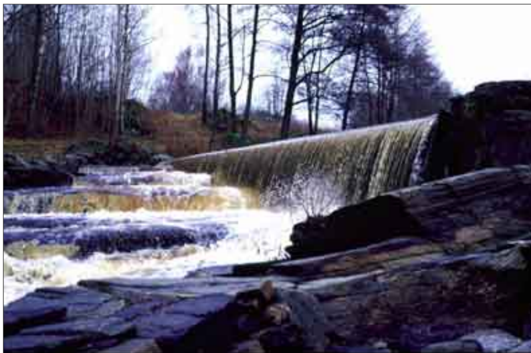
Fördämning vid Melltorp och Högens kvarn i Hyssna, Marks kommun. Här har en fisktrappa byggts om harmonierar med den omgivande kulturmiljön.

av till exempel fiskvägar eller utrivning av definitiva artificiella vandringshinder för att skapa fria vandringsvägar och låta vandringsfisk återbesätta sina naturliga lek- och uppväxtområden. Skapandet av fria vandringsvägar är en mycket högt prioriterad fiskevårdsåtgärd. Problem kan tänkas uppstå vid vandringshinder som är av kulturhistoriskt värde som exempelvis gamla kvarnanläggningar. Det finns dock flera exempel på lyckat samarbete mellan kultur- och fiskintressen vid återställande av fria vandringsvägar vid vandringshinder.