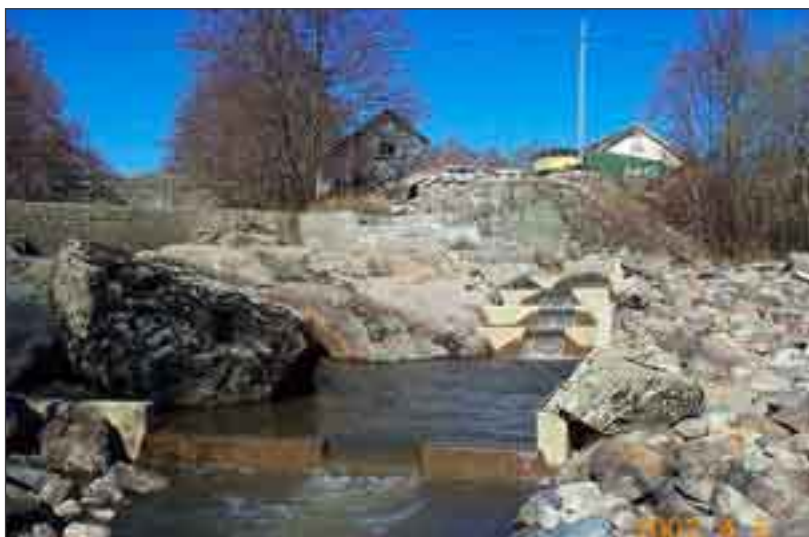
Vid Tegneby kvarn har man konstruerat en fisktrappa för att den ska passa in i kvarnmiljön. Trappan har byggts av stenblock istället för i betong och passats in så att den inte ska påverka kvarnbyggnaderna och dammanläggningen. Anråsälven, Tanums kommun.

Resultatet visar, att det finns omfattande lämningar efter vattenkraftsanvändning i länet. Här finns allt från husbehovskvarnar med anor från 1800-talet eller äldre, till fördämningar från länets äldre industriverksamheter. Flera kvarn- och sågbyggnader står kvar idag och underhålls kontinuerligt. På andra platser är byggnaderna i så dåligt skick, att de rasat eller riskerar att rasa samman. Detta har på vissa håll resulterat i att bäckfåran dämms upp av byggmaterial, järnskrot och annat skräp, något som borde åtgärdas av miljöskäl. Undersökningen fastställer, att det finns ett gott underlag för vidare kulturhistoriska undersökningar och forskning kring äldre tiders användande av vattendrag och vattenkraft. Många platser med kvarn- och såglämningar bär spår av att ha använts under lång tid, rester av flera användningsfaser har kunnat konstateras. Ofta har dämnet moderniserats, medan vattendelare och kvarnhusgrunder lämnats orörda. I dessa fall är varsamma ingrepp i vandringshindren möjliga, dock under antikvarisk kontroll. Ett exempel är Tegneby kvarn i Tanums kommun.