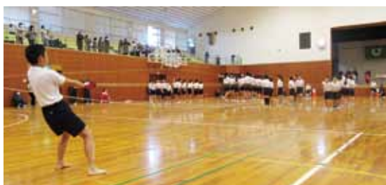
みんなで力を合わせた団体とび

期日 ＝2月11日(月・祝) ※荒天の場合中止(当日午前6時に開催判断) 受付 ＝午前8時30分から9時(団体とびは11時30分まで) 会場 ＝新日鐵住金君津体育館 参加資格 ＝1年以内に医師の診断、定期健康診断を受けて異常がないと認められた方 種目・対象 ◆ 個人種目 ＝①親子とび・就学前児童とその親②時間とび・就学前児童から小学2年生まで③二重とび・小学3年生以上 ◆ 団体種目 ＝④8の字とび・1チーム6人以上(小学生)⑤長なわとび・1チーム12人以上(小学生)⑥長なわとび・1チーム12人以上(中学生)⑦長なわとび・1チーム12人以上(⑤、⑥以外の構成) 持ち物 ＝運動着・体育館シューズ・とび縄(縄の中央部に金具の付かない物)・昼食・靴袋