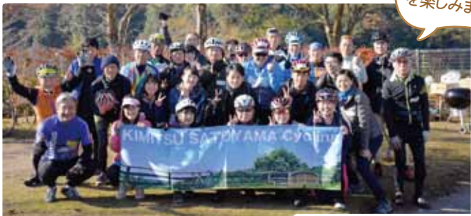
全長約25キロのコースでサイクリングを楽しみました

12月1日、きみつ里山サイクリングツアーを開催しました。快晴で風もなく、絶好のサイクリング日和に市内外からたくさんの方が集まりました。