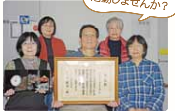
私たちと一緒に活動しませんか？

音訊の会さざなみからのお知らせ 一緒に活動する会員と声の広報の利用者を募集しています。 ☎ ボランティアセンター ☎(57)0294