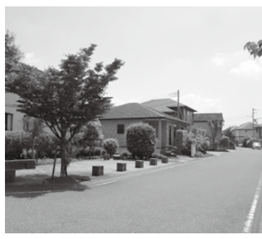
皆さんで美しい街並みをつくしましょう

景観計画・景観条例は、市街地、自然、歴史文化など、きみつの多様な景観資源を守るための考え方や基準を定めています。 今年7月1日から、高さ10mまたは建築面積500㎡を超える建築物などは、新築や外観の色を塗り替える場合は事前に市の届出が必要になります。 美しい景観を守り、育てるために、景観計画・条例を参考にしながら、一人ひとりが主役となって景観まちづくりに取り組みていきたいと思います。 ※景観計画・条例は、市ホームページに掲載しています。