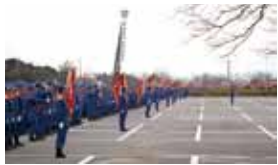
地域の安全安心を守ります

消防本部・消防署・消防団・民間防火団体などの消防機関が1年間の安全安心を願い、人員・装備や消防訓練の成果を広く市民の皆さんに披露します。ふれあいながら消防・防災への理解を深める良い機会です。ぜひご来場ください。 日時 ＝1月13日(日)午前9時30分 ※雨天の場合は、午前10時から君津市民文化ホール・大ホールで式典のみ行います。 会場 ＝君津市民文化ホール・駐車場 内容 ＝▼消防団による中隊訓練▼分列行進▼地震体験車による地震体験▼消防広場(きみびょんやミニ消防車との記念撮影、煙体験、豚汁の無料サービスなど) 問 消防総務課 ☎(53)1902