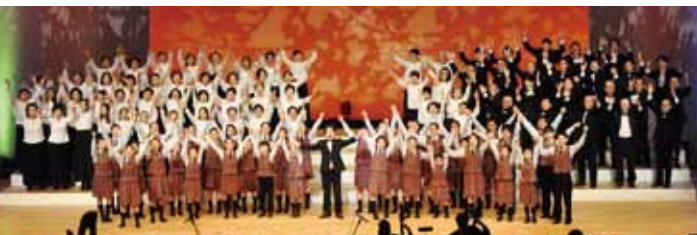
美しい合唱や趣向を凝らしたコラボレーションなど見どころ満載です

チケット取扱・問合せ先 ＝生涯学習文化課 ☎(56)1380、君津市民文化ホール ☎(55)3300