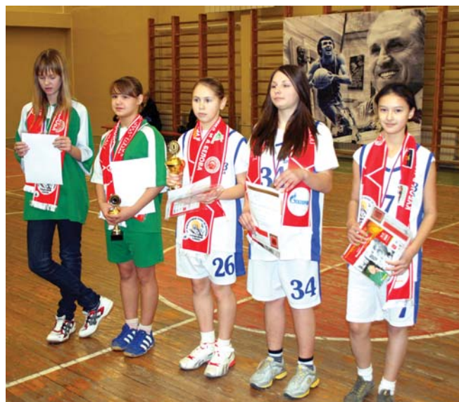
Лучшие на турнире среди девочек

Вам ничего не говорят эти фамилии? Что ж, ничего страшного. У ребят и их тренеров ещё много времени на их озвучивание. Ну а не получится – тоже не беда: в баскетбольной армии всем места хватит. В конце концов, звёзды особенно хороши, когда вокруг них множество звёздочек.