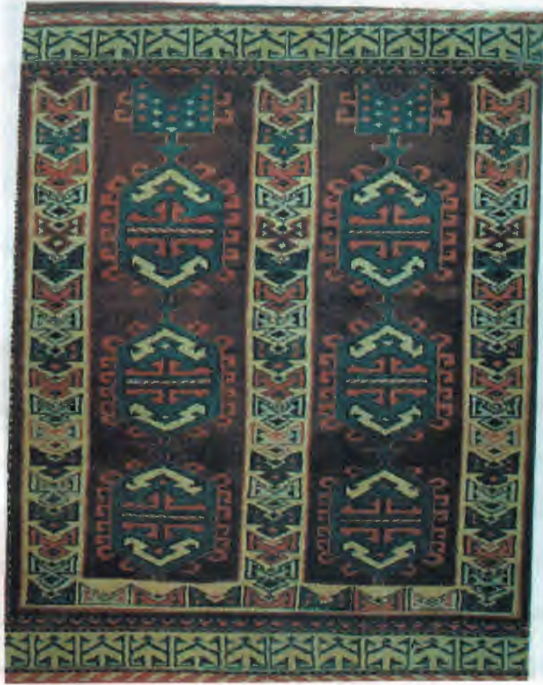
Selendi El Dokuma Halısına Bir Örnek

Heybe ise, torbanın çift gözlüsüdür. Yiyecek-içecek, araç-gereç, ve eşya taşımak için kullanılır. İnsanlar tarafından taşınabildiği gibi yük hayvanlarıyla da taşınır. Evlerde süs eşyası olarak kullanılır. Selendi halkının yaşamında vazgeçilmez dokuma olduğu gibi ekonomisine de katkısı vardır. Çünkü turistler ve işyeri sahipleri tarafından süs eşyası olarak rağbet görmektedir.