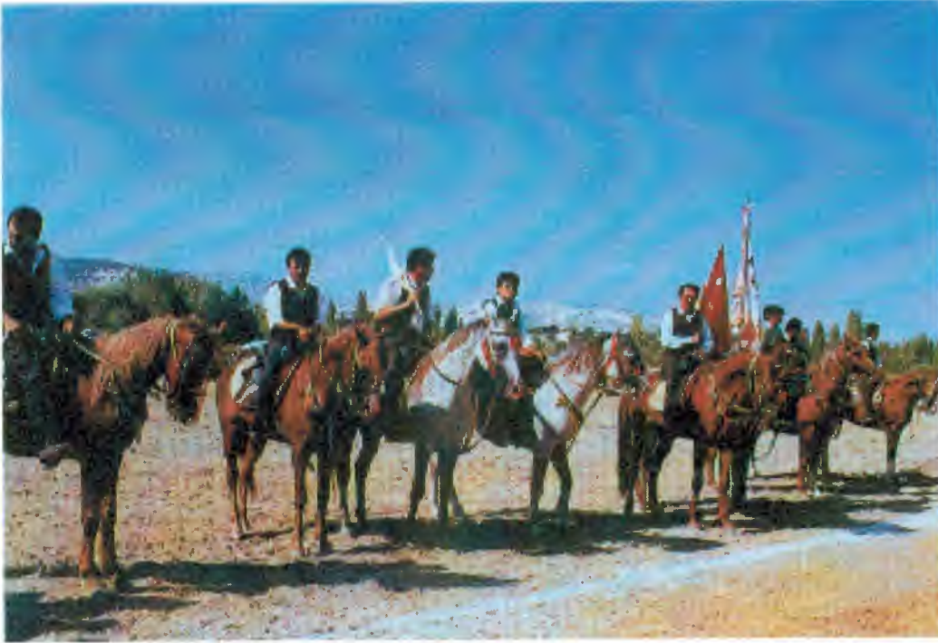
Selendi Cirit Takımı