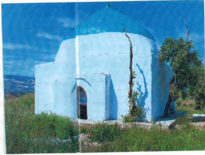
Ömer Dede Türbesi