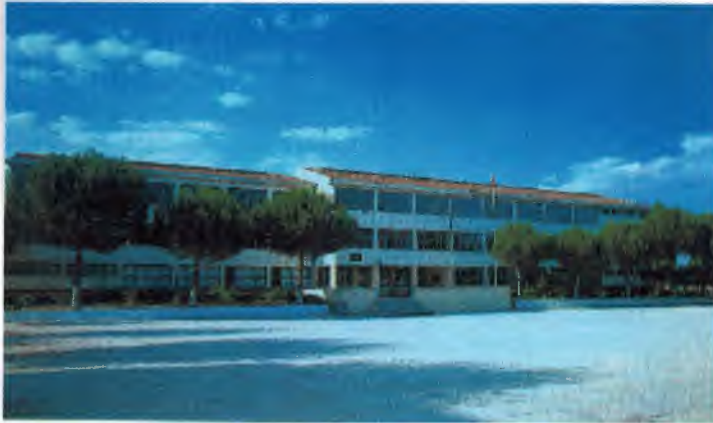
Yatılı İlköğretim Bölge Okulu

İlçede öğrenci sayısı ve eğitime talebin artması göz önüne alındığında yeni okul- ların açılması ihtiyacı ortaya çıkmıştır. İlçe merkezinde dört ilköğretim okulu ile beraber üç tane lise düzeyinde okul vardır. Manisa ilinde tek yatılı ilköğretim okulu Selendi'de bulunmaktadır. Eğitim öğretim konusundaki tek eksiklik ilçede yüksek öğretimin bulunmamasıdır.