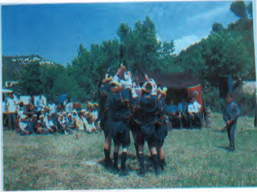
Kurtuluş Şenliklerinden Görünüm