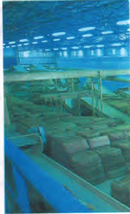
Selendi Yaprak Tütün İşleme Atölyesi