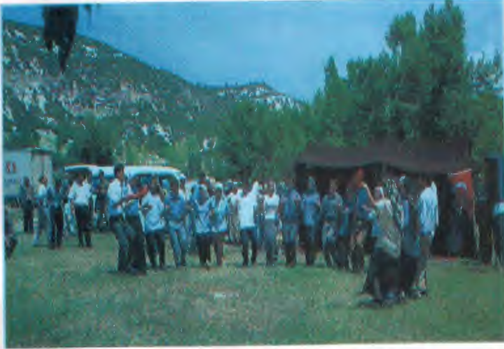
Halkın Birlik ve Beraberlik Görüntüleri