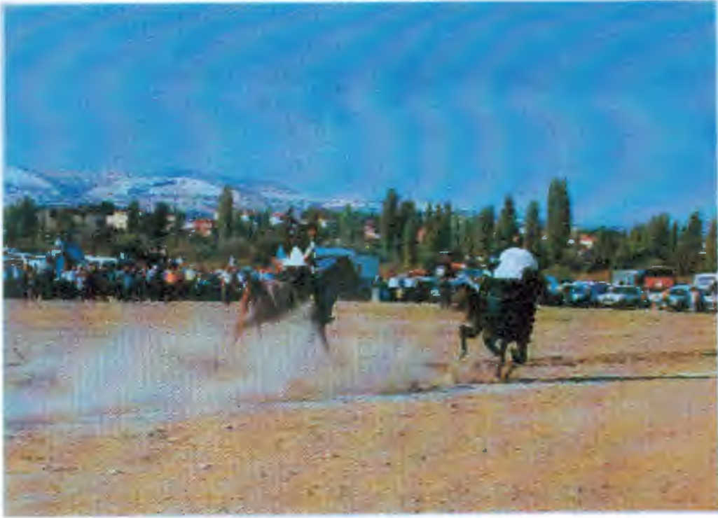
Cirit Oyunundan Bir Görünüş