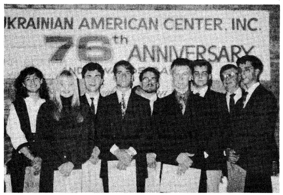
Студентки Українсько-Американського Осередку під час бенкету у Дітройті.