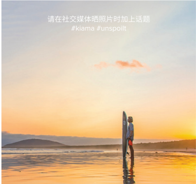
South Coast Outbrain

凯阿玛游客信息中心提供本地特产, 纪念品和礼物。每天早上9点到下午5点营业, 可以用银联卡消费。