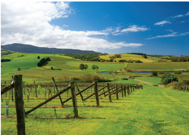
Left to right: Lorem Ipsum, Golf, Crooked River Winery