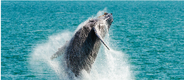
Left to right: Kiama Coast Walk, Farmers Market, Whales