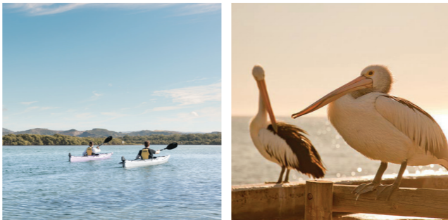
Left to right: Kiama Blowhole, Minnamurra River kayaking, Sea birds