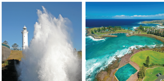
Left to right: Kiama Blowhole, Kiama Harbour

位置: 詹贝鲁区詹贝鲁路1215号 (1215 Jamberoo Road, Jamberoo), 距离凯阿玛市镇15分钟。