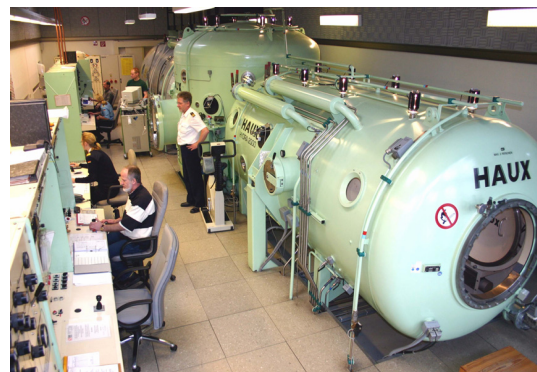
Druckkammer Hydra 2000