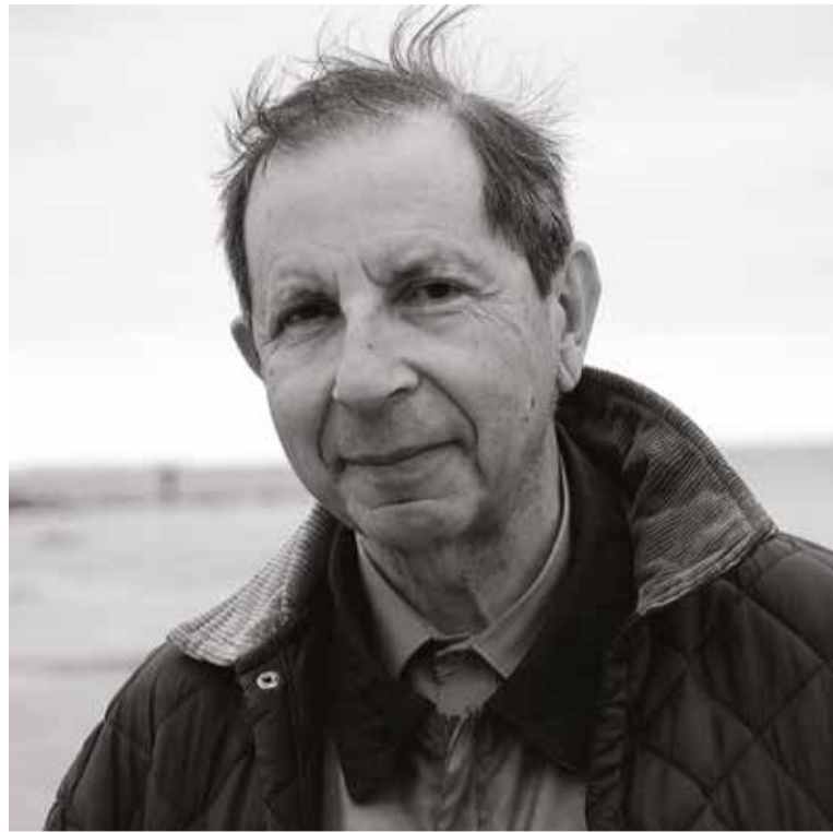
Композитор С.М. Слонимский

Каждый приезд Сергея Михайловича Слонимского в Москву всегда становился для музыкантов столицы событием. Так было и 2 ноября 2019 года в переполненном Рахманиновском зале, где встретились не только друзья и коллеги выдающегося композитора, но и многочисленный отряд молодежи различных творческих вузов. И это понятно – искусство петербургского мастера не нуждается в рекламе. На гала-концерт пришли слушатели, не утратившие способность живой реакции на порой достаточно сложную музыку, словом, истинные ее любители, понимающие, что сделанное Слонимским-композитором, педагогом, пианистом, теоретиком, общественным деятелем, есть важнейшая составляющая отечественного современного искусства.