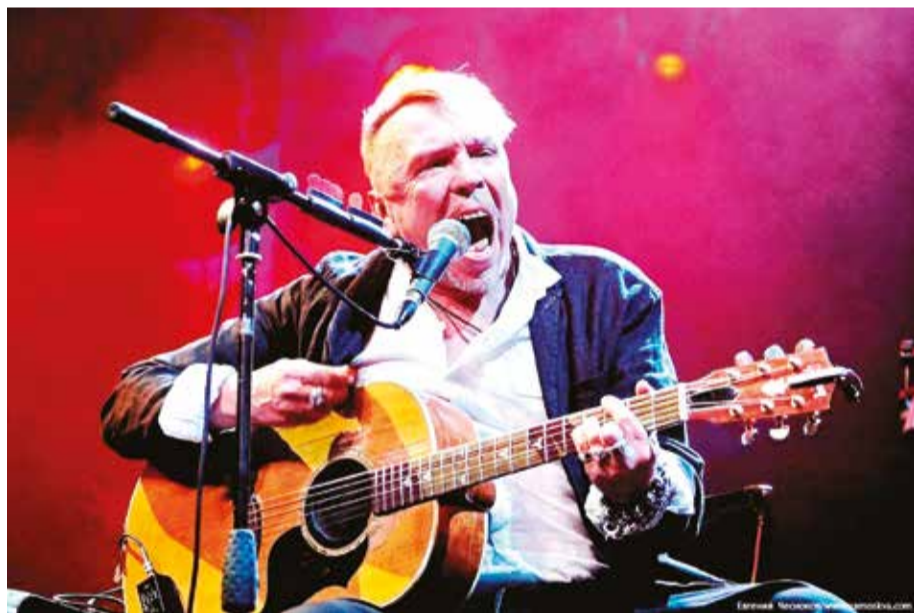
Лидер групп «Бригада С» и «Неприкасаемые» Гарик Сукачев

Убогий и невзрачный быт, в котором пребывала и который отражала наша рок-музыка, вступал в зияющее противоречие с образом счастливой советской действительности в стране развитого социализма. На этой основе складывалась абсурдистски-гротесковская концепция двоемира, отражавшая реалии самой жизни. Возникла антиномичность, когда мифологема недосыгаемой высокой жизни и культуры опрокидывались в современный быт, в повседневность, создавая острые, парадоксальные антитезы.