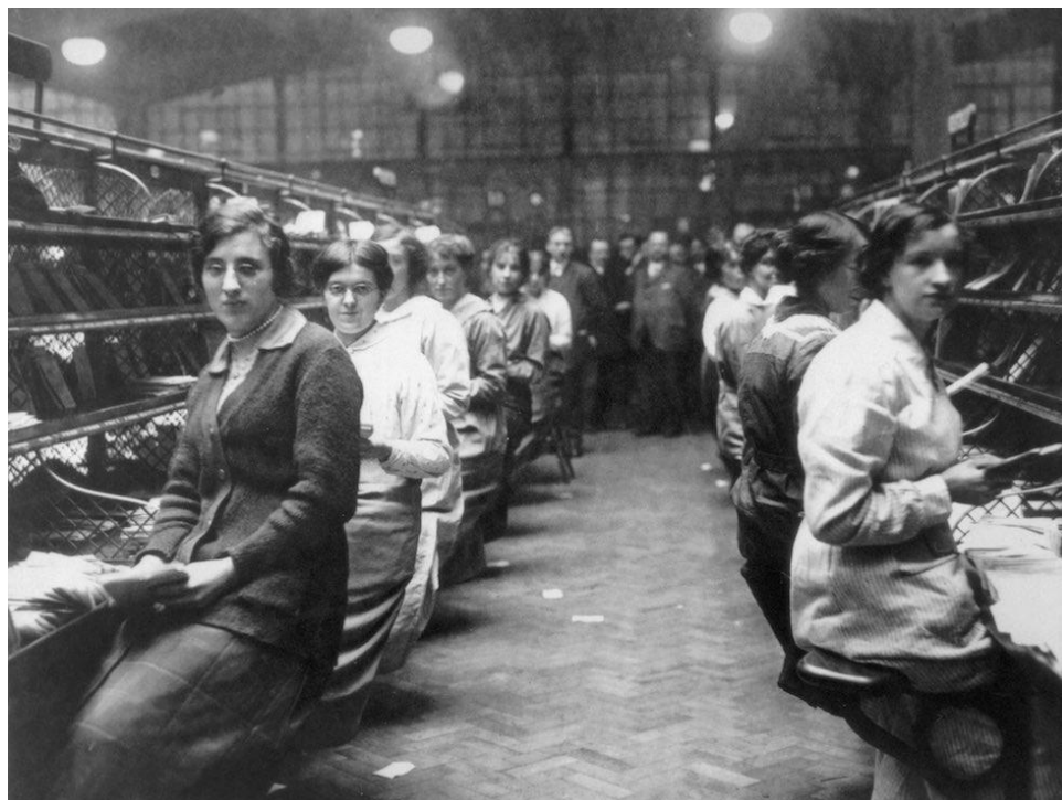
Εργαζόμενες γυναίκες υπό την επίβλεψη των ανδρών προϊσταμένων τους