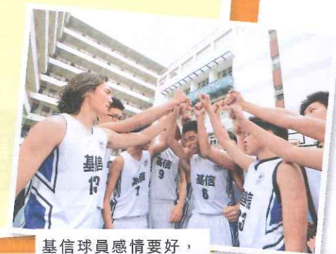
基信球員感情要好，在籃球場上互相扶持。