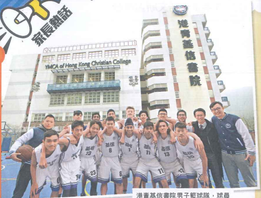
港青基信書院男子籃球隊，球員來自不同國家，綽號「世界軍」。

直資中學港青基信書院的男子籃球隊近年在藍灣及離島區學界比賽中表現突飛猛進，在各個籃球比賽和精英賽更奪得冠軍。隊員均練得一身好體能，令整支球隊的實力增強。除為比賽爭勝作好準備外，球隊教練亦通過籃球訓練，為他們上了一課「大人先修課」，教他們如何當一個成熟的人。