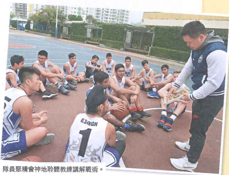
隊員聚精會神地聆聽教練講解戰術。