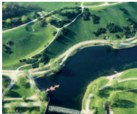
Olympiapark München