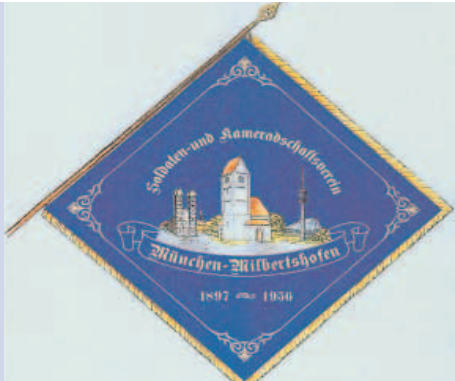
Vereinsfahne – Vorderseite