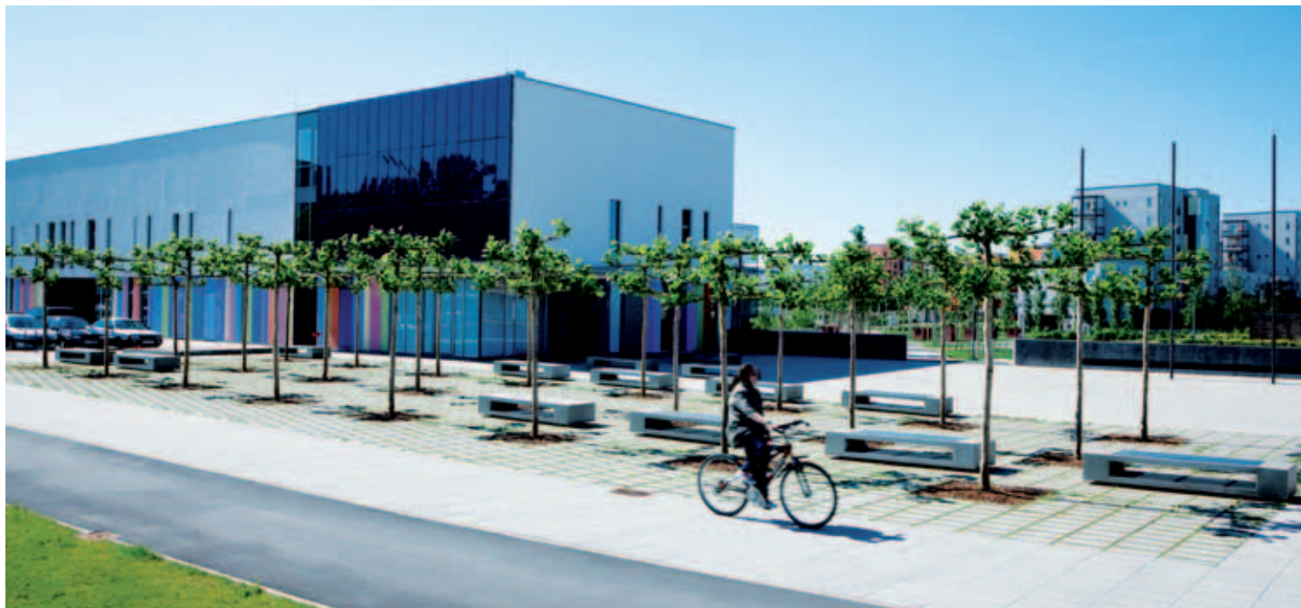
Nordhaide – Platz an der Neuherbergstraße