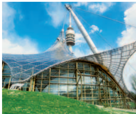
Olympiapark München