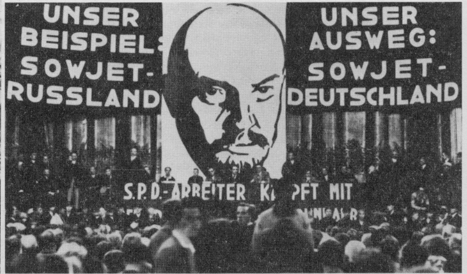
"Volksfront"-Werbeveranstaltung der KPD 1930 in Berlin