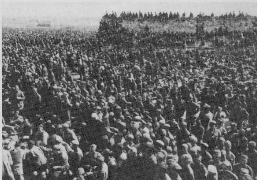
Gefangene bei Uman. — Ende der Kesselschlacht am 8. August 1941. "Mit der Vernichtung von 2 AOK's, 7 Korps und etwa 15 Inf. und 5 Pz.Div. ist die Masse des Feindes vor der Heeresgruppe Süd entscheidend geschlagen" (Kriegstagebuch des OKW): 103.000 Gefangene. — Einen Monat später, Ende September 1941 nach der Zerschlagung von 5 weiteren sowjetischen Armeen östlich Kiew: 665.000. — Der Tagesbefehl der Heeresgruppe Mitte vom 19. Okt. 1941 meldete nach Beendigung der Kesselschlacht von Briansk und Wjasma weitere 673.098 Gefangene. Und immer noch waren Rußlands Reservens unerschöpflich.