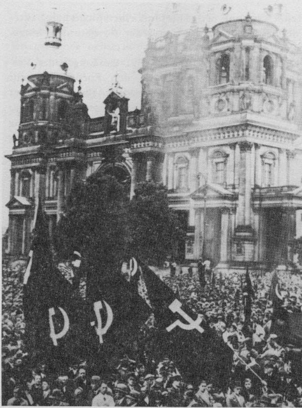
Rotfront-Veranstaltungen vor dem Berliner Dom, vor 1933 ein fast alltägliches Bild. — "Technischer Sekretär" des KPD-Politbüros 1931 = Herbert Wehner.