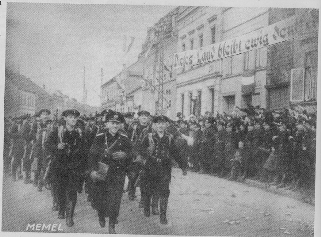
Das 1919 widerrechtlich abgetrennte Memelland kehrt im März 1939 "heim ins Reich"

Es wird einem übel, wenn man diese Leute und ihre Gesinnungsfreunde - "im Westen" - quacksalbern hört, mögen Sie nun Professorentitel tragen, Politiker oder Journalisten sein, "Adolf Hitler sei an allem schuld".