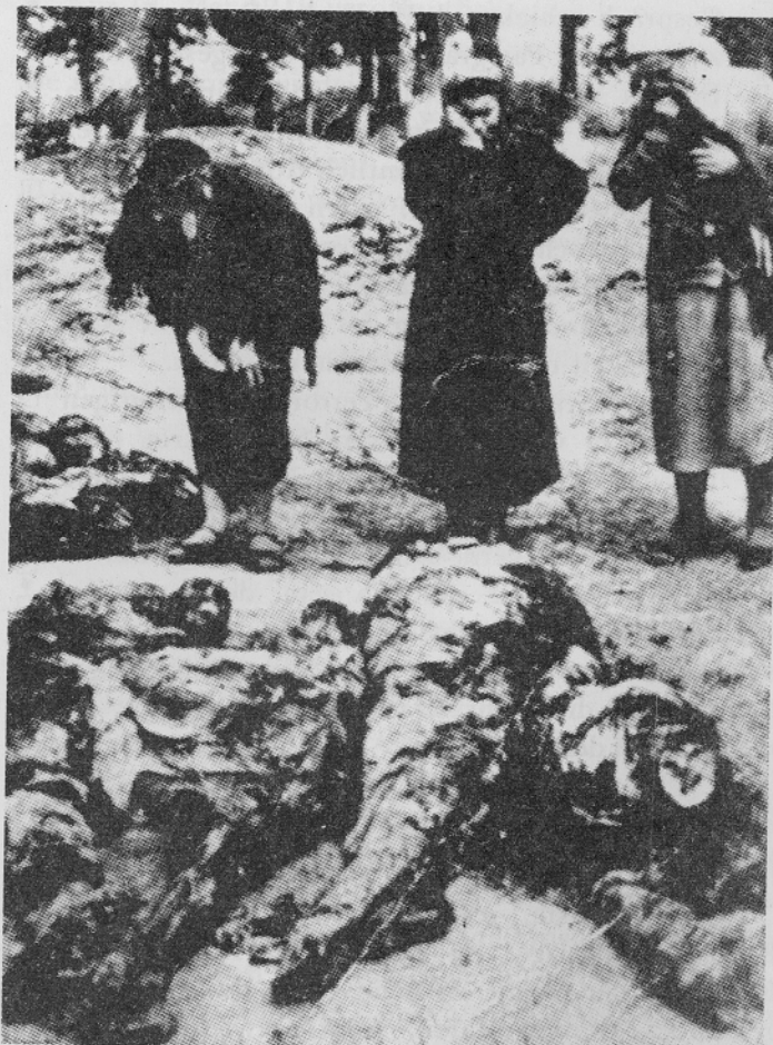
Mordopfer der GPU in Winniza/Ukraine und Angehörige; Aufnahme 1943

Der Führer war dieser Überzeugung, er vermutete geheime Abmachungen zwischen England und Rußland. Kein anderer Grund hätte dieses ungeheure Wagnis gerechtfertigt. Wir brauchten den russischen Raum nicht; mit einem sicher neutralen Rußland im Rücken war der Krieg gegen die Achse vom Westgegner nicht zu gewinnen." 7)