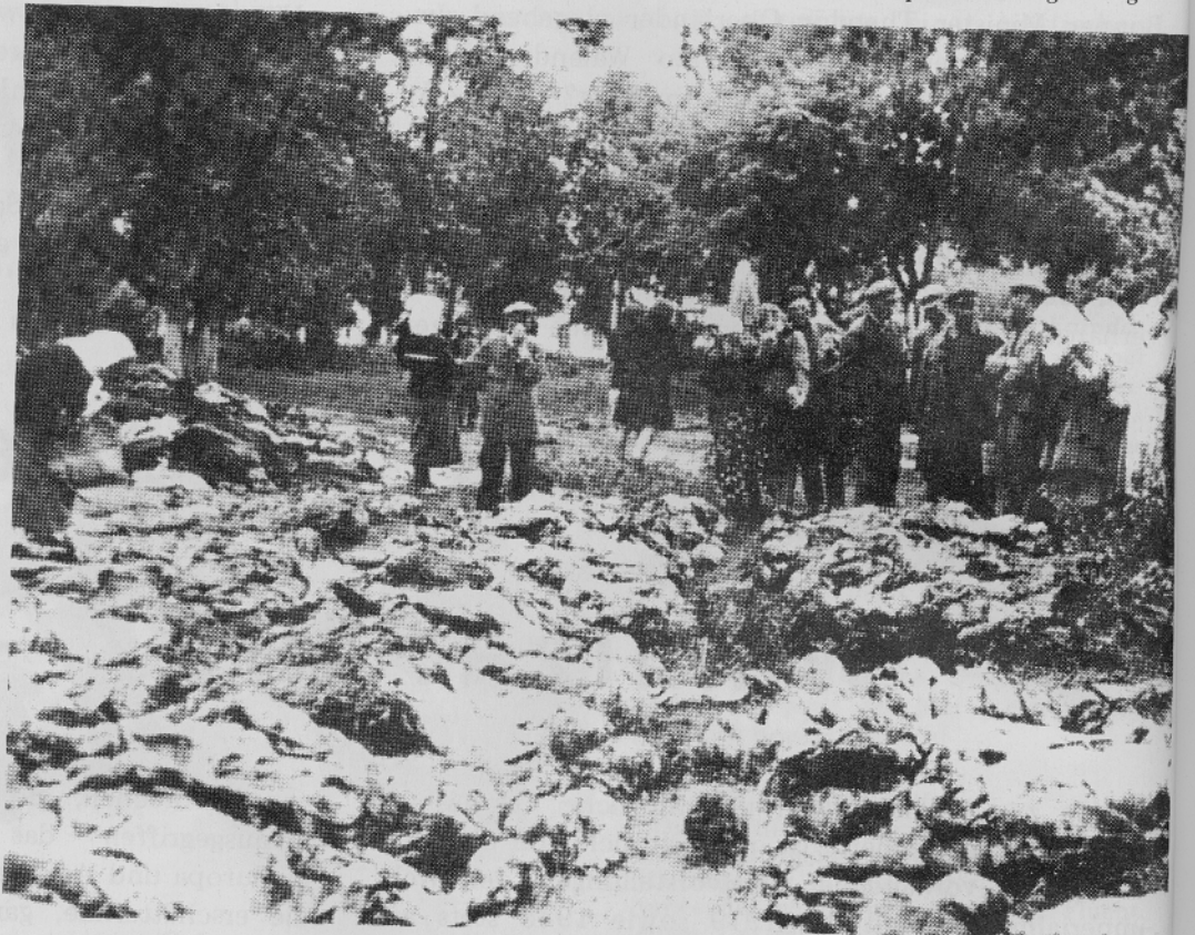
Mordopfer der GPU in Winniza / Ukraine und Angehörige; Aufnahme 1943

Es ist besonders charakteristisch, daß in allen Fällen wohl Einschüsse in das Opfer festgestellt wurden, aber keine Anzeichen von Durchschüssen. Die Fälle, da Geschosse durch den Kopf hindurchgedrungen, also wieder ausgetreten sind, waren sehr selten. Daß Geschosse nicht durch den Kopf hindurchgedrungen