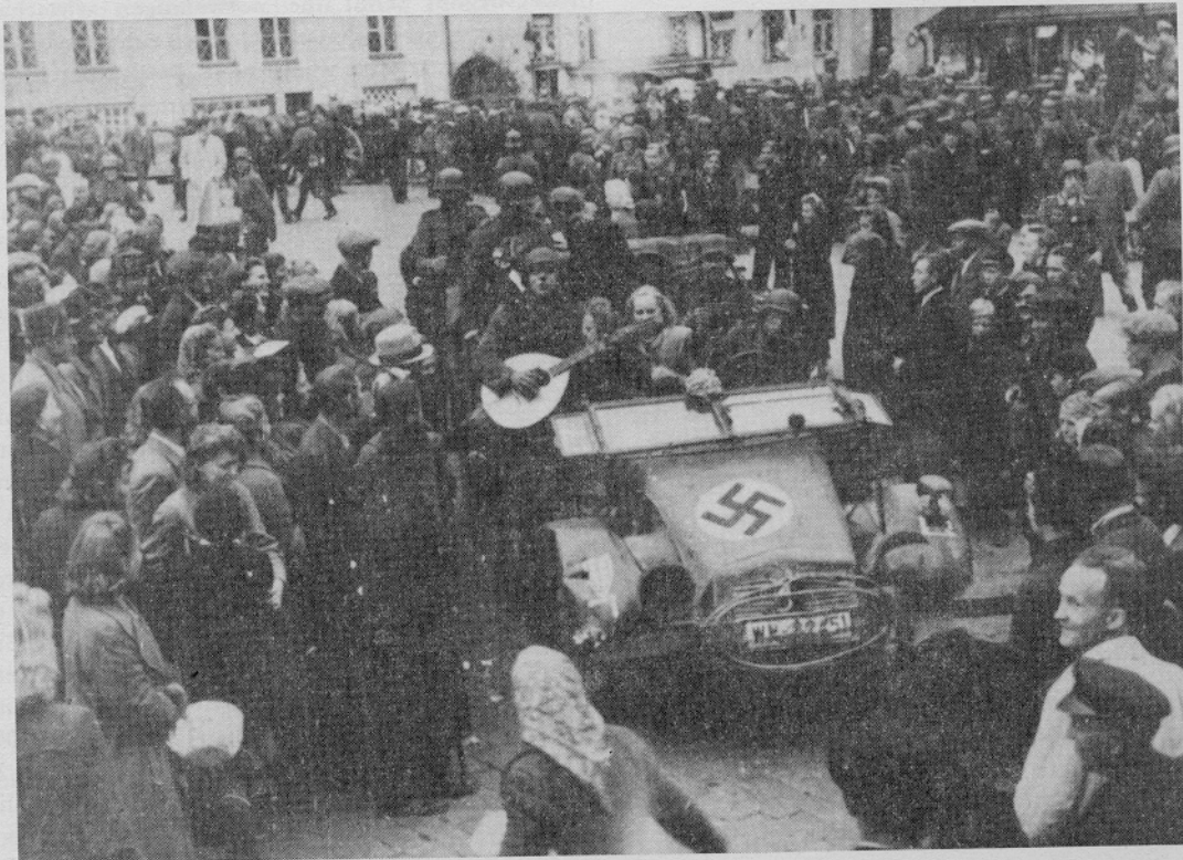
Deutsche Truppen beim Einmarsch in Reval, der Hauptstadt Estlands, am 28. August 1941

Das gleiche gilt für das Zitat, in dem Anfilow mit flüchtiger Ausrede darzutun versucht, daß die sowjetische Angriffsstrategie einen vorangehenden An-