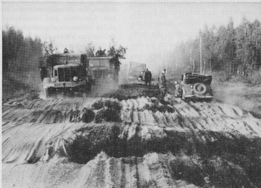
Hauptstraße in Sowjetrußland

Erstaunlich ist, wieviel geheimes Material Fabry aus den deutschen Archiven ausgewertet hat und wie lange dieses Material (seit 1945!) verschlossen geblieben war. Fest steht, daß der deutschen Führung noch weit mehr Nachweise für den Stalin'schen Europafeldzug bekannt gewesen waren, — aber auch den "menschenfreundlichen" Engländern und Amerikanern.