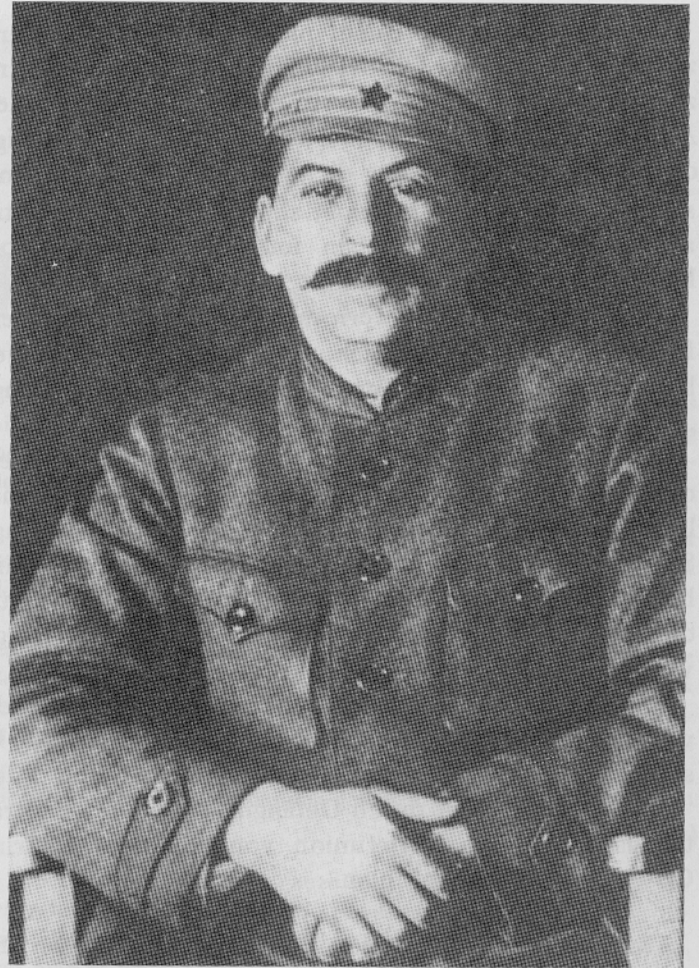
Terrorist und Massenmörder Josef Stalin im Jahre 1921

Diese Idee wurde von Lenin in einem Brief zum Strafrechts-Entwurf an den Volkskommissar der Justiz, Kurski, klar und deutlich zum Ausdruck gebracht: 3)