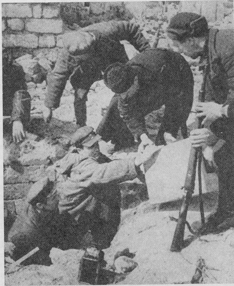
Sowjetische Partisanen beim Anlegen von Stützpunkten

Die wirtschaftlichen Vereinbarungen mit Deutschland benutzte Stalin als "politisches Instrument" zur Durchsetzung seiner Weltrevolutionsziele (S. 193), blieb er doch bemüht, den Krieg auszuweiten, Friedensregelungen Deutschlands mit England zu vereiteln, Deutschland wirtschaftlich einzuengen bzw. abzuwürgen, gleichzeitig aber Hitler über seine eigentlichen Absichten zu täuschen.