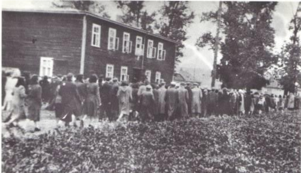
יהודים ליד משרדי האלטסטנראט בקובנה [3]

הא.ר. החליט לגייס היום לעבודה נשים שהן אמהות לילדים קטנים. עד כה שוחררו נשים כאלה מחובת עבודה. גיוסן הוא בתנאי שנמצאת בביתן אישה מבוגרת, קרובה או שכנה, המסוגלת לטפל בילדים. בשעה 5 בבוקר עמלה המשטרה לאסוף את הנשים האלה, לפי רשימה שהייתה בידה, ולהביאן לשער הגטו, כדי שיצאו משם לעבודה.