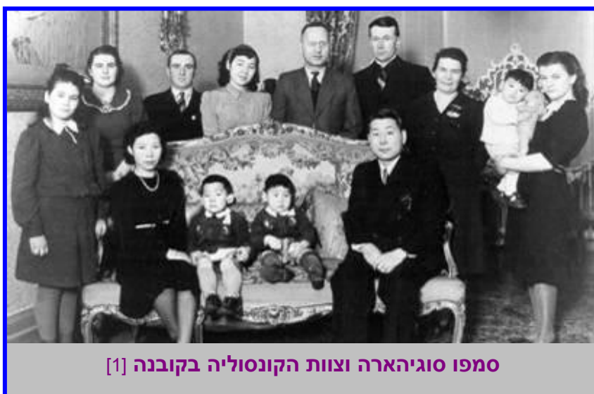
סמפו סוגיהארה וצוות הקונסוליה בקובנה [1]

סמפו סוגיהארה כיהן בשנת 1940 כקונסול כללי של יפן בעיר קובנה, בירת ליטא. ליטא סופחה לבריה"מ באוגוסט 1940, והשלטון הסובייטי הורה לכל הדיפלומטים הזרים לסגור את נציגותיהם. בקובנה התקבצו פליטים יהודים רבים שברחו ממדינות מזרח אירופה לאחר הכיבוש הגרמני.