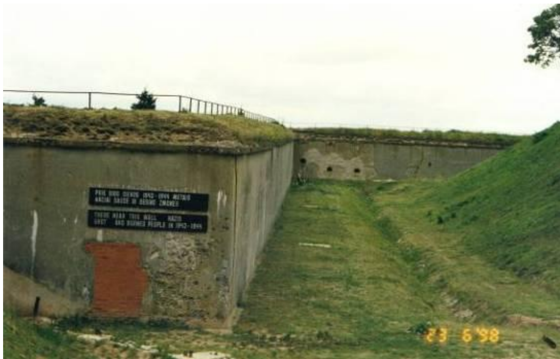
קיר המוות בפורט התשיעי [4]