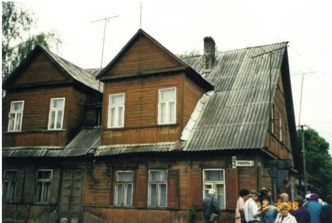
בניין ישיבת סלובודקה [4]