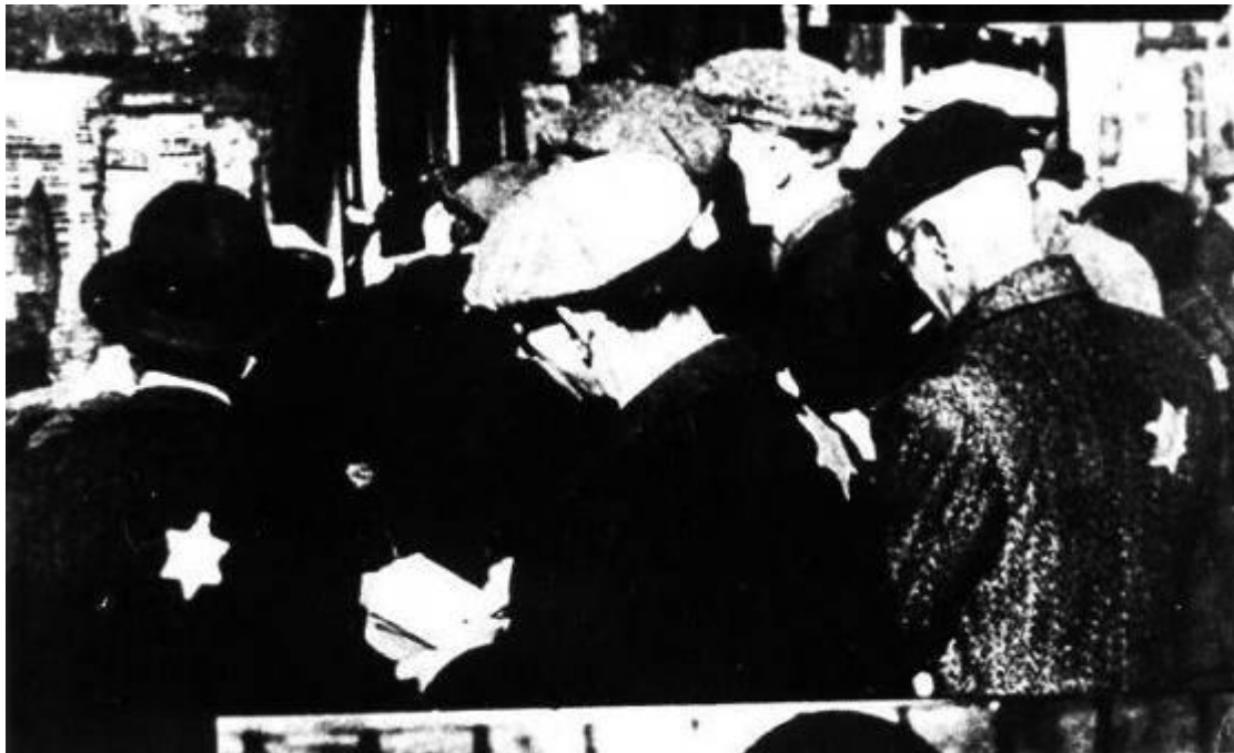
יהודים בגטו קובנה רושמים הוראות ופקודות שהודבקו על גבי לוח מודעות [1]