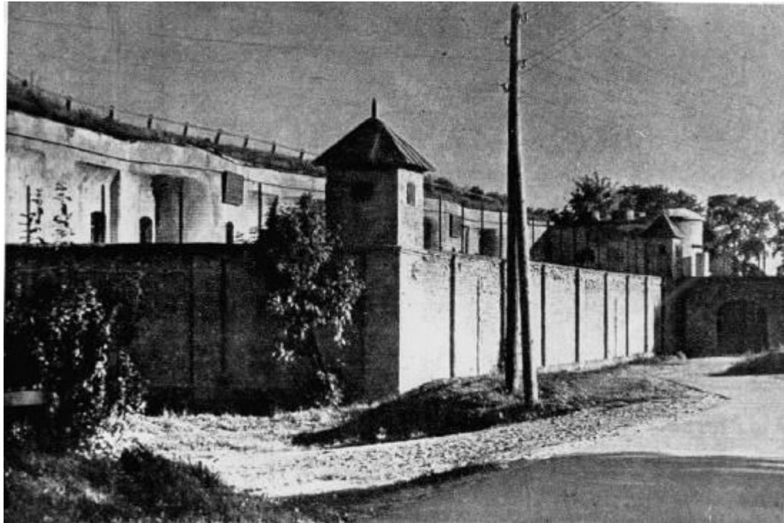
הפורט התשיעי [1]

בביטאון זה נתמקד בגיא ההריגה הגדול, שבו נרצחה מרבית יהדות קובנה ויהודים מגרמניה והוא "הפורט התשיעי". במקום נרצחו כ-42,000 איש. רובם יהודים.