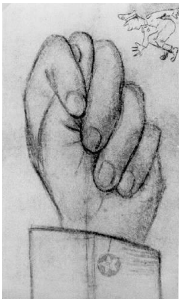
ציור "האצבע המשולשת" שהשאירו בורחי הפורט התשיעי על קיר תא בכלא [1]