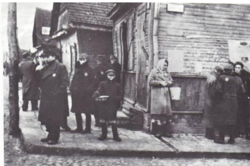
רוכלים באחד הרחובות בסלובדקה [3]