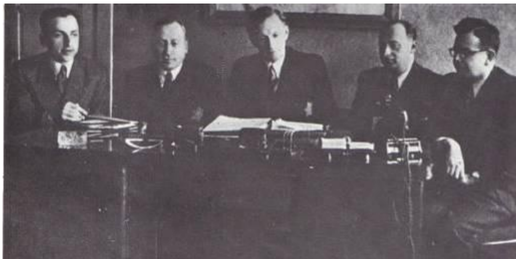
חברי האלטסטנראט, מימין לשמאל: