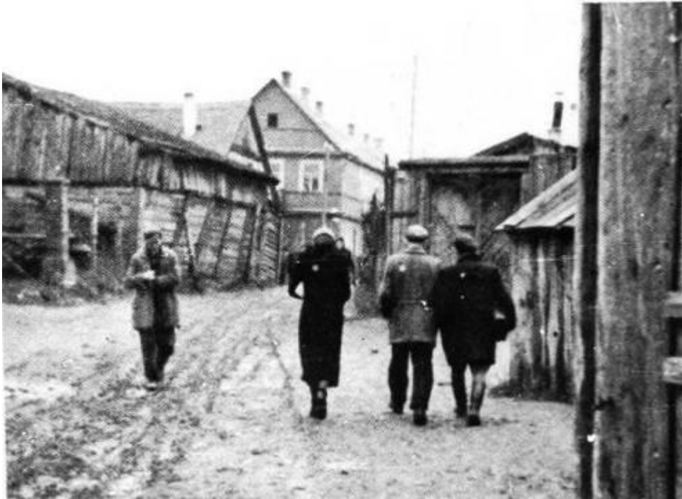
רחוב בגטו קובנה בשעת חזרה מהעבודה [1]

כממונה על הגטו מטעם הממשל הגרמני האזרחי נקבע האובר-שטורמפירר יורדאן, רוצח מובהק. עוזרו מונה הליטאי קאמינסקאס, פקיד העירייה לשעבר, איש מושחת, שעליו הוטל להיות "איש הקשר" בין הממונה על הגטו והיהודים.