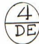
day above month