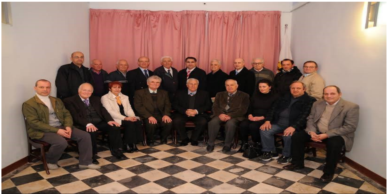
Il-Grupp Filateliku taż-Żejtun waqt iċ-ċelebrazzjonijiet tal-10 sena anniversarju flis-Sala tal-Kunsill Lokali - Frar 2012