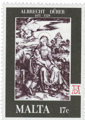
Mary with the long-tailed monkey

Here the Virgin Mary is holding the Child on her lap. The Child is playful and is seen holding a bird. The long-tailed monkey represents evil.