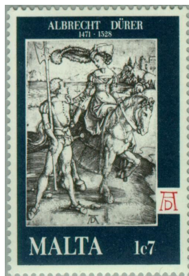
Young lady on horseback and trooper

Now going back to Durer, three stamps were issued on 7 March 1978, to commemorate the 450th anniversary of Durer's death. Which set was made up of the following: