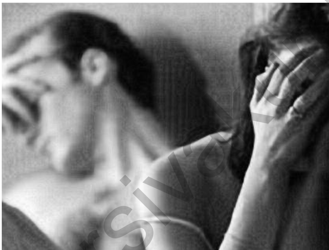
Ji %40 sedemê nezokiyê mêr, %40 jî jin in. Carna jî herdu bi hev re dibin sedem...

Li bajarê Hewlêrê di sala 2000î de çend kesên ku pirs-girêkên wan ên zarokbûyîna hene, komeleyek bi navê "Komeleya Awat" damezrandin û niha wê komelê bêtirî 7 hezar endamên wê hene û bûye hev-xema wan kesên ku pirs-girêka wan a zarokbûyîna hene.