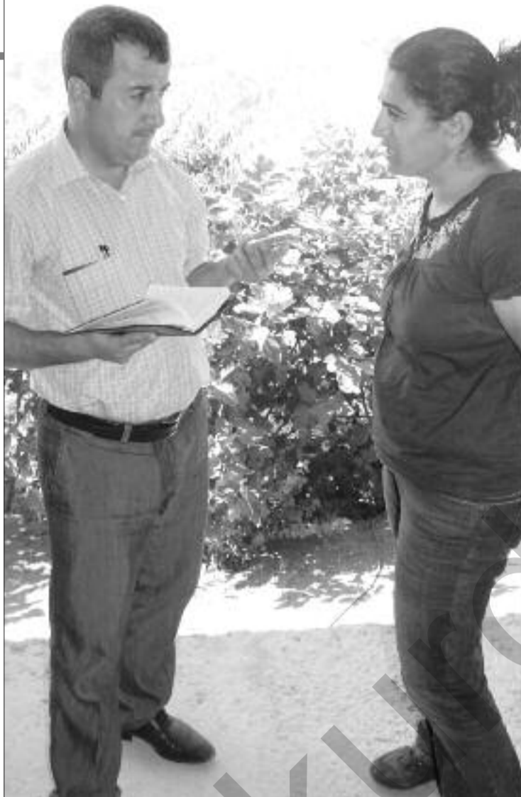
Tuncel û bi sedan jinên kurd di cejna Remezanê de ji li Şirnexê man

Bi rastî Serokwezî Erdogan di dema propogandeya hilbijartinê de, propogandeya ve qonaxê kir, çimkî wî digot kêşeya kurd li cem min bidawî hatiye. Bi vî rengî jî peyama hatina holê ya qonaxa îro dida. Qala yek al, yek nasname û yek mîllet kir, qala pêkhatiya pîrçandî ya Tirkiyeyê nekir. Ev jî di hate wateya ku siyaseta înkarkirinê berdewam dibe. Li himberî ve yekê gelê kurd li ser sindoqên hilbijartinê bersiva AKPê dan. Ji bilî hemû astengiyên 36 nûner şandin parlamenê ku AKPê yek ji wan ji xwe re bir. Erdogan fêma kir ku Kurd daxwaza