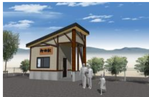
【新駅舎 完成イメージ】