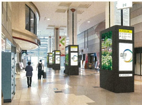
地域観光情報を発信する デジタルサイネージ(イメージ)