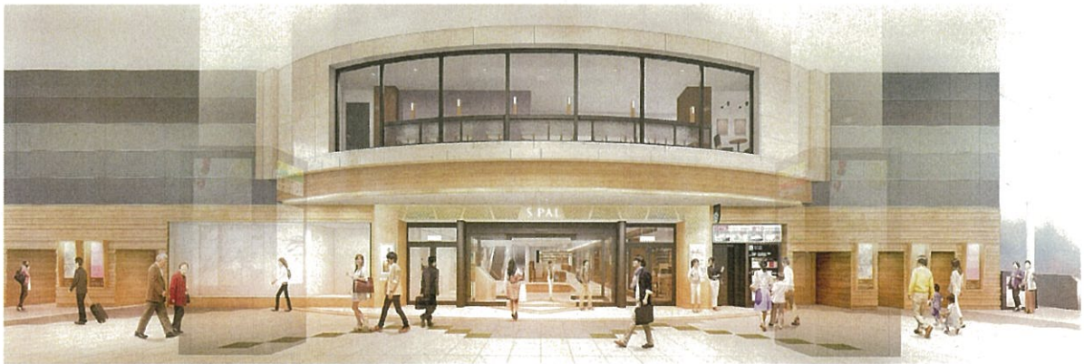
山形県産材で整備するエスパル壁面(イメージ)

山形県が進める「やまがた森林ノミクス推進事業(民間施設木造・木質化事業)」の助成を受け、山形県産材の金山杉を使用して壁面の整備を行い、山形の玄関口に相応しい環境づくりを行います。