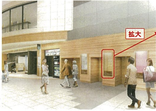
伝統工芸品を紹介する 情報発信パネル(イメージ)