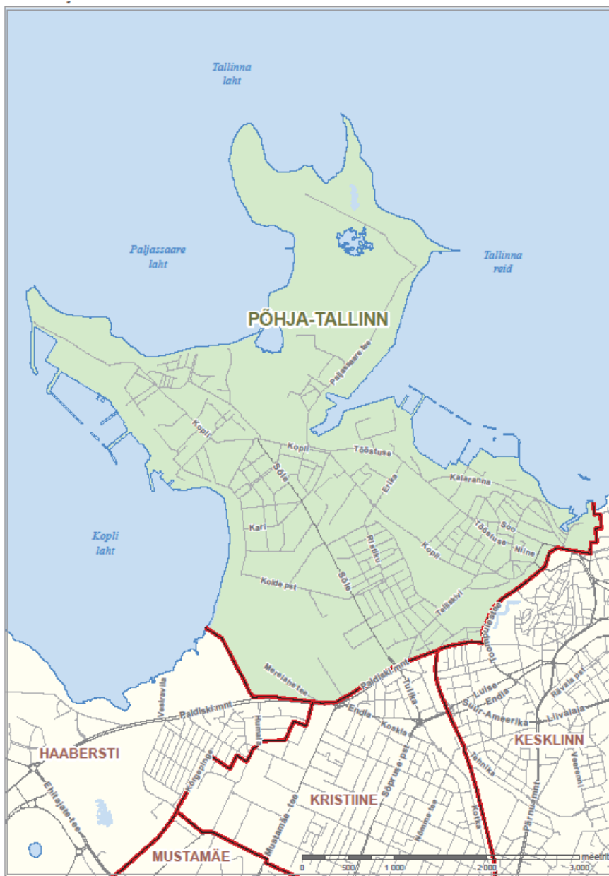
Põhja-Tallinna linnaosa skeem

Piir algab Kopli lahte suubunud vana kollektori edelaserva pikenduselt, kulgedes mööda merepiiri ümber Kopli ja Paljassaare poolsaare kuni Tallinna Linnahalli (Mere pst 20) kinnistu idapiiri pikenduseni, sealt pöördub piir lõunasse, kulgeb mööda Mere pst 20 ja 20d kinnistute idapiiri ning Mere pst 20 kinnistu ida- ja lõunapiiri, Põhja pst 33a ja 33 kinnistute idapiiri, ületab Sadama tänava, pöördub läände ja kulgeb mööda Põhja puiestee lõunaserva, Suur Rannavärv 1 kinnistu loodepiiri ning Rannamäe läänenõlva (Rannamäe tee 11 kinnistu läänepiir) Suurtüki tänavani. Edasi kulgeb piir mööda Rannamäe tee põhjapoolset, Toompuiestee läänepoolset ja Paldiski mnt põhjapoolset eralduspiiri lääne suunas kuni Lahepea tänavani, ületab selle ja kulgeb mööda Lahepea tänava lääneserva loode suunas kuni vana kollektorini ning piki kollektori edelaserva mereni.