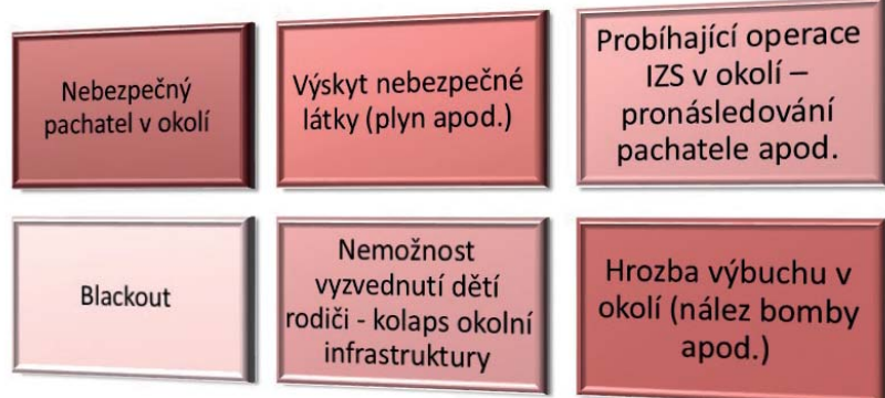
Příklady možných scénářů, kdy je místo evakuace vhodná invakuace