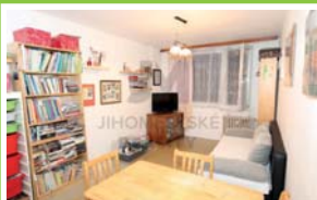
PRODEJ BYTU 2+kk Michnova, Chodov

Prodej bytové jednotky 3+kk (původně 4+kk), užitná plocha jednotky 90 m 2 , v DV s převodem do OV, v 4. podlaží z 6.