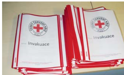
Podklady ČČK Praha 1 pro jednotlivé ZŠ

Samotný pojem invakuace vymezuje zejména situace, kdy nebezpečí není uvnitř objektu (případ evakuace), ale naopak v bezprostředním okolí budovy. Z těchto důvodů tak není bezpečné pouštět nikoho jak mimo budovu, tak do budovy, která musí zůstat hermeticky uzavřena. V danou chvíli je tak potřeba bezpečně ukryt a postarat se o všechny, kdo se v danou chvíli nachází uvnitř objektu. Kritickou dobou tak může být jakkoliv dlouhý časový úsek, až do doby, dokud nebezpečí nepomine.