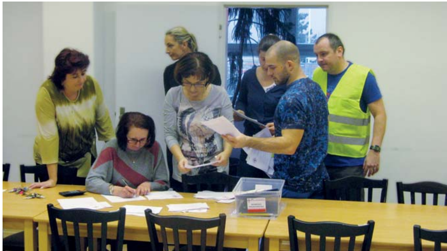
Práce štábu v rámci invakuace

Zlomovým rokem byl v tomto ohledu květen 2012, kdy se nám podařilo realizovat na ZŠ Mikulova rozsáhlé a ojedinelé první oficiální cvičení v ČR zaměřené právě na procvičení jednotlivých principů souvisejících s možnou invakucí objektu školy. Na samotné výše zmíněné cvičení navázalo v květnu 2015 školení jednotlivých zástupců a ředitelů všech MŠ a ZŠ na Jižním Městě. Koncem roku 2016 se již realizovala první cvičení na jednotlivých základních školách, která byla právě nedávno úspěšně završena.