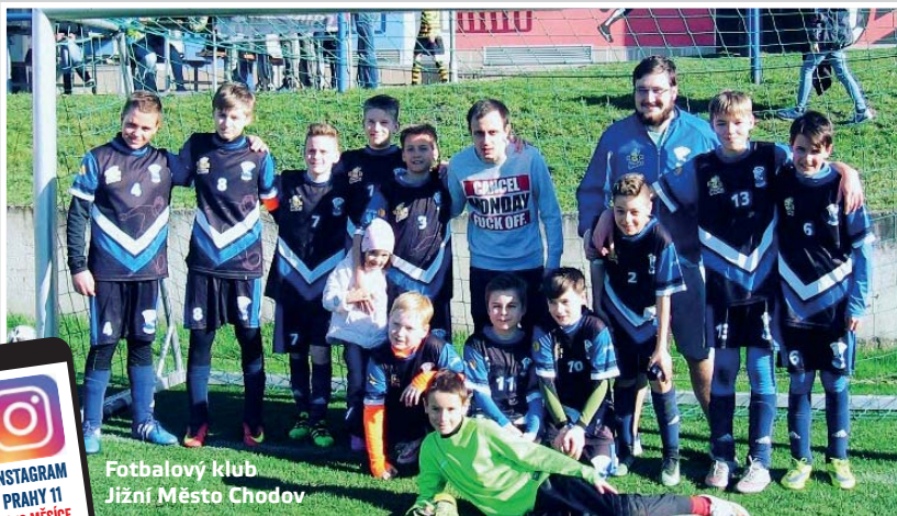
Fotbalový klub Jižní Město Chodov

Srdečně vás zveme na vzpomínkový pietní akt. Pietní akt se uskuteční v úterý dne 9. května 2017 v 9 hodin na Chodovském hřbitově . Bude uctěna památka zde pohřbených 263 rudoarmějců padlých v pražské operaci a 31 padlých pražských povstalců z Chodova a okolí. Český svaz bojovníků za svobodu za podpory MČ Praha 11 jsou přesvědčeni, že tato pamětní akce kladně působí na přítomnou mládež, která v doprovodu svých pedagogů nebo rodičů se tím učí vzdávat úctu hrdinům, padlým v poslední velké bitvě nekrutější války v dějinách lidstva, kdy byl náš národ nepřitelem dokonce předem odsouzen k smrti.