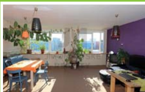
PRODEJ BYTU 3+kk Kloknerova, Chodov

Chcete být první, koho oslovíme s nabídkou konkrétní nemovitosti, než bude kdekoliv inzerována? Neváhejte nás kontaktovat s Vašimi požadavky.