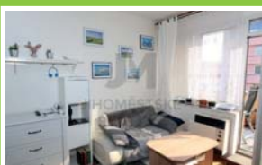
PRODEJ BYTU 1+kk/T Sedlčanská, Michle

Prodej bytové jednotky 3+1 s lodžii, užitná plocha jednotky 64 m 2 , v osobním vlastnictví. Bytová jednotka se nachází v 4. podlaží z 11.