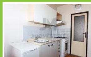
PRODEJ BYTU 1+1/L Steinerova, Háje

Prodej bytové jednotky 2+kk, užitná plocha jednotky 43 m 2 , v osobním vlastnictví. Bytová jednotka se nachází v 1. podlaží ze 12.