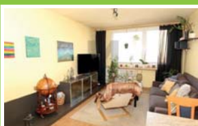
PRODEJ BYTU 3+1/L Ke Kateřinkám, Chodov

Prodej bytové jednotky 3+1 s lodžii, užitná plocha jednotky 78 m 2 , v DV s převodem do OV. Bytová jednotka se nachází v 11. podlaží z 12.