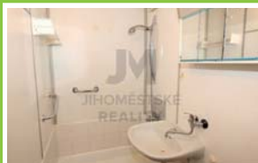
PRODEJ BYTU 2+kk/L Plickova, Háje

Prodej bytové jednotky 2+kk, užitná plocha jednotky 43 m 2 , v osobním vlastnictví. Bytová jednotka se nachází v 5. podlaží z 8.