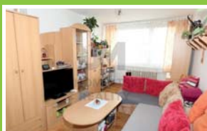
PRODEJ BYTU 2+kk Nad přehradou, H. Měcholupy

Prodej bytové jednotky 1+kk s terasou, užitná plocha jednotky 50 m 2 , v osobním vlastnictví. Bytová jednotka se nachází v 5. podlaží ze 5.