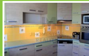
PRODEJ BYTU 3+1/L Leopoldova, Chodov

Prodej bytové jednotky 2+kk s lodžii, užitná plocha jednotky 49 m 2 , v osobním vlastnictví. Bytová jednotka se nachází v 11. podlaží z 12.