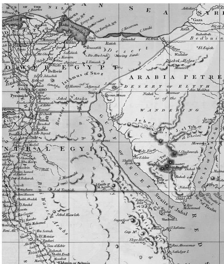
איור 2: המפה המדינית הראשונה של המזרח התיכון. מתוך הצו הסולטני משנת 1841

המפה שמכאן ואילך תיהפך לבסיס בכל הנוגע לגבולותיה של מצרים והמדינות הסמוכות, נקראת המפה משנת 1841. 23 היא שורטטה בקווים דקים ומלמדת כי סיני ח'ג'אז (Hijaz) נמצאת מחוץ לגבולות מצריים ונשארת בידי העות'מאנים; הגבול עובר בקו המחבר את סואץ שנשארה בגבולות מצריים עם נקודה באזור חן-יונס. 24