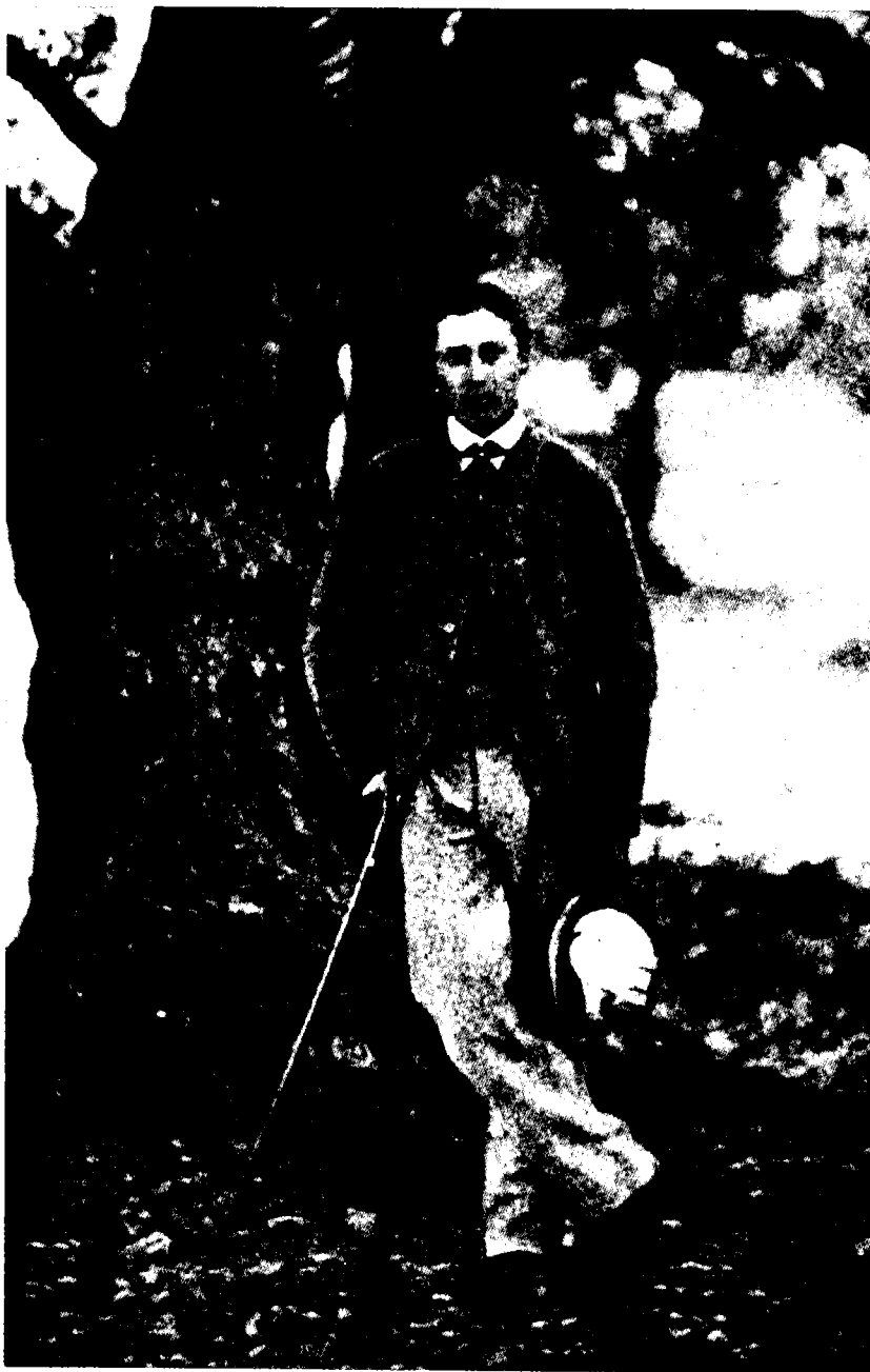
הנסיך מוולס (לימים אדוארד השביעי) בעת ביקורו בארץ בשנת 1862. מתוך ספר הזכרונות של