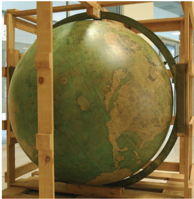
Vincenzo Maria Coronelli, Wereldbol (1688), Koninklijke Bibliotheek van België, Afdeling Kaarten en Plannen.

Aan de vooravond van de Eerste Wereldoorlog bedroeg het gemiddelde aantal lezers overdag 149 en 's avonds 39. In de tijdschriftenzaal werden toen dagelijks gemiddeld 75 lezers geteld en in de werkzaal voor geleerden, die in 1910 was opengesteld, 8. Pas vanaf 1913 kregen die lezers overigens toegang tot de catalogi. Tot dan toe zorgden personeelsleden voor alle opzoekingen, zowel in de systematische als in de auteurscatalogus.