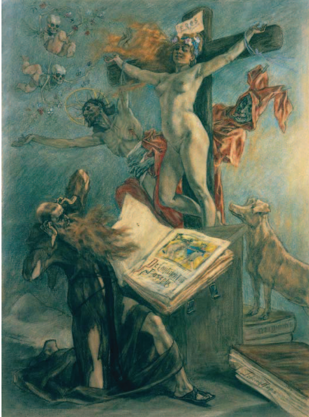
Félicien Rops, La tentation de Saint Antoine (1878), Koninklijke Bibliotheek van België, Prentenkabinet, S V 86.652.

Antonius , het provocerende schilderij dat Félicien Rops in 1878 vervaardigde (Prentenkabinet, S.V 86652). In een barokke compositie die aan Rubens herinnert, stak Rops de draak met de strijd van de katholieke Kerk voor onthouding en ridiculiseerde hij de strenge seksuele moraal van de bourgeoisie. Heiligschennend verving de kunstenaar de uitgemergelde figuur van Christus bijvoorbeeld door een wulpse naakte vrouw, terwijl het traditionele opschrift I.N.R.I. plaats moest maken voor een duidelijke verwijzing naar Eros. Aan de voet van het kruis liet Rops de Heilige Antonius opschrieken uit zijn meditatie.