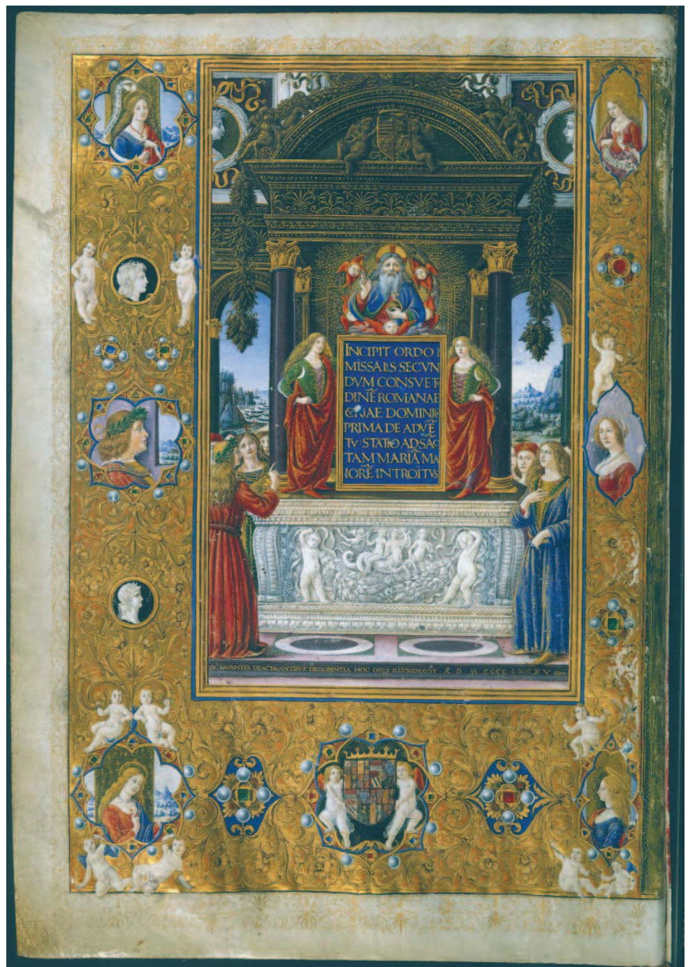
Missale Romanum of Missaal van Matthias Corvinus (1485-1487), Koninklijke Bibliotheek van België, Handschriftenkabinet, Ms. 9008.