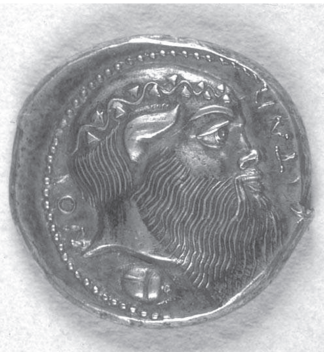
Tetradrachme van Aetna (ca. 465-455), Koninklijke Bibliotheek van België, Penningkabinet, Coll. L. de Hirsch, nr. 269.