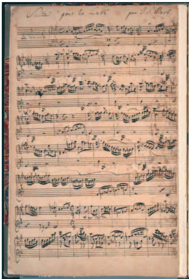
Johann Sebastian Bach, Luitsuite in sol klein BWV 995 (ca. 1727-1731), Koninklijke Bibliotheek van België, Afdeling Muziek, Mus. Ms. II 4085.