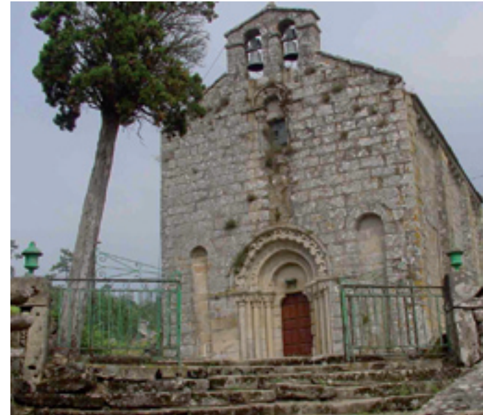
Igrexa románica de Santa María de Herbón.