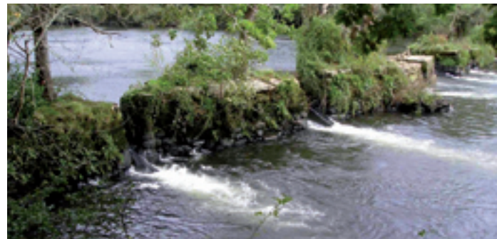
Pesqueiras romanas de Herbón.

construído maioritariamente no século XVII e rematado definitivamente no 1885. Exteriormente destacan as altas torres e a escalinata. No interior, o retablo do altar maior. Igrexa Parroquial de estilo románico, reformada ao longo dos séculos.