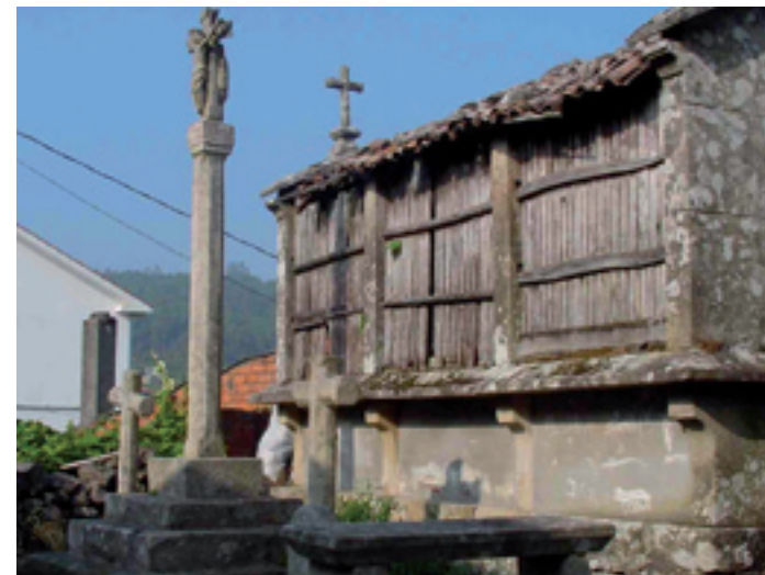
Cruceiro de Xoane. Carcacia.