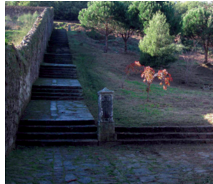
Vía Crucis de subida ao Santiaguíño.