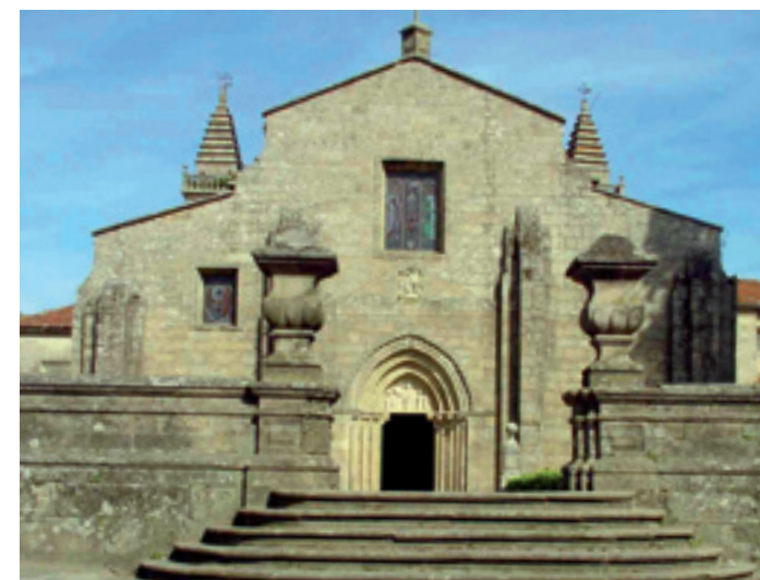
Igrexa de Iria Flavia.

Casa Museo de Rosalía de Castro . Monumento Histórico Artístico desde o 7 de outubro de 1946. Casa Museo desde 1972. Nas súas dependencias faise un percorrido pola vida e obra da poetisa (1837-1885).