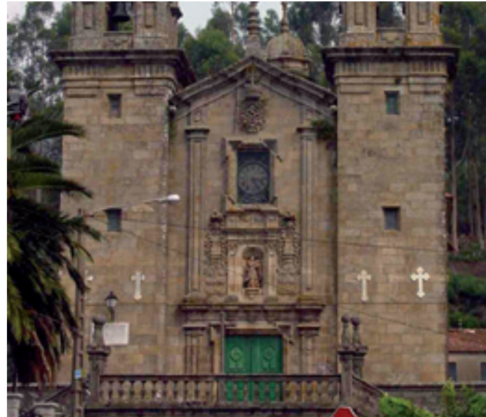
Santuario da Nosa Señora da Escravitude.