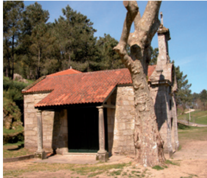
Capela do Santiaguíño do Monte.