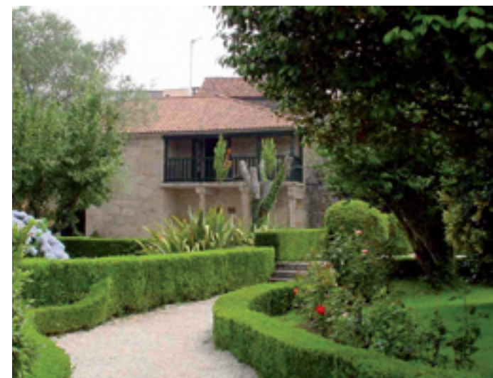
Casa museo de Rosalía de Castro. A Matanza.