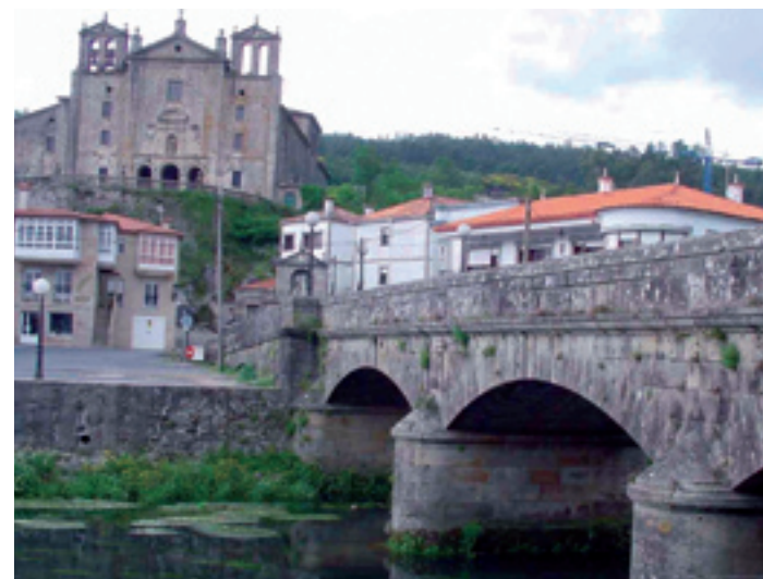
A Ponte de Santiago e o Convento do Carme.

Santiaguíño do Monte , santuario xacobeo, integrado polas penas, a casa do ermitán, fonte e ermida. Na porta oeste, escudón do arcebispo Rodrigo de Luna (s. XV): no in-