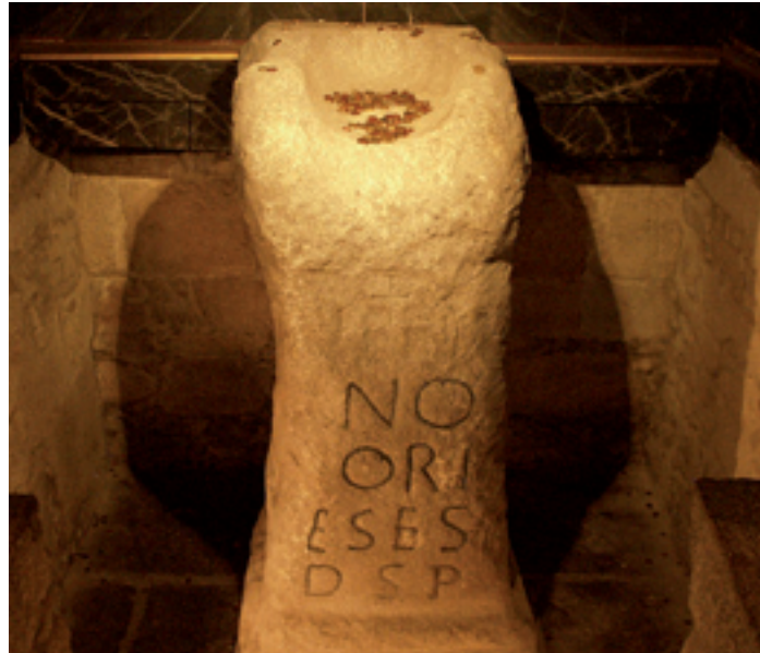
O Pedrón. Ara romana que se atopa na igrexa de Santiago de Padrón.