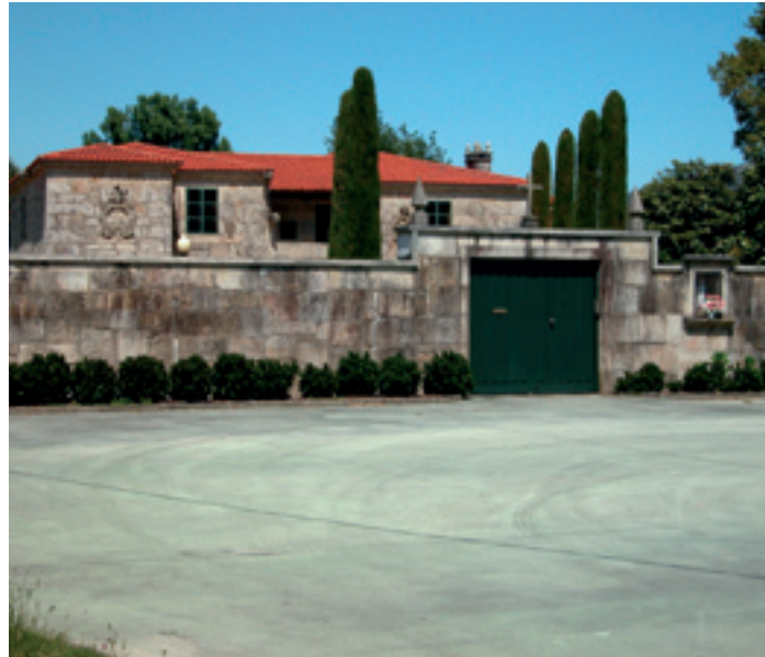
O Pazo do Vinculeiro. Extramundi.