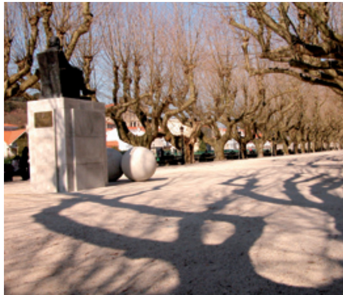
O Espolón co monumento á memoria de Camilo José Cela.