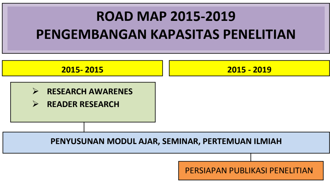
Gambar 2.1 Road Map Penelitian