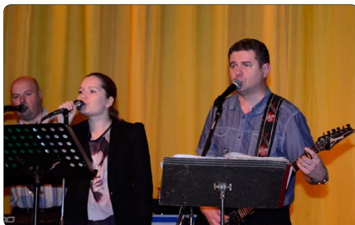
Rybářský ples 23. 1. 2015