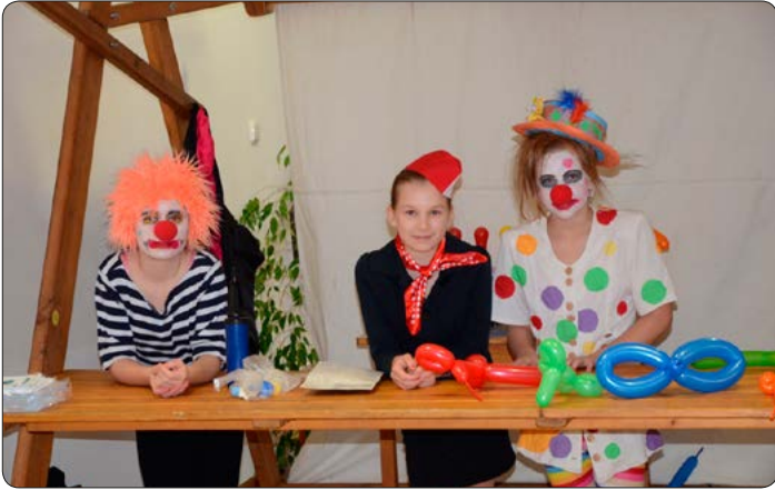
Dětský maškarní ples 25. 1. 2015