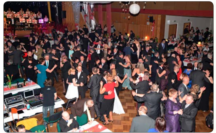
Ples Hlučínka 7. 2. 2015