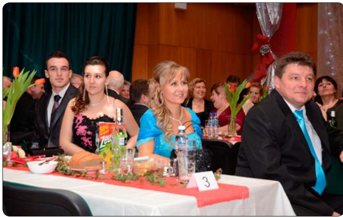
Ples Hlučínka 7. 2. 2015