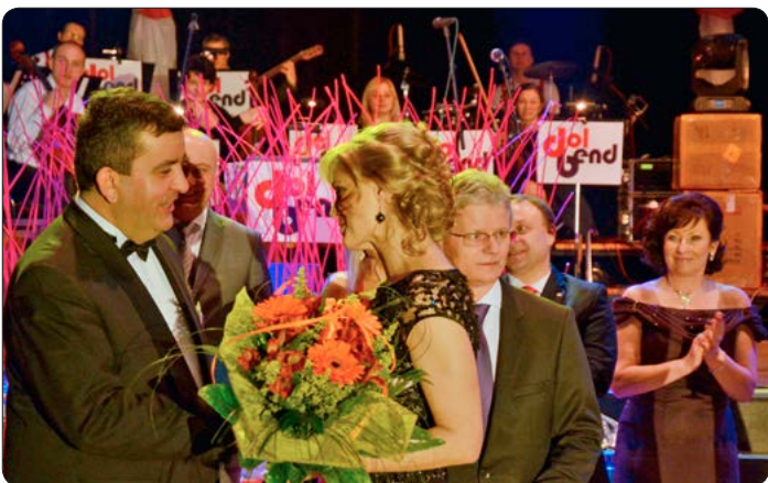
Ples Hlučínka 7. 2. 2015