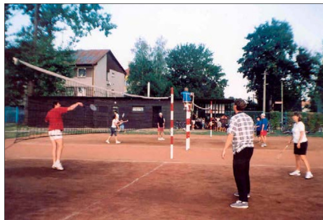
Archivní snímek ze začátku badmintonu v Dolním Benešově (srpen 2003)