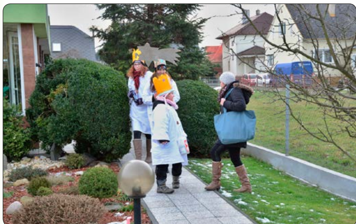
Tři kráři na OM 3. 1. 2015