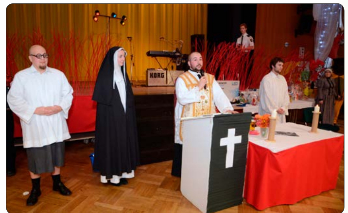
Ples hasičů a pochování basy 13. 2. 2015