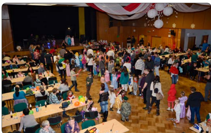
Dětský maškarní ples 25. 1. 2015