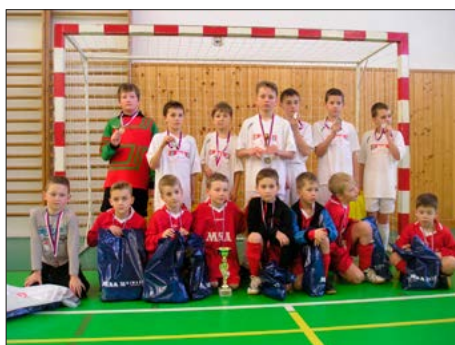
A pak že nerostou! Bohaté fotbalové podhoubí FC Dolní Benešov