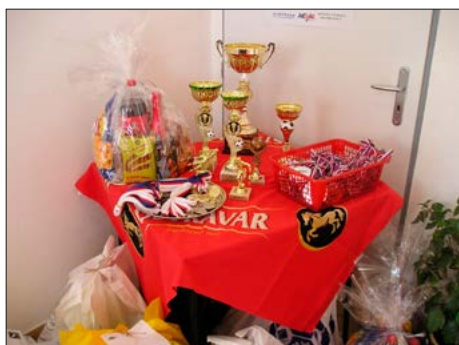
Fotbalové trofeje pro zúčastněná družstva