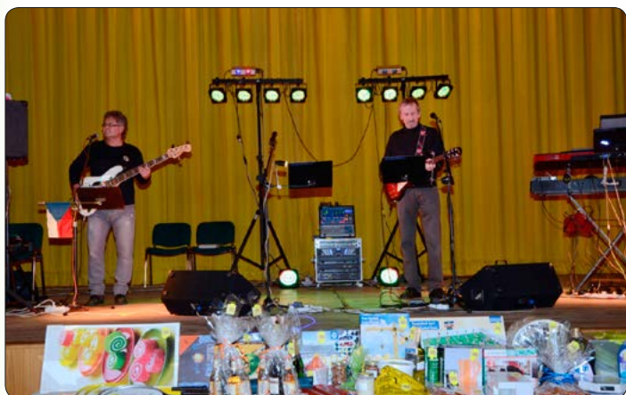
Myslivecký ples 9. 1. 2015