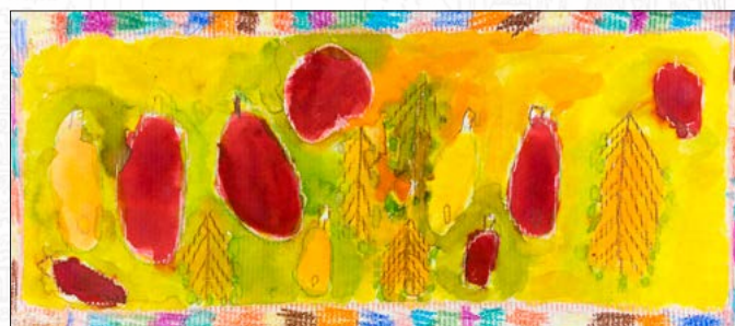
Z tvorby dětí „barevné školičky“