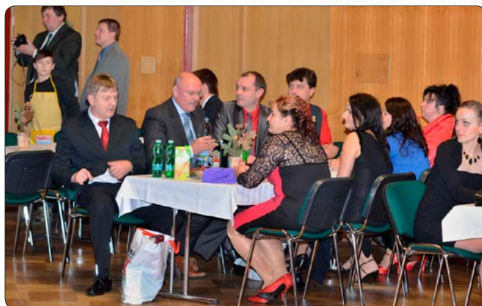
Myslivecký ples 9. 1. 2015