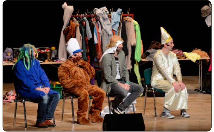
Partička 27. 1. 2015