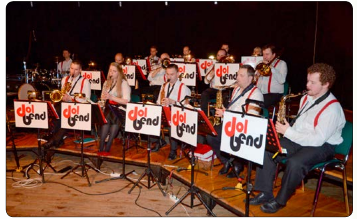
Městský ples 30. 1. 2015