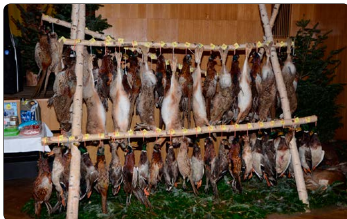
Myslivecký ples 9. 1. 2015