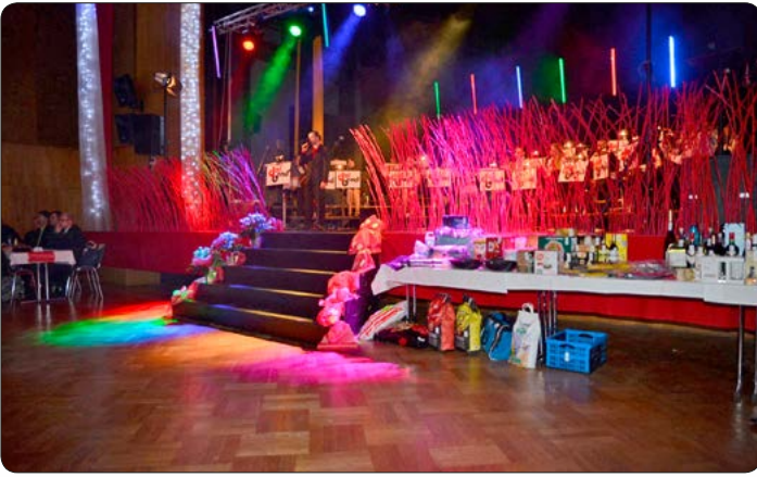
Městský ples 30. 1. 2015