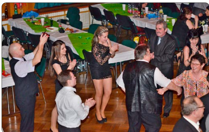
Rybářský ples 23. 1. 2015