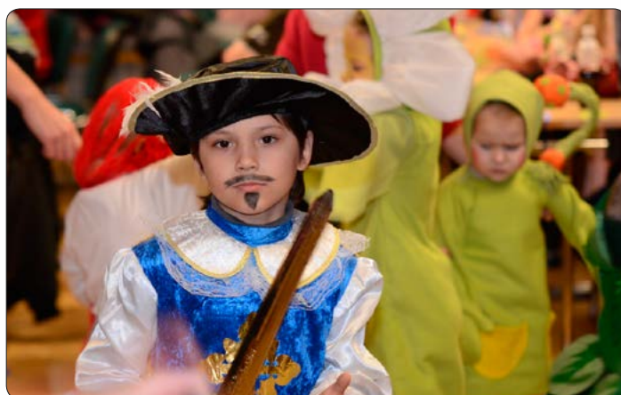
Dětský maškarní ples 25. 1. 2015