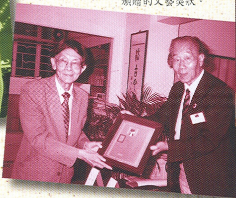
陳蝶衣接受台灣中國文藝協會頒贈的文藝獎狀。