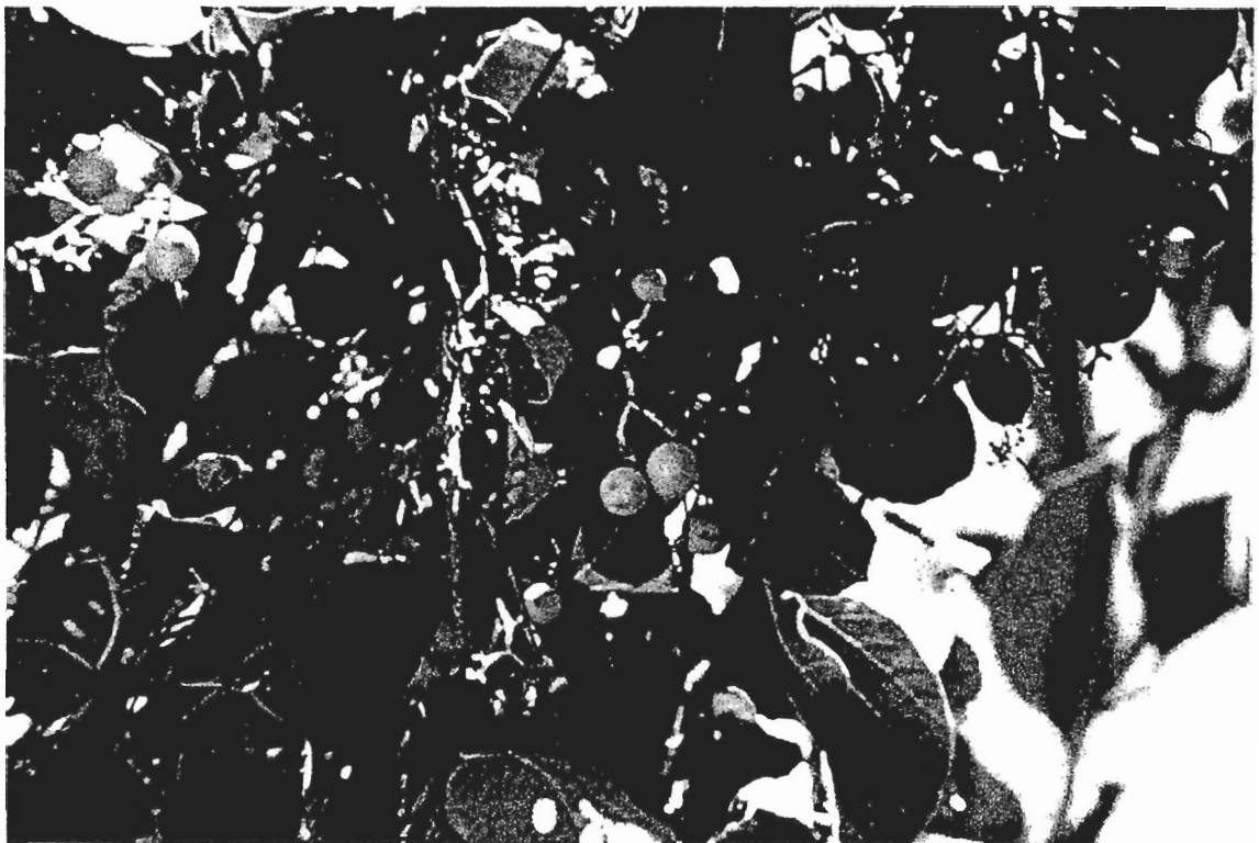
תמונה 6: ערף דביק בפארק אשקלון בעונת הפרי. הפירות שגודלם כשזיף קטנטן משמשים עד היום להכנת דבק ציפורים.

בגין תפוצתה הרבה של לכידת ציפורים באמצעות מקלות דבק בארצות שונות באגן הים התיכון בהווה, נתפרסמה שיטת הכנת הדבק. ניתן לשער שגם בעבר הכינו את הדבק בדרך שאינה שונה בהרבה. הנה למשל, עדות ראייה מקפריסין מלמדת על הפעולות הבאות: קטיף פירות הערף - לעתים במכבדים שלמים - הסרת