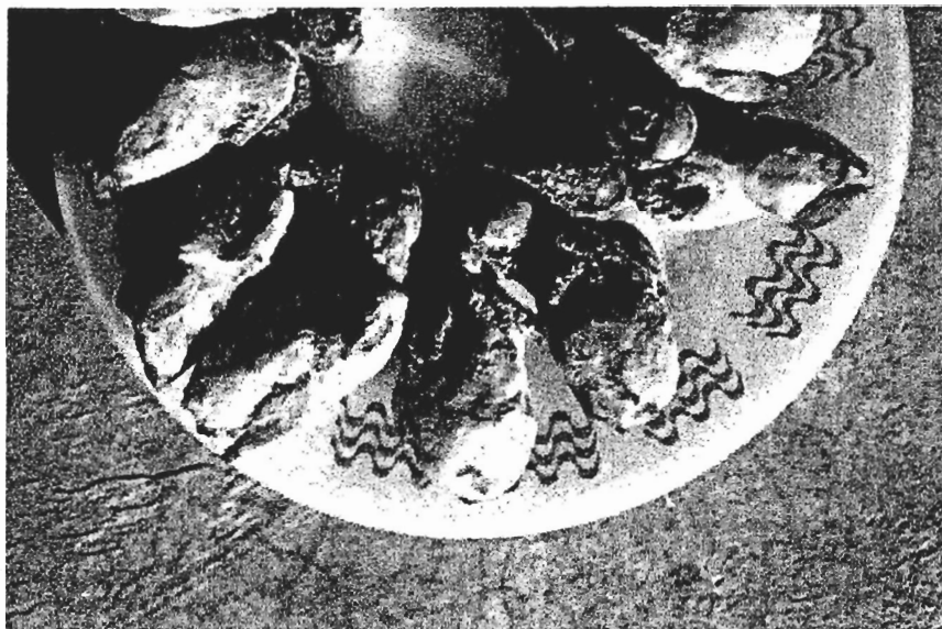
תמונה 4: פלטה של סבכים שתורי-כיפה מרוטים וקפואים, מוכנים לבישול ולאכילה. בעיירה Paratimni בדרום מערב קפריסין.

זאת, הבעיה המוצגת כאן מורה גם על הבעייתיות הכרוכה בהפעלת השיטה, בציבור יהודי המקפיד על הלכות כשרות, כאשר קורית תאונה והציפור נופלת (תמונה 4).