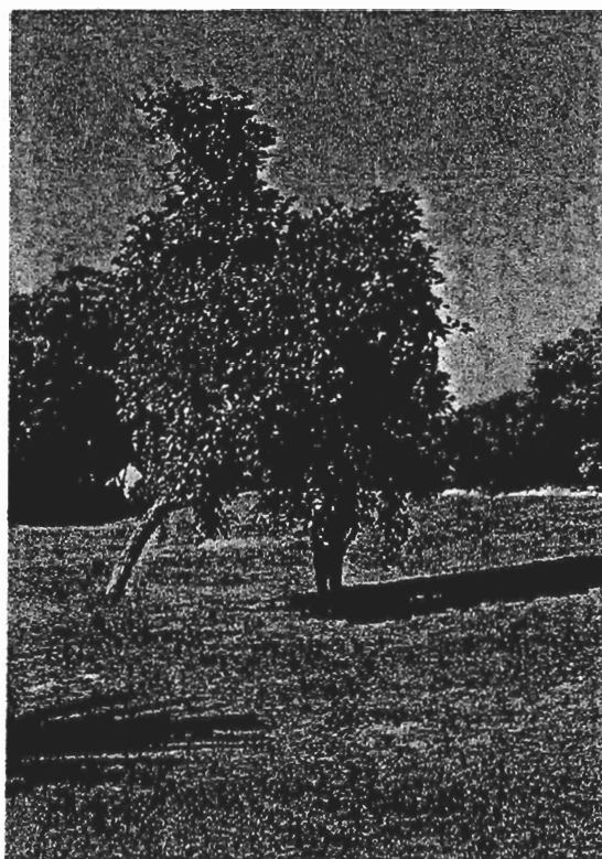
תמונה 5: ערף דביק. אחד העצים שגדלים בפארק אשקלון, לא רחוק מהכניסה, מימין לדרך.

שיטת לכידת הציפורים באמצעות מקלות דבק מחייבת, כמתבקש, מקור לדבק חזק ואמין. דומה, שצמח הערף יכול להיות מתאים לכך. מדובר בערף דביק, עץ ירוק-עד העשוי להגיע לגובה 12-17 מ', אך לא אחת הוא נפוץ כעץ קטן או שיח (תמונה 5).