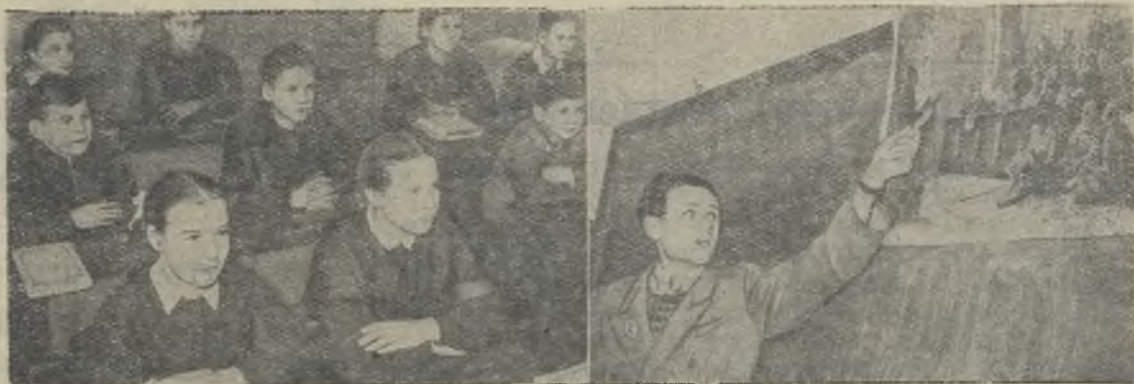
В первой половине января в городе вновь открыта средняя школа на 440 учащихся. На снимке: занятие по истории в 7 клас-