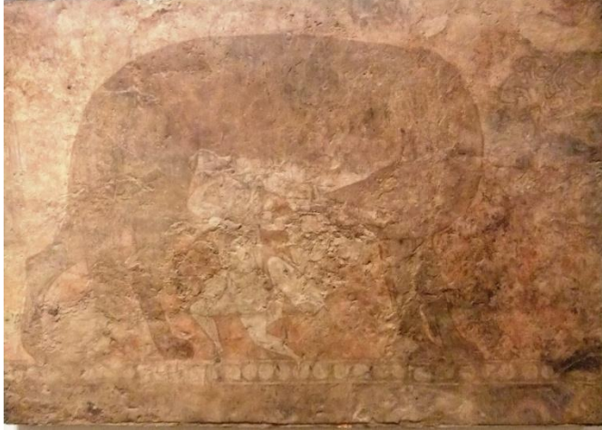
Resim 2. Kurt iki çocuğu emzirmekte, Kuru lös sıva üzerine tutkal renkler, 8. yüzyıl, St. Petersburg, Ermitaj Müzesi, Kalai Kahkaha, Saray oda 7.

duvar halısında yarı insan, yarı pars, kanatlı ve boynuzlu yaratık 11 , hem de Göktürklerin kurttan türeyişi efsanesinden bir sahneye işaret eden, kurttan süt emen iki çocuğu gösteren bir fresko (Resim 2) İslam öncesi dönemde görsel sanatlarımıza yansıyan mitolojik karakterlerimizin birkaç örneğidir. Bunlar genelde, büyücülük, büyüklere saygı ve mitolojik olayları canlandırma amacıyla yapılmışlardır ve çoğunlukla taşınabilecek küçük veya orta ölçüdedirler.