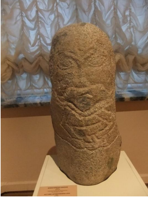
Resim 1. Türk Antropomorfik Dikilitaş, 8-9. yüzyıl, Kuzey Kırgızistan veya Kazakistan, bulunma tarihi 1917 den önce, St. Petersburg, Ermitaj Müzesi, Orta Asya bölümü

Budizme inanan Uygur Türklerinden Hoço, Bezelik gibi şehirlerde birçok Buda heykelleri kalmış olsa da 4 Maniheizme inanan Türklerin kitap resimleri veya Kültigin adına yapılan abideler günümüze ulaşmış olsa da 5 , genelde Tengrici Türklerde- Yunanlıların yaptığı gibi mitoslardan türemiş tanrıların büyük ölçülerdeki heykellerini ve duvar resimlerini görmek mümkün değildir, hele Fidias'ın İ.Ö. 447- 432 yılları arasında yaptığı 11 metre yüksekliğindeki akıllı savaş tanrısı Athena'nın 6 heykeline benzerini veya Kommagene kralı Antiochus Theos emriyle M. Ö. 62 yılında Nemrut dağının tepesinde yapılan dev tanrı heykellerinin 7 benzerini İslam öncesi Türk sanatında bulmak imkansız gözükmemektedir. İslam öncesi Tengrici Türklerde genelde küçük veya orta boyalarda yapılan heykeller bulunmaktadır ki bunlar esasta tapmak amacıyla değil, bir olayı ve bir varlığı belirginleştirmek, anıtlara dönüştürmek veya büyücülük amacıyla yapılmıştır.