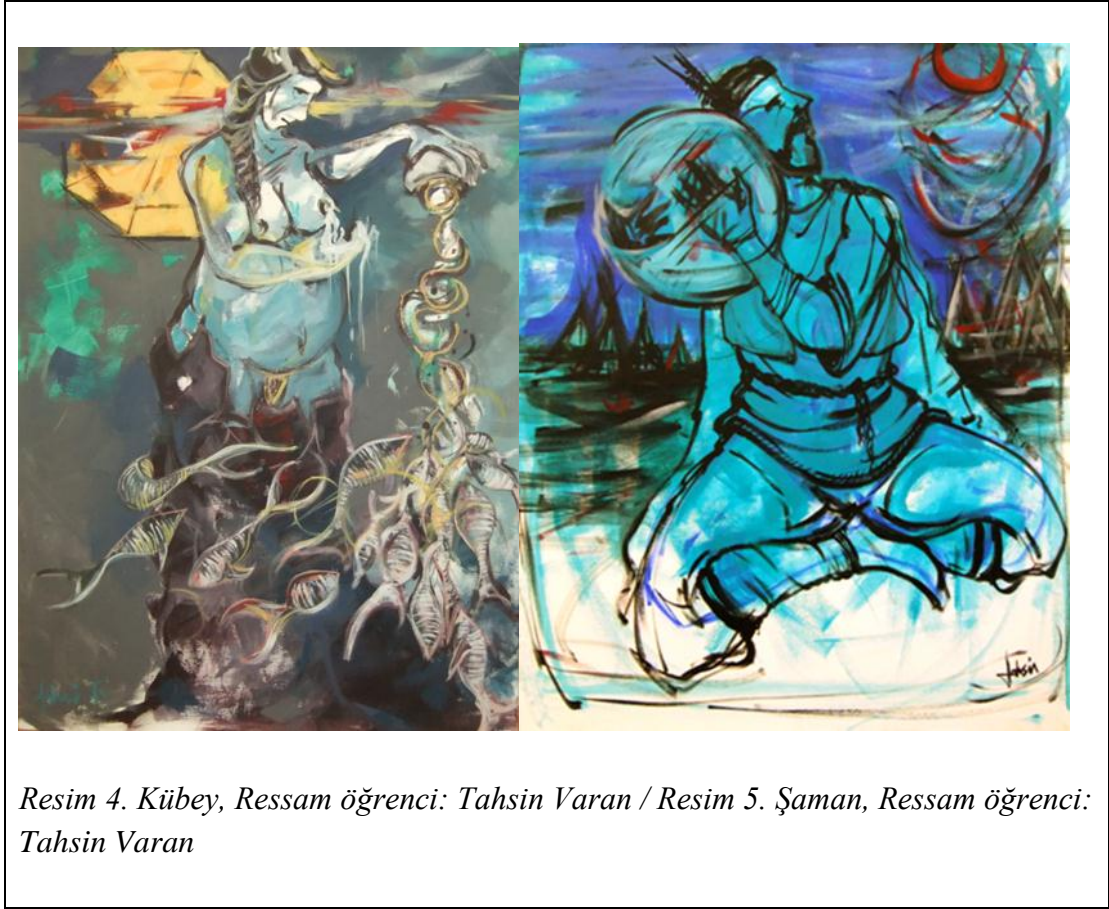
Resim 4. Kübeş, Ressam öğrenci: Tahsin Varan / Resim 5. Şaman, Ressam öğrenci: Tahsin Varan